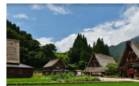
菅沼合掌造り集落