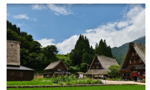
菅沼合掌造り集落