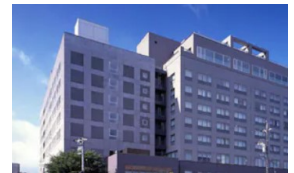
飛驒高山温泉 ひだホテルプラザ

⇒ 高山西IC ⇒ 飛驒の里(見学) ⇒ 高山市 ひだホテルプラザ(泊) 14:30～15:45 16:00頃 到着