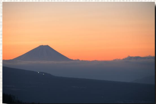
安藤さんの作品 信州の冬景色