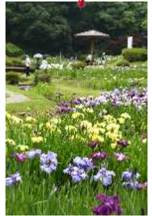
西尾 性海寺紫陽花(左2枚) 百年公園の花菖蒲と 岩の苔とコラボする紫陽花