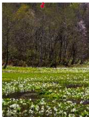
生地さん 左側 4月28日 飛騨池ヶ原湿原に咲く水芭蕉とリュウキンカ 右側 4月7日 名古屋ブルーポーネットで撮った幻想的な写真 下側 4月13日 豊田ガーデンで撮影