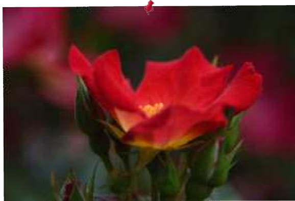
西尾 5月17日 花フェスタ記念公園にて