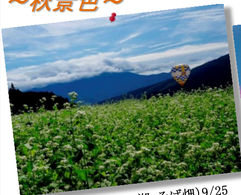
⑫by Mr.Onji (糎の湖;そば畑)9/25