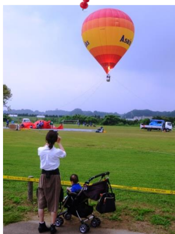
⑮by Mr.Murata (母子)9/17