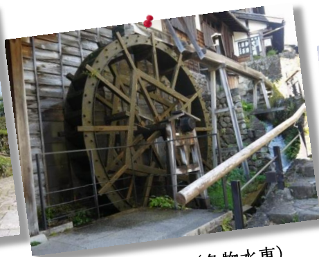
⑩by Mr.Fukuda (名物水車)