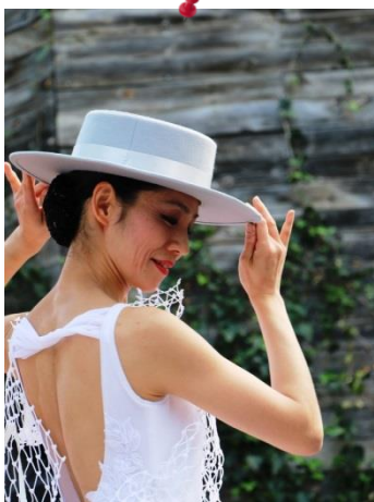
⑯by Mr.Matsukura (フラメンコ)10/16