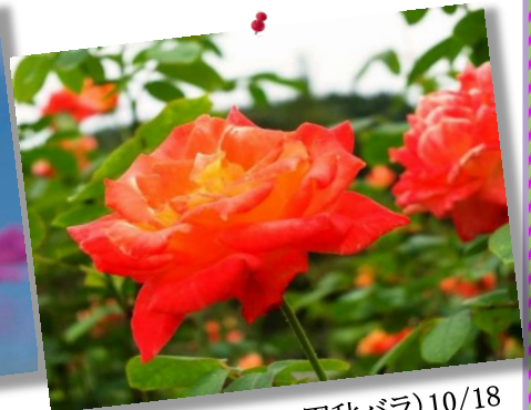
⑭by Mr.Nishio (花フェスタ公園秋バラ)10/18