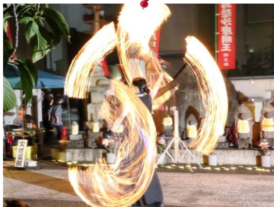
⑰by Mr.Matsukura (火付盗賊)10/16