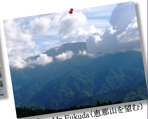
⑪by Mr.Fukuda (恵那山を望む)