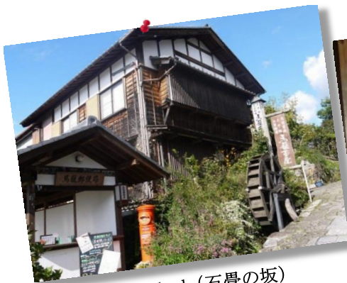
⑨by Mr.Fukuda (石畳の坂)