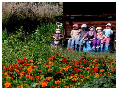
⑪by Mr.Onji (里山のコスモス)