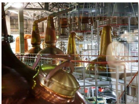
⑦by Mr.Nishio (サントリー白洲工場)