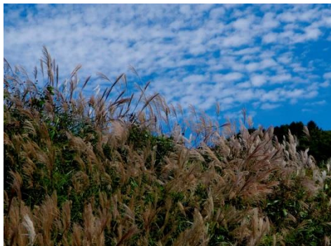
⑩by Mr.Onji (ススキと澄んだ空！)