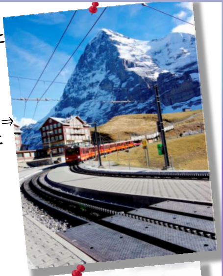
② by Mr.Onji; アイガー北壁 ⇒ ゴルナーグラード展望台に向かう鉄道