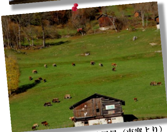
③ by Mr.Onji; 放牧風景 (車窓より)