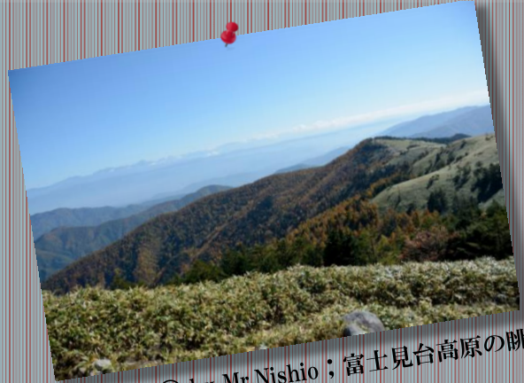
⑨ 富士見台高原の眺め