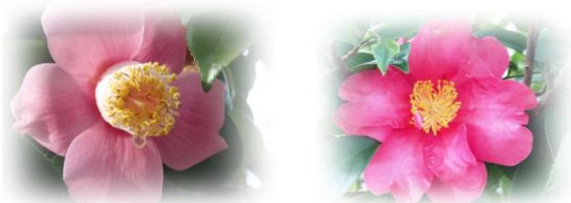
⑮ by Mr.Matsukura; 椿と山茶花