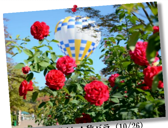
⑬ by Mr.Nishio; 秋バラ (10/26)