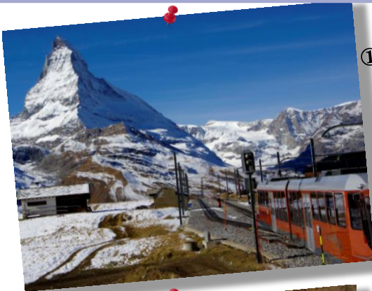
① by Mr.Onji; マッターホルンを望むゴルナーグラード展望台に向かう鉄道