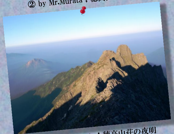
④ by Mr.Murata; 穂高山荘の夜明