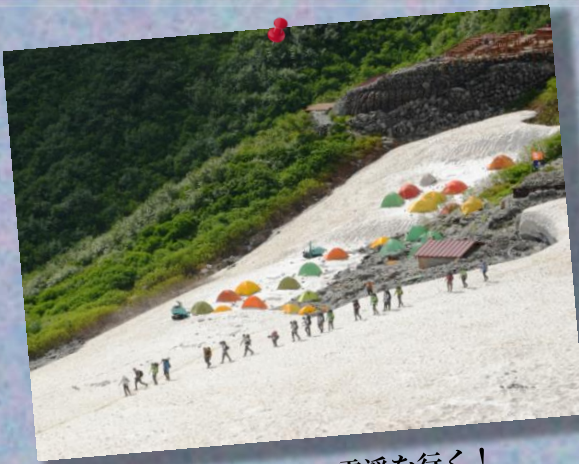
① by Mr.Murata; 雪溪に行く!