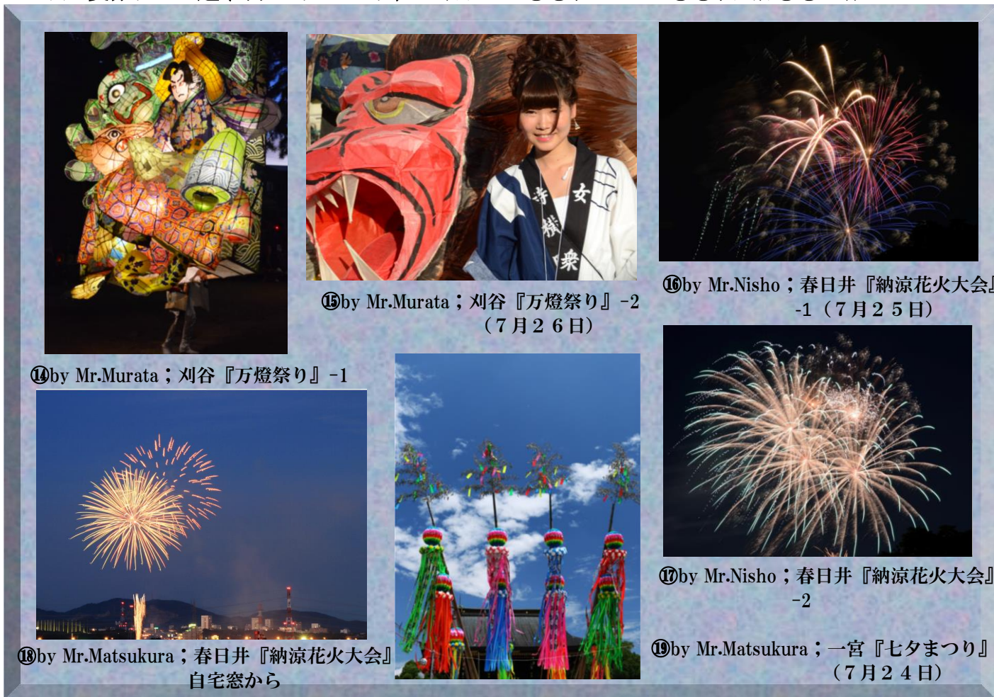
⑭by Mr.Murata ; 刈谷『万燈祭り』-1