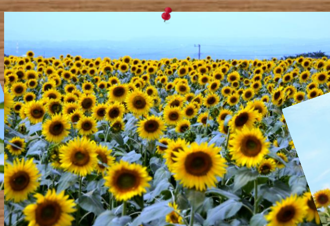
⑥ by Mr.Nishio