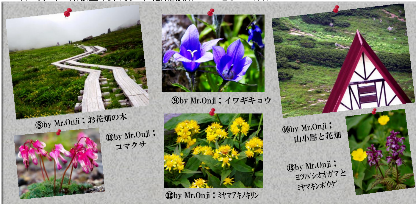
⑧by Mr.Onji ; お花畑の木