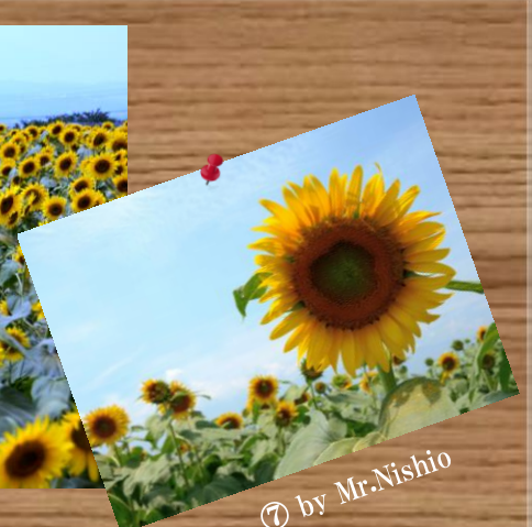
⑦ by Mr.Nishio