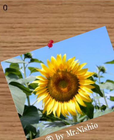
⑤ by Mr.Nishio