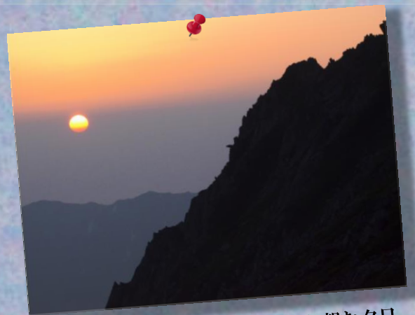
② by Mr.Murata; 穂高山荘から望む夕日