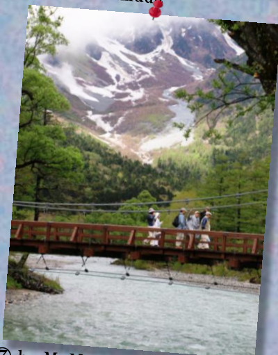
⑦ by Mr.Matsukura; 梓川&河童橋!