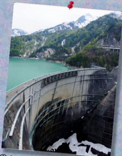
① 雄大な! 黒部ダム

☆ 5月18・19日 松寿会春レク『黒部ダム~上高地』一泊旅行...生地さん、福田さん、松倉の作品