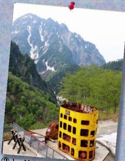
② by MrMatsukura; 巨大な コンクリートバスケットと山景色!