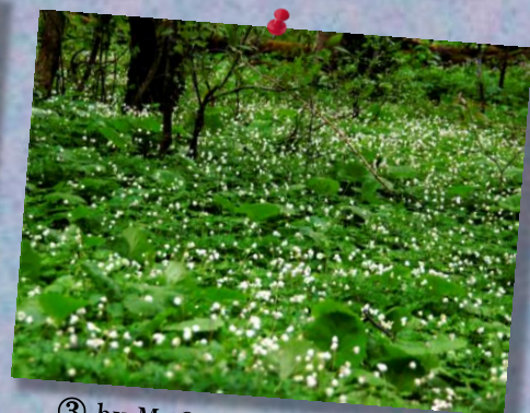
③ by Mr.Oni; ニリンソウの群生 (上高地、明神池)