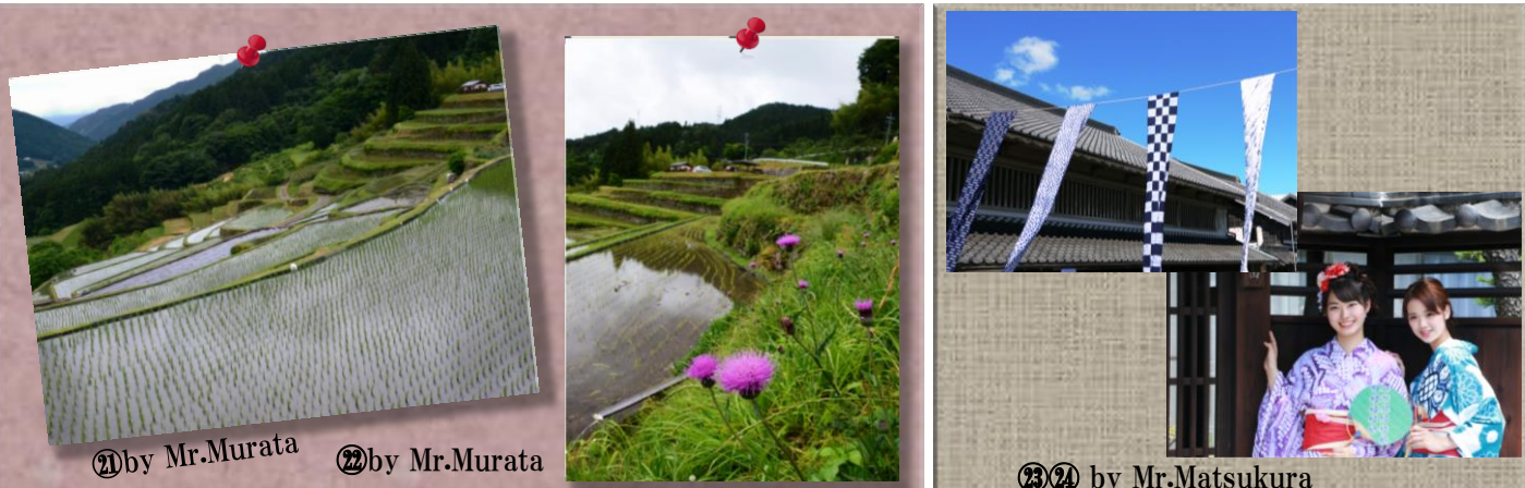
⑳ by Mr.Murata