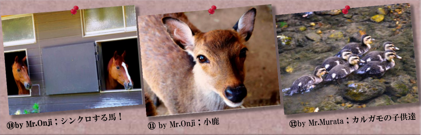
⑩ by Mr.Onji；シンクロする馬！