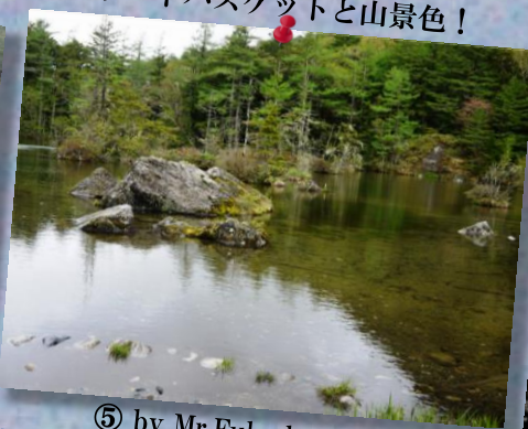
⑤ by Mr.Fukuda