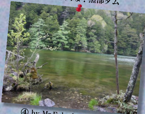
④ by Mr.Fukuda