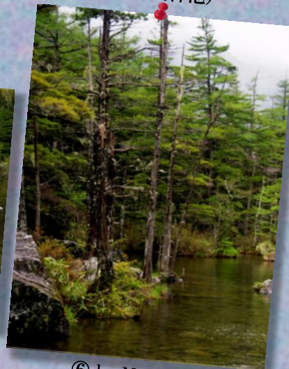
⑥ by Mr.Onji