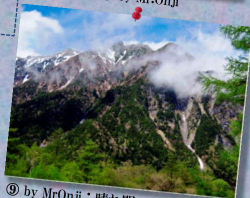
⑨ by MrOnji; 晴れ間の山頂! (穂高?) 車窓から