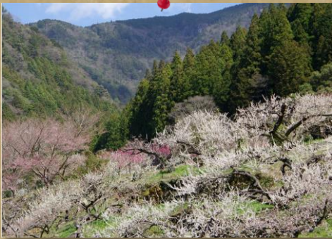
⑫ by Mr.Onji；新城市 川売の梅