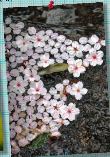
⑨ by Mr.Matsukura ; 堀川に浮かぶ!