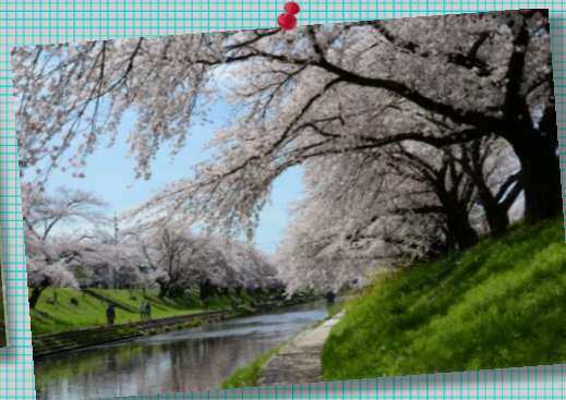
③ by MrMurata ;