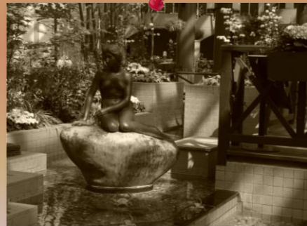
⑱ ；人魚姫像