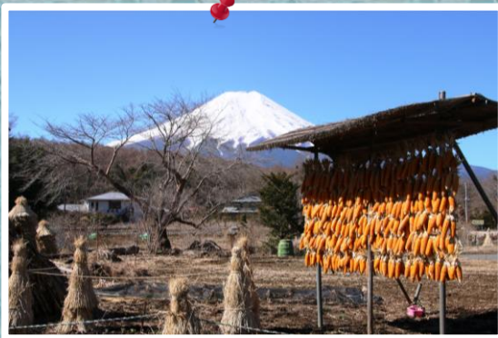
⑮ by Mr.Matsukura；忍野村から