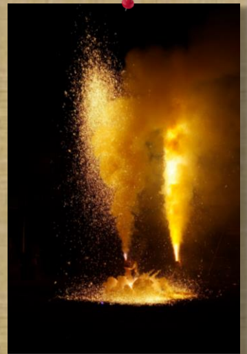
⑭ by Mr.Onji； 豊川菟足神社「風まつり」 の手筒花火