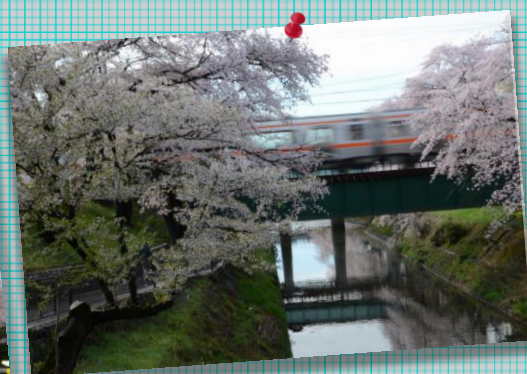
② by MrMurata ; 桜電車?!