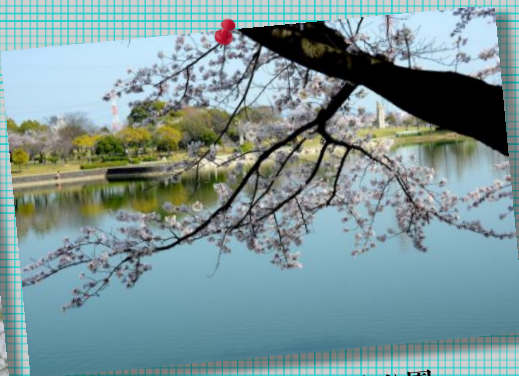
⑥ 落合公園