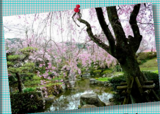
⑦ by Mr.Nishi ; 東谷山FP-1