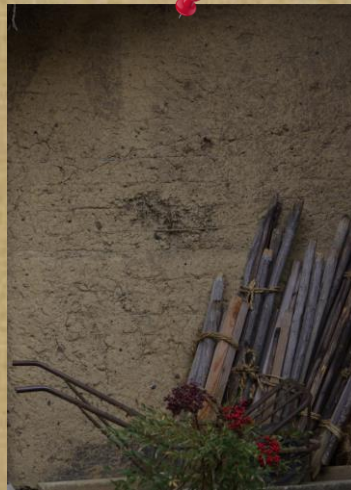
⑬ by Mr.Onji；松本市四賀の農家