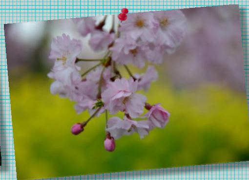
⑧ by Mr.Nishi;東谷山FP-1