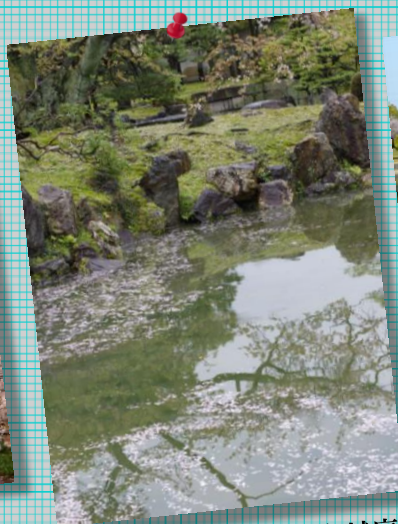
⑤ 京都二条城庭園