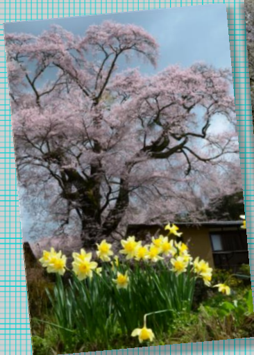
① by MrMurata ; 里山の桜!

☆ 3月30日~4月9日;それぞれの『桜風景』・・・生地さん、村田さん、西尾さん、松倉の作品