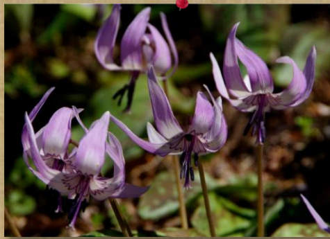
← ⑪ by Mr.Onji； 香嵐溪の“カタクリ”