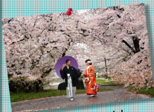
④ by MrMurata ; 満開の二人!