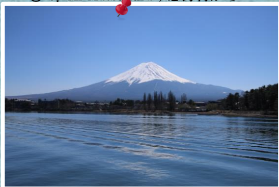
⑯ by Mr.Matsukura；河口湖から