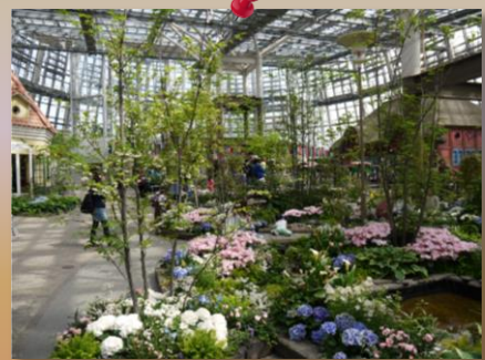
⑰花に囲まれて・・・