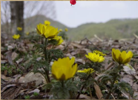
⑩ by Mr.Onji；松本市四賀の福寿草