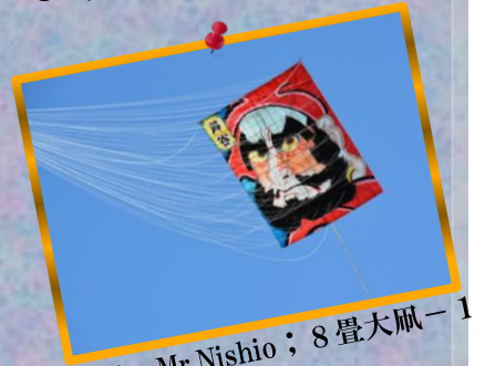
⑥ by Mr.Nishio ; 8畳大凧-1