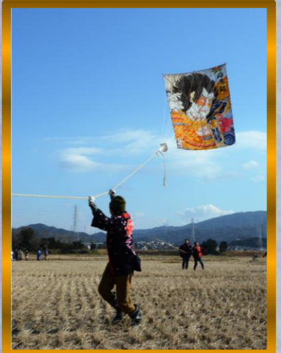
③ by Mr.Murata ; 風をつかむ!