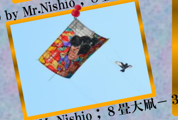
⑨ by Mr.Nishio ; 8畳大凧-3