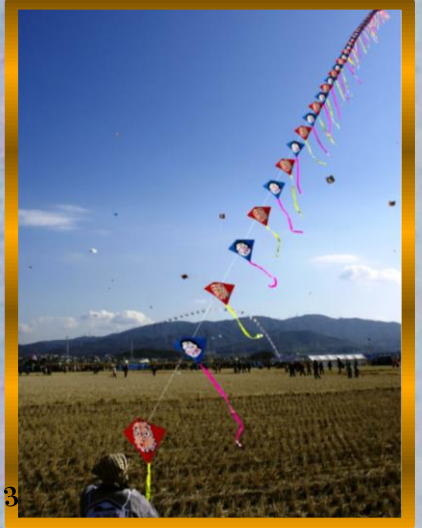
⑩ by Mr.Onji ; 100連凧!