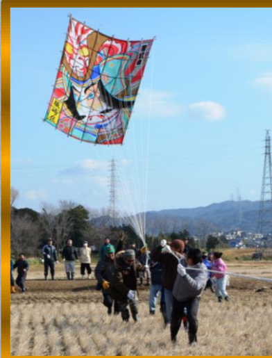
② by Mr.Murata ; 一気にスタート!