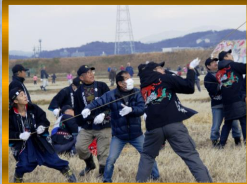
⑤ by Mr.Onji ; チームワークで!