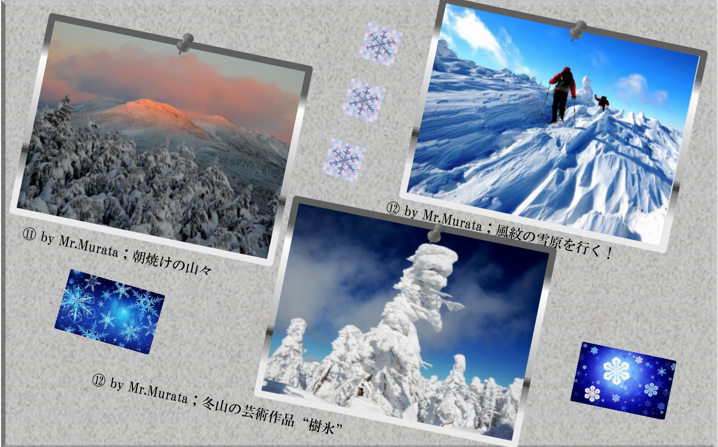
⑪ by Mr.Murata ; 朝焼けの山々