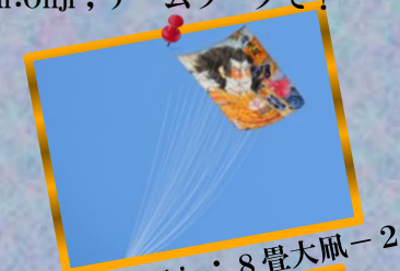
⑧ by Mr.Nishio ; 8畳大凧-2