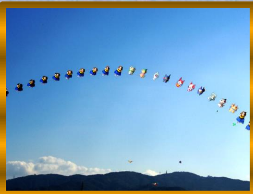
⑦ by Mr.Onji ; アーチ型連凧!