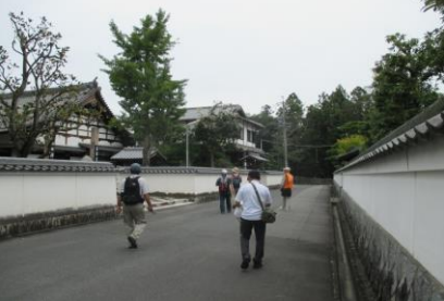
0164 見応えある白壁の塀