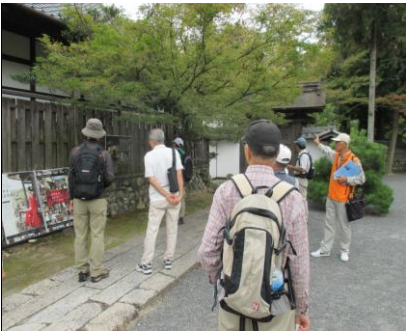
0142 結婚式場として活用