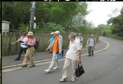
0131 参道をゆっくり歩く