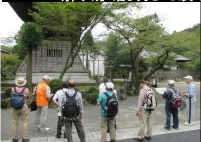
0133 鐘楼の説明を聴く