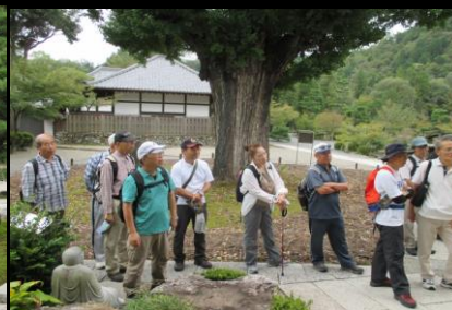
0140 大イチョウの前で