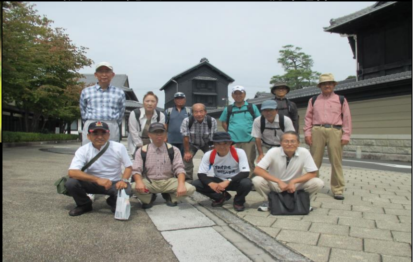
0176 オリベストリートに全員無事到着！