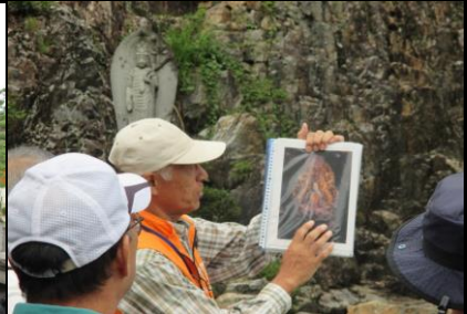
0157 詳しい写真で説明を受ける