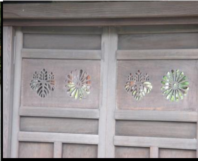
0143 天皇家の菊のご紋ではない