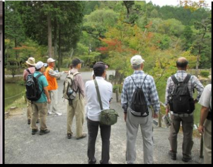
0144 詳しい説明を聴く