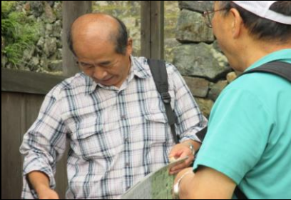
0171 談笑する髭右近さん