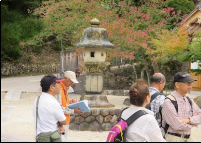
0159 珍しい焼き物の灯籠