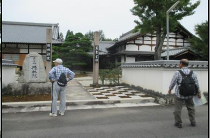
0166 永保寺群の徳林院