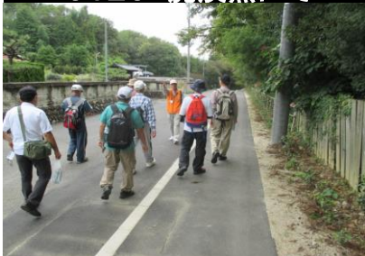
0130 解り易く説明して頂く