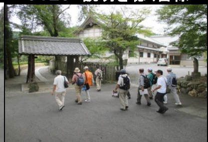
0132 入口の黒門に到着