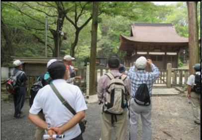
0148 開山堂の説明を聴く