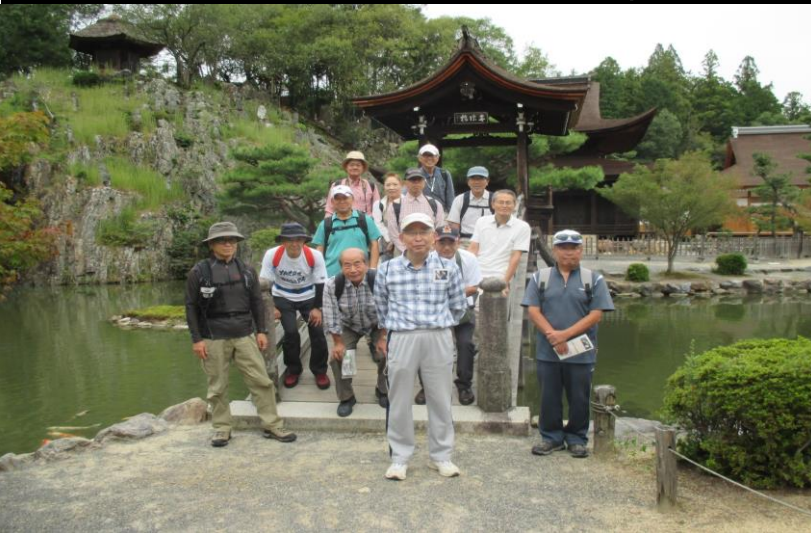
0151 屋形のある橋の前で