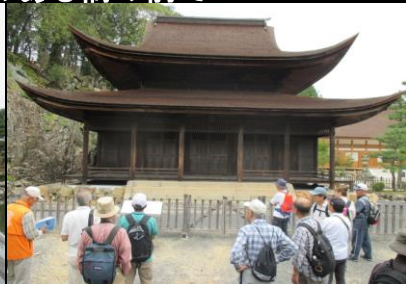
0156 国宝の観音堂を見入る