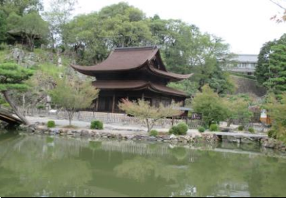
0145 湖畔に佇む観音堂