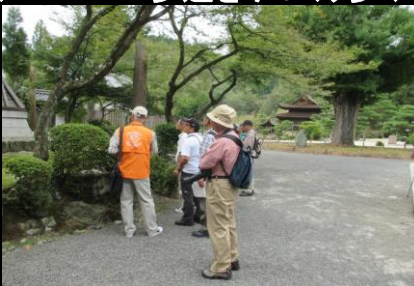
0135 銀杏の見頃にはまだ早い