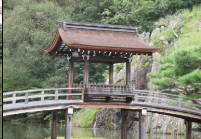
0146 池に架かる屋形のある橋