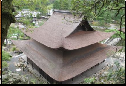
0162 上から見た観音堂