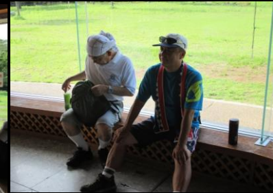
0032 頭上の白いタオルが似合う