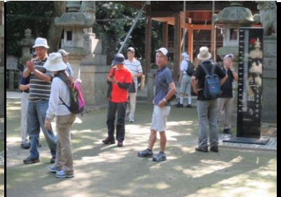
0041 余裕を感じさせます