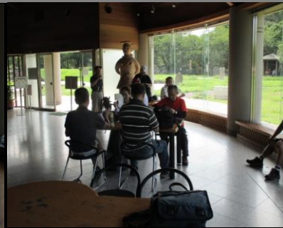
0028 窓の大きな休憩所にて