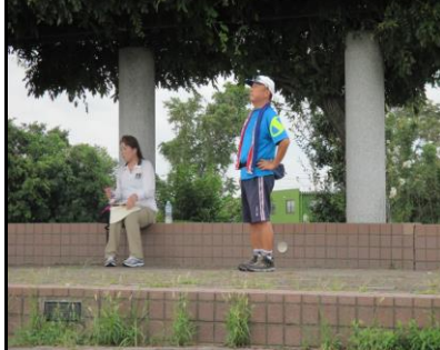
0045 誰かと誰かのツーショット