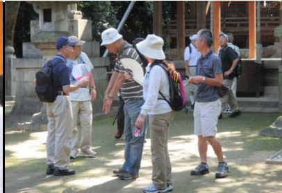
0040 夏はやっぱり扇子