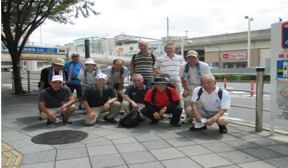
0050 全員無事ゴール JR勝川駅に到着