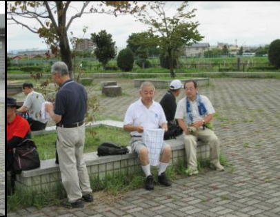
0043 腰かけで暫し休憩