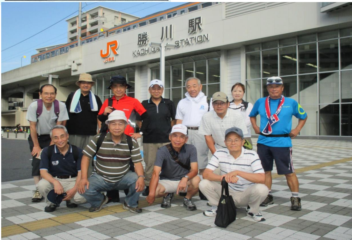
0023 皆さん明るい笑顔で勝川駅を総勢13名がスタート