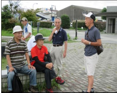
0042 エアフロントで休憩