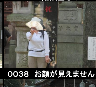
0038 お顔が見えません