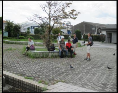
0044 上空には自衛隊練習機が