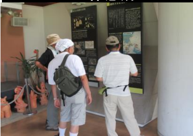
0029 二子山古墳を知る