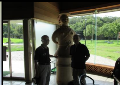
0031 等身大の埴輪の前で