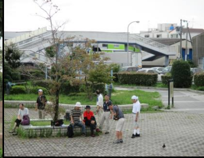
0046 皆さんまだまだ余裕あり