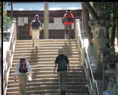
0034 朝の陽ざしが心地いい！