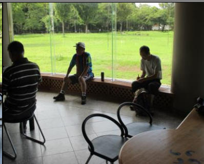
0027 夏はやっぱり短パンだ！