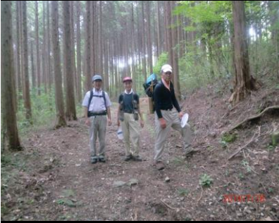
9425 背中に大玉スイカ