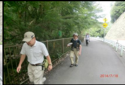
9417 距離間隔が広がる