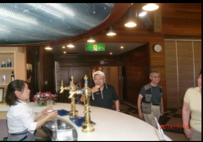
9460 出来立ては上手い!