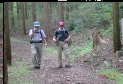
9424 気持ちがいい小道