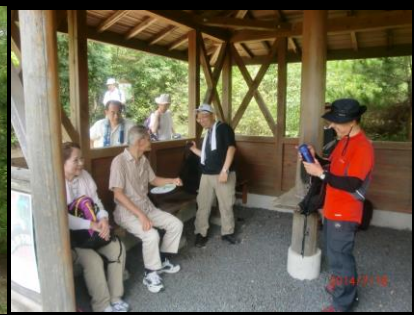
9438 ゴール近くで余裕