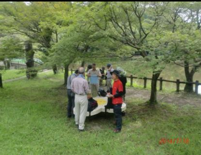
9419 タオルに汗がびっしょり