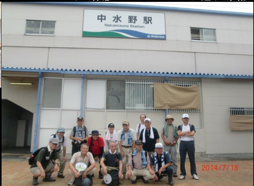
9441 全員無事ゴール到着 愛環・中水野駅到着