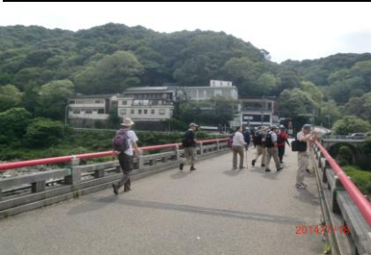
9415 眼下に庄内川が流れる