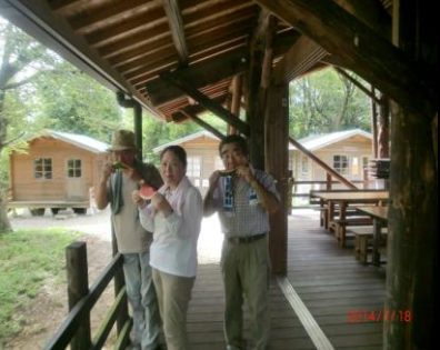
9435 スイカ 美味しい