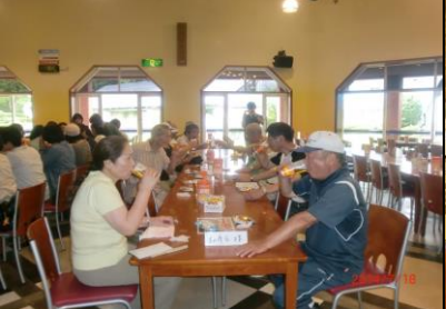
9449 スーパードライをゴク!