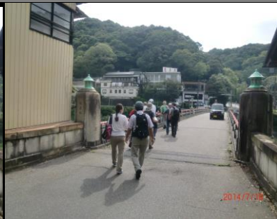
9413 レトロ感の城嶺橋