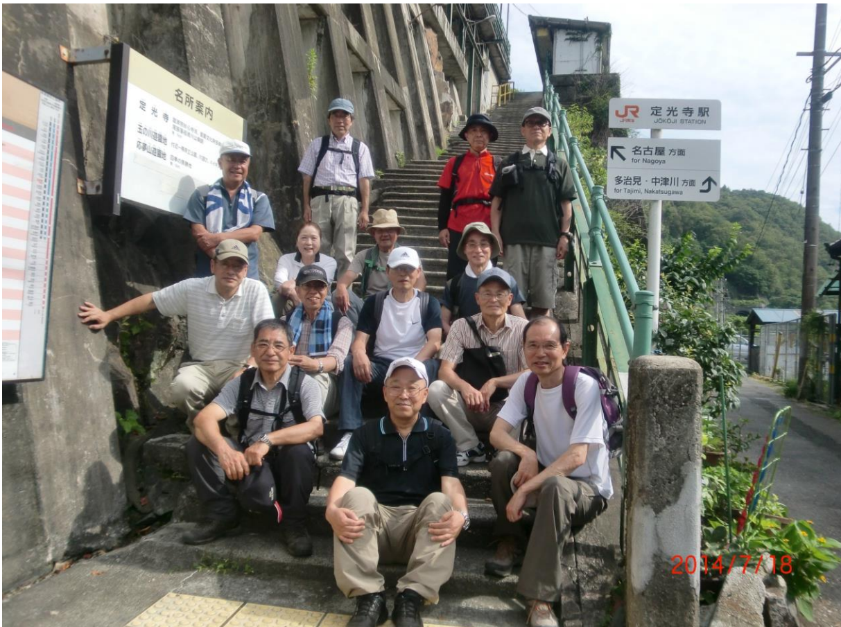
9411 皆さん明るい笑顔で定光寺駅を総勢15名がスタート