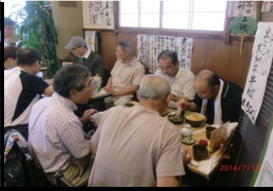
9445 親子丼も美味しい