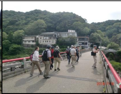
9414 赤い手すりも風情