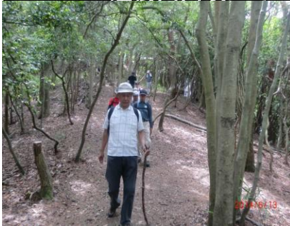
9352 いざ 大谷山へ