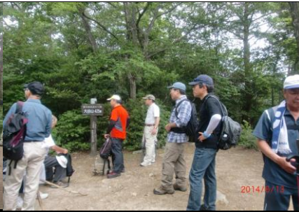
9357 山頂から下界を観る