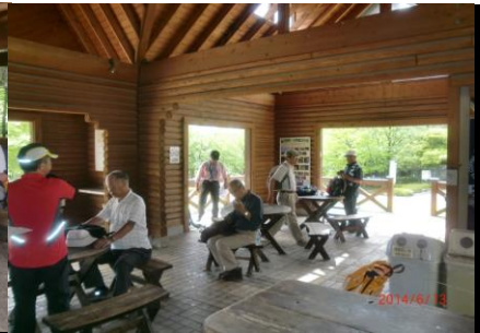
9400 植物園内ログハウス