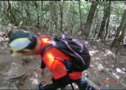
9365 いよいよ最後の登り