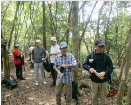
9340 最初のお茶タイム