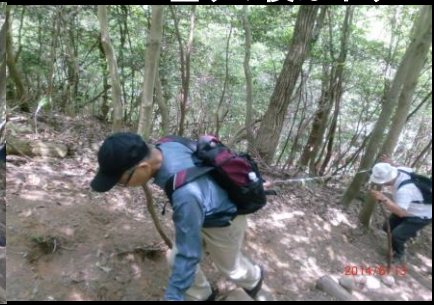
9366 ロープと杖が頼り