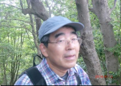
9382 息が荒れています