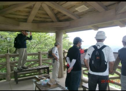
9389 ビデオは回っている