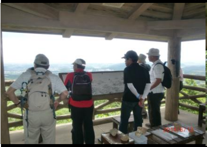
9387 名古屋駅付近を望む