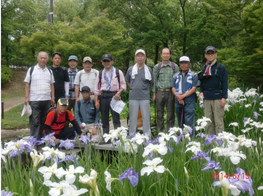
9402 植物園内の満開の菖蒲池にて