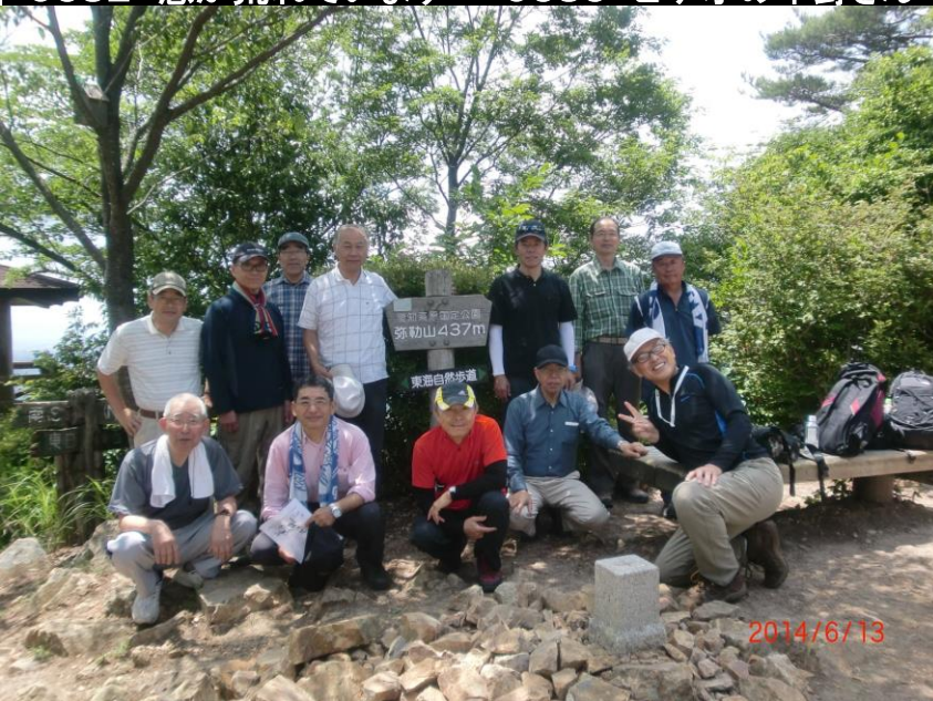
9384 弥勒山 山頂にて