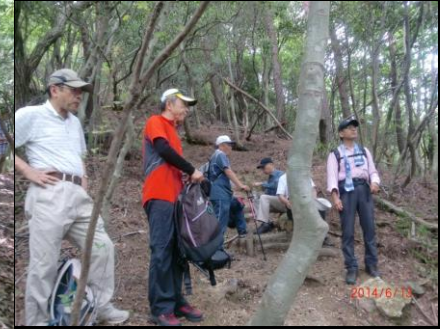
9345 2回目のお茶タイム