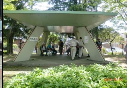
9273 ふれあい緑道の休憩所にて