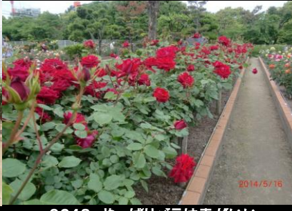
9248 やっぱりバラは赤がいい