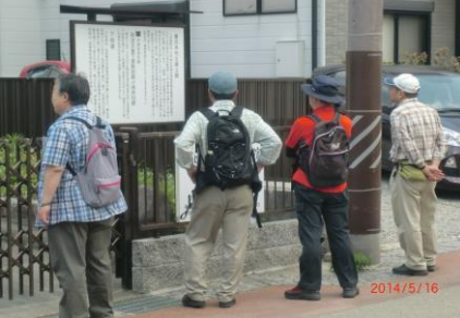
9272 春日井の歴史を知る