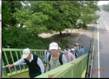
9229 皆さん陸橋を渡る！