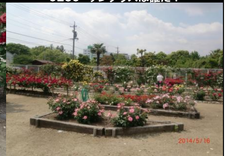
9237 一面に広がるバラの園