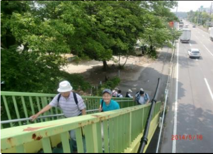
9228 交通ルールを守って陸橋を渡る