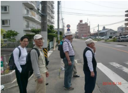
9224 皆さん余裕たっぷり