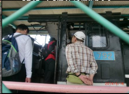
9264 やっぱり男の子だね！