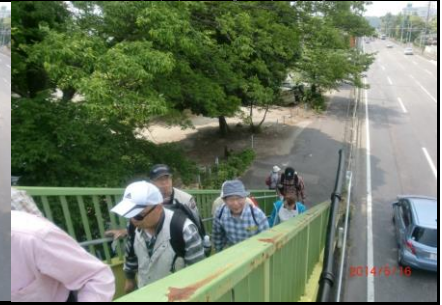
9230 サングラスは誰だ？