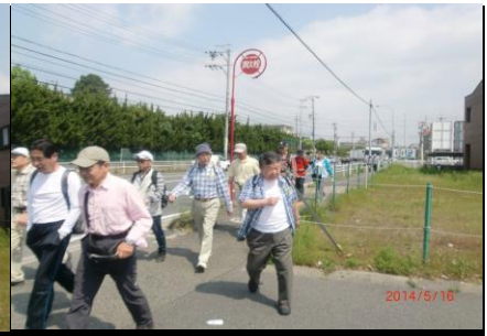
9227 ポケットに手は入れないで！