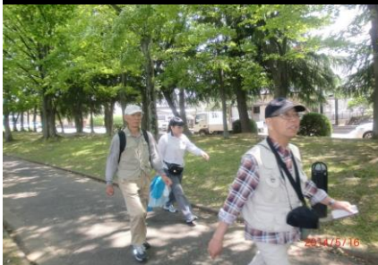
9284 颯爽と歩く皆さん