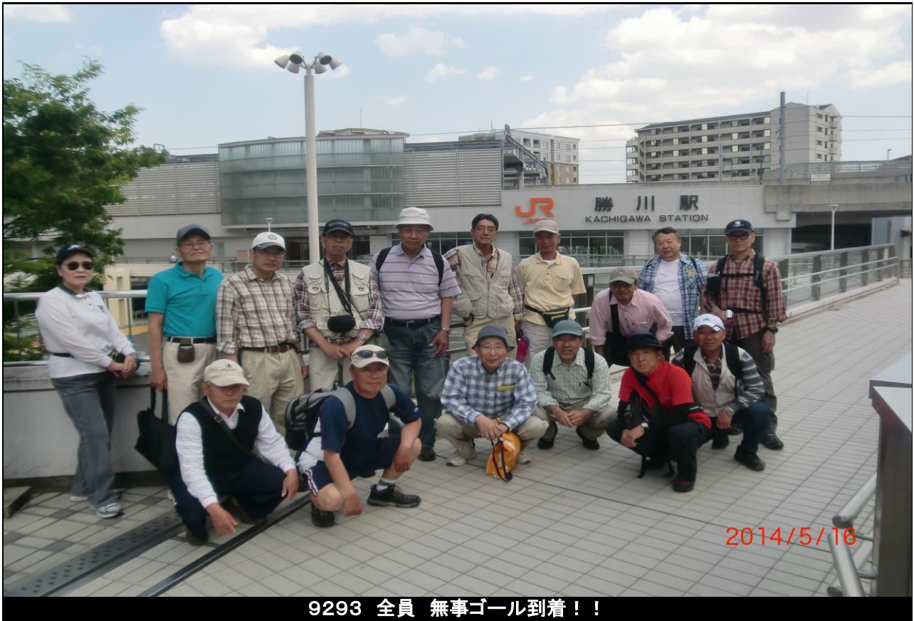
9293 全員 無事ゴール到着！！