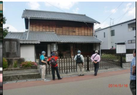
9271 春日井市郷土館にて