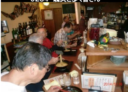
9289 特製カレーうどんを頂く