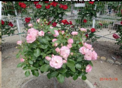
9235 ピンクの薔薇 綺麗！！