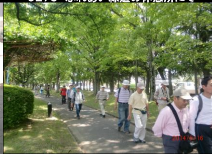
9281 新緑のふれあい緑道を歩く