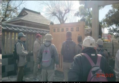
9026 綺麗に家紋が並べている