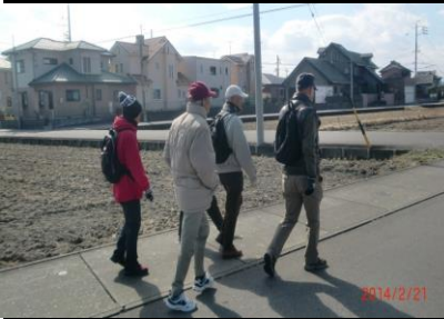
9013 田園風景の中を歩く