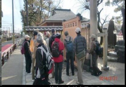
9027 皆さん家紋を見入る