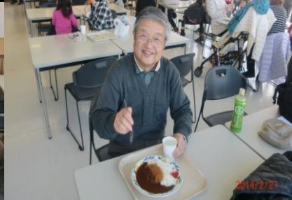
9006 カレーの味はいかがでしたか？