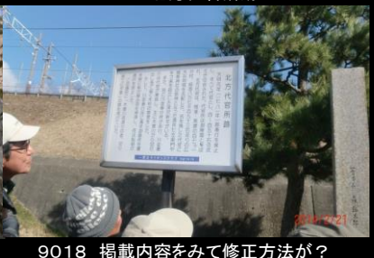
9018 掲載内容を見て修正方法が？