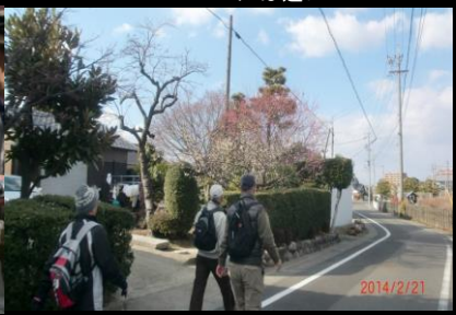
9034 見事に咲いた白梅と紅梅