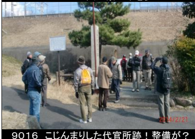
9016 こじんまりした代官所跡！整備が？