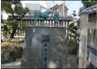
9028 山内一豊公銅像前にて