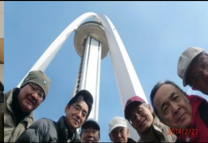
9009 皆さんとタワーと一緒に