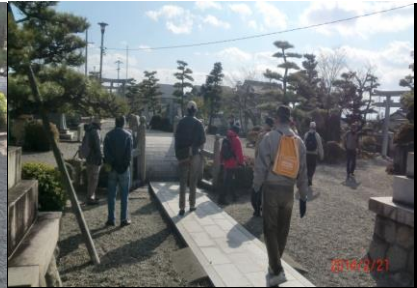
9024 石造りの太鼓橋(渡れません！)