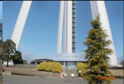
9001 近くでは全体が撮れません！