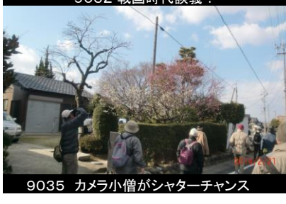
9035 カメラ小僧がシャッターチャンス