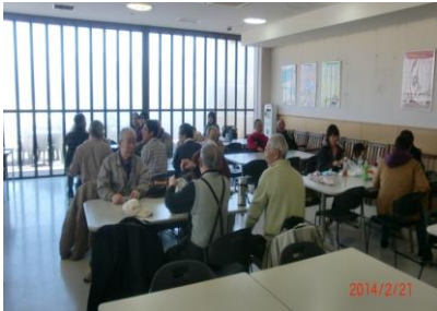
9002 前回同様に待つことに慣れた！