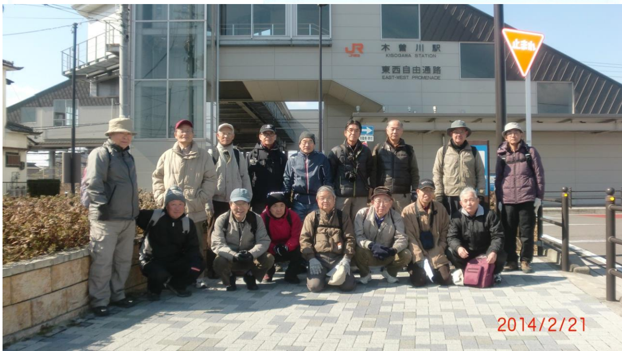
8985 JR木曾川駅にて、いざスタート!