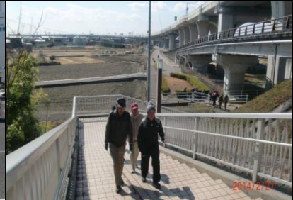
8992 南派川の堤防に上る