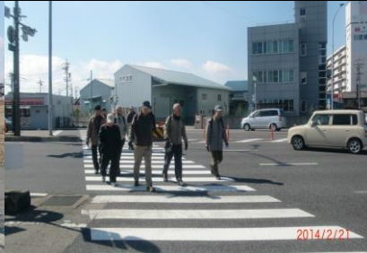
8991 名岐バイパスを渡る