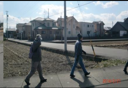
9014 風でシャッポが飛びそう！