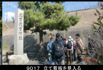
9017 立て看板を見入る