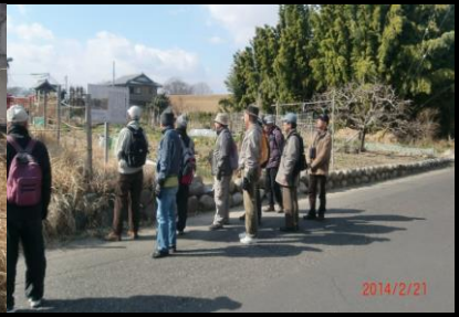
9021 ここでも修正方法が？