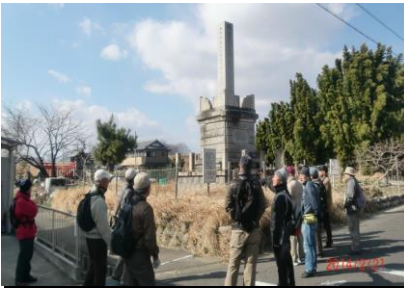
9022 明治天皇ご休憩所跡にて