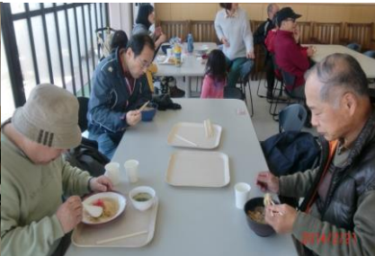
9003 待望の暖かいお昼