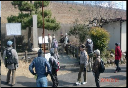
9015 北方代官所跡にて