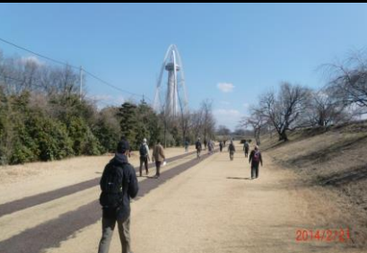
9000 冬枯れした芝生の上を思い思いに