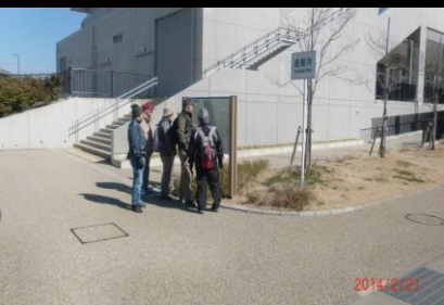
8997 案内図を見て公園の広さを知る