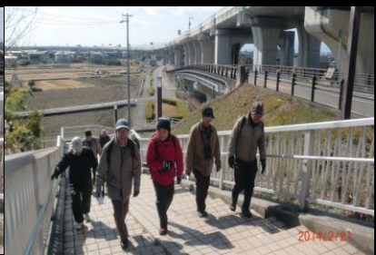
8995 手すりを活用して上るのは誰だ！