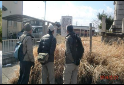
9020 ススキが大きく成長