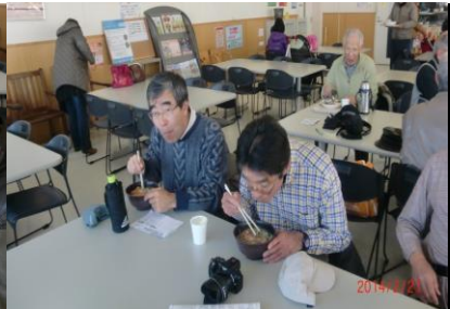
9004 食べている時は大人しくなる！