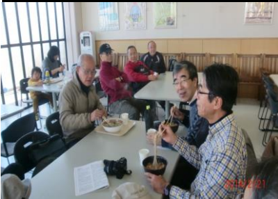
9005 順番に作っていますのでお待ちを！