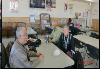
9007 各々方 暫し待たれー！