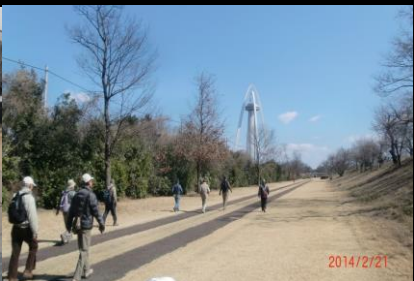
8998 サイクル専用道沿いを進む