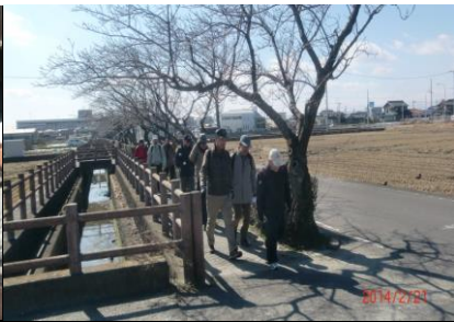
8989 北山川の桜並木を通る