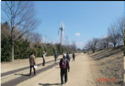
8999 なかなか近づかないなあ！