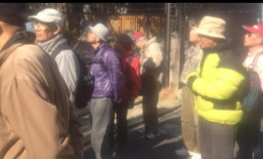
2428 続 薬師堂にて