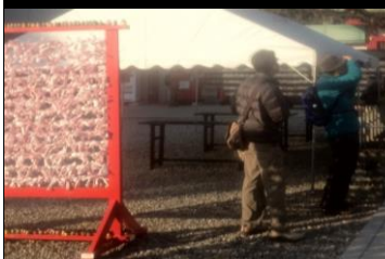
2477 おみくじが大吉か？