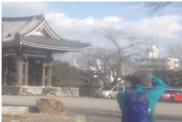
2431 こちらにもカメラ小僧