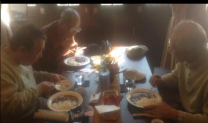
2436 待ちに待ったのカレーをかけ込む