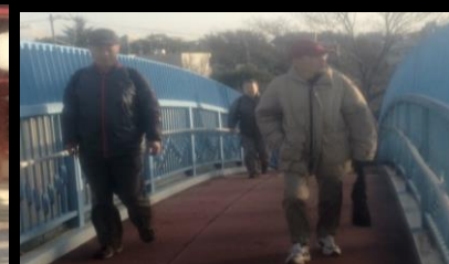
2489 歩道橋を元気に渡る