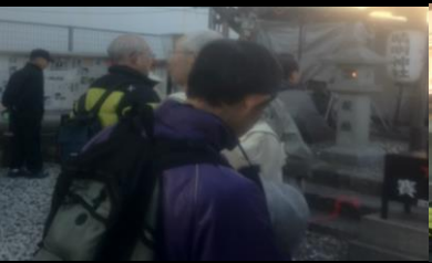
2509 脱帽して恋のお願い？