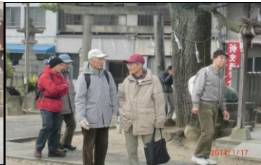
8957 境内で旧交を楽しむ