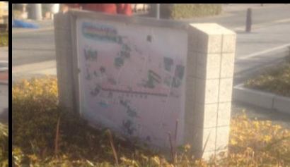
2421 すいどうみち緑道の説明立札