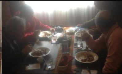
2435 喫茶室にて特製カレーを頂く