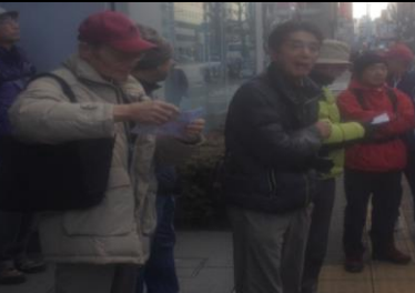
2410 信号待ち(デジカムではなくアイホンで撮影、画質悪い)