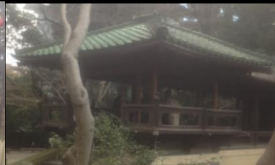
2442 池に浮かぶ浮見堂