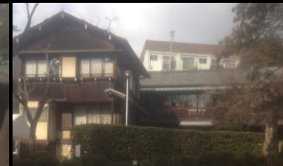
2446 風情を感じる栗廼家