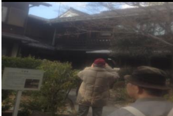
2438 北庭園 伴華楼前にて