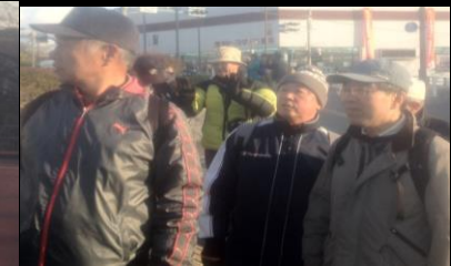
2501 暫し、信号待ちです