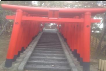
2441 朱色の鳥居(豊彦稲荷)が鮮やか