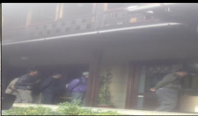
2440 伴華楼はレトロな雰囲気