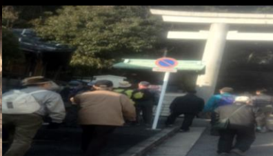
2459 城山八幡宮前にて