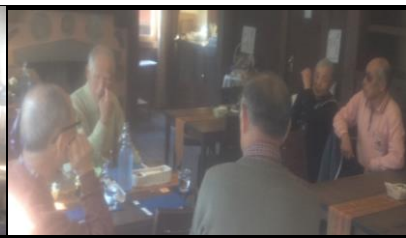
2433 昭和初期にタイムスリップして談笑