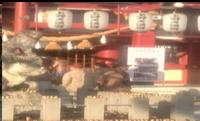
2481 小さなお人形があちこちの置いていた