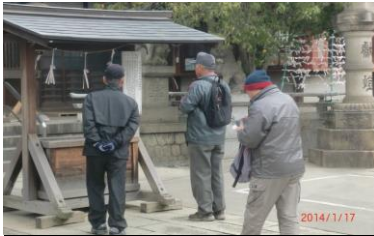
8956 高牟神社を訪れて