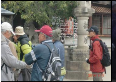
8962 高牟神社で恋のお願い