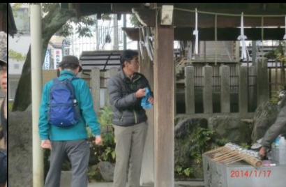
8961 まずは手を清めて！