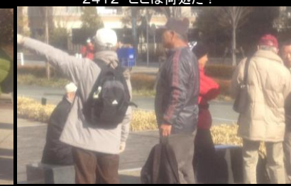
2417 まだまだ元気で、余裕あり