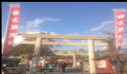
2474 冬の澄み切った青空にたなびく幟