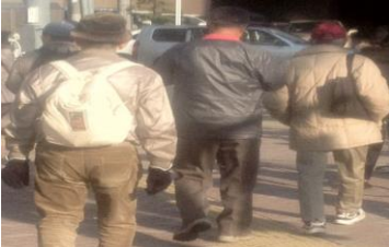
2457 暖かい陽光を背にして