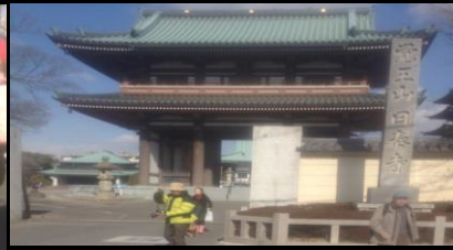
2429 日泰寺山門前にて