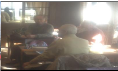
2432 聴松園内の食堂にて