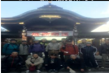
2469 城山八幡宮前で全員撮影