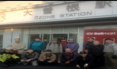
2511 大曽根駅に到着、お疲れ様でした。