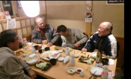
8883 皆さん上機嫌です