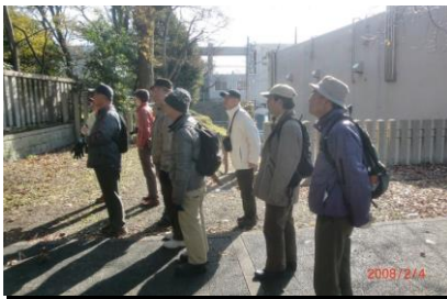
8842 ひっそりした白鳥古墳