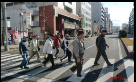
8873 横断歩道をわたりましょう！