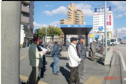
8845 交通ルールを守って