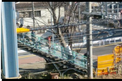
8856 榎田の陸橋を下る