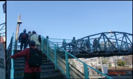
8854 名鉄・JRの線路を越える