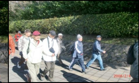
8847 元気よく歩く皆さん