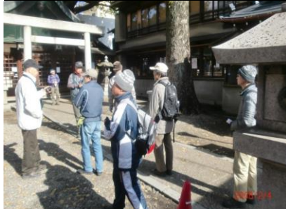
8826 金山駅のすぐそば