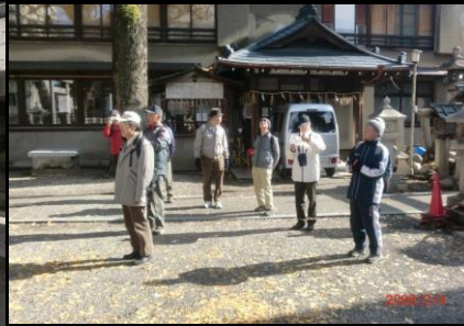
8827 手入れが今一つの金山神社