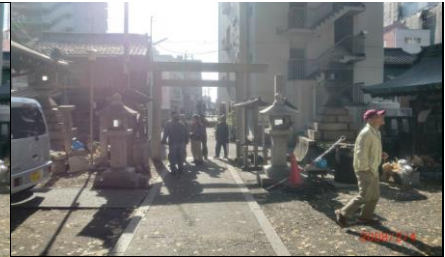
8825 ひっそりとした金山神社