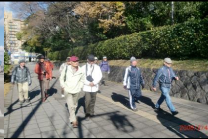
8846 熱田神宮の広い外周道路にて