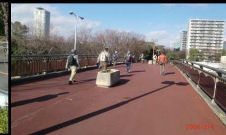
8861 神宮東公園内の陸橋を渡る