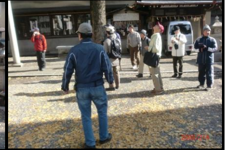
8828 大きな銀杏の木を見て