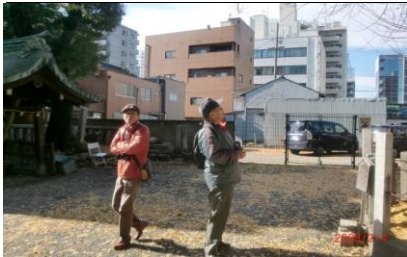
8823 金山神社の銀杏を仰ぎ見て