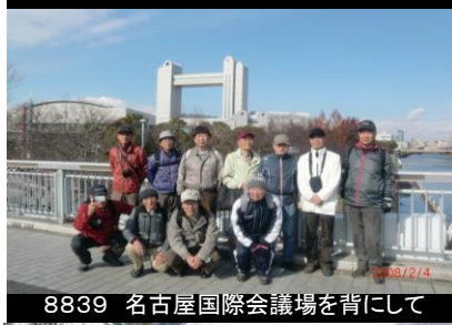
8839 名古屋国際会議場を背にして