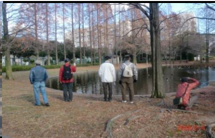
8863 公園内に水鳥がいた