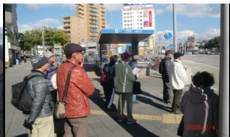
8844 信号待ちで暫し休憩