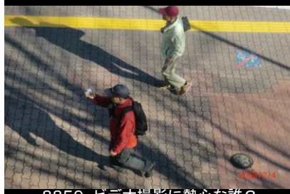
8859 ビデオ撮影に熱心な誰？