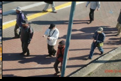
8857 各種キャップの揃い組