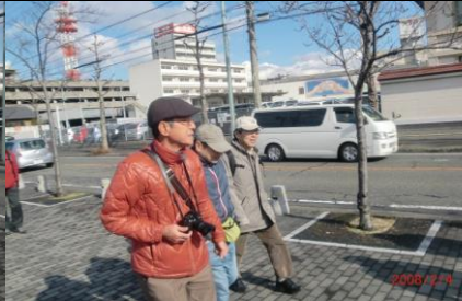
8833 ハンティング帽の似合うのは？