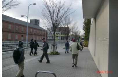
8865 レトロの煉瓦造りの倉庫