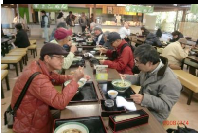
8848 宮きしめんは美味しかった！