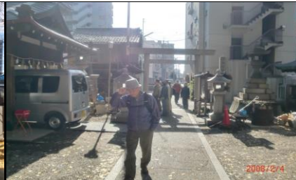
8824 金山神社が金山駅の由来か？