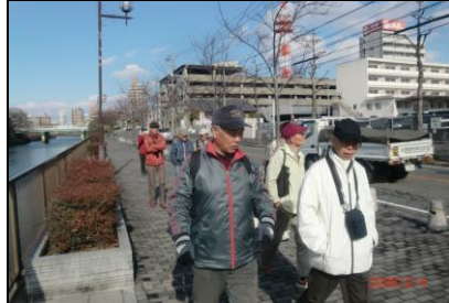
8832 堀川沿いを談笑しながら歩く