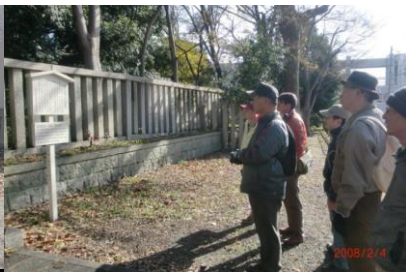
8843 隔世を感じました