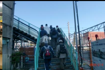
8853 榎田踏切の陸橋を渡る