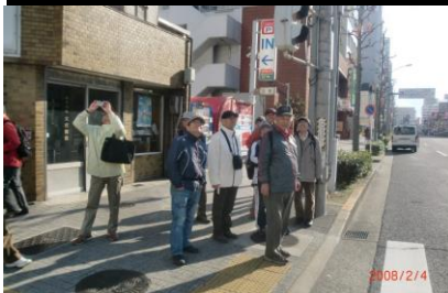
8871 空にいいもの見つけた