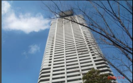
8866 高層マンションにヘリポート？