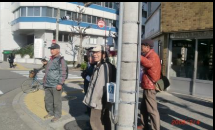
8870 電信柱に寄り添っているのは？