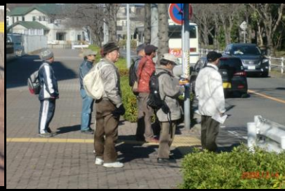
8860 いいよ終盤に差し掛かる