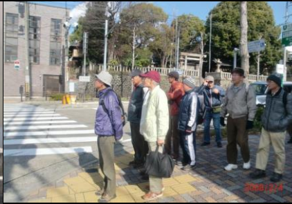
8830 交通ルールを守って信号待ち