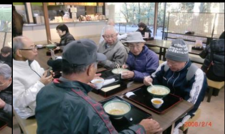
8850 ビールではなくお茶です