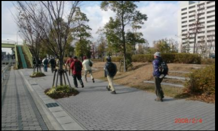
8867 高層マンションに住みたい！