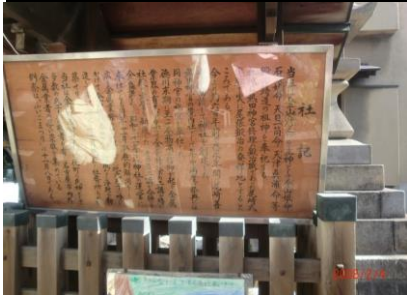
8829 金山神社の由来の説明