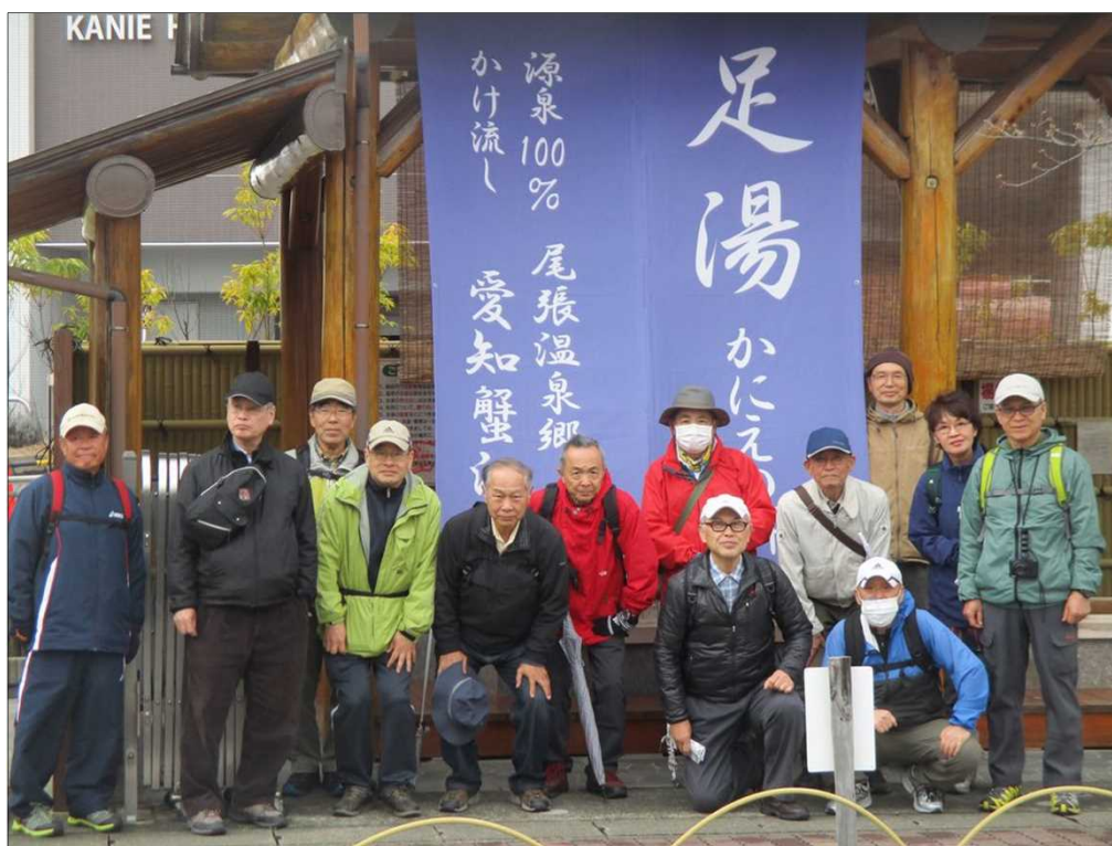
6457 足湯のかにえ温泉にて