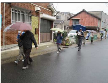
6430 ゆっくりスタート組