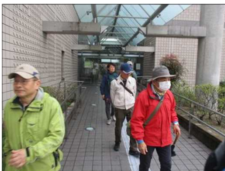
6449 行き届いた蟹江図書館を出て