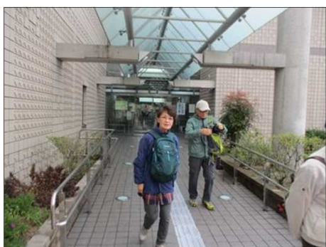
6450 お元気な平野ご夫妻