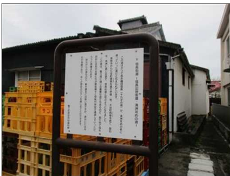
6463 信長街道(清州攻め)