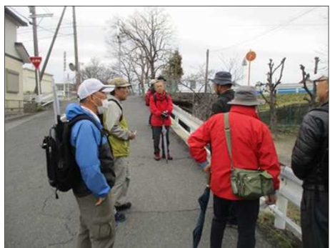
6458 雨が上がり、傘を杖代わりに