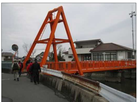
6461 鮮やかなオレンジ色の御蔭橋