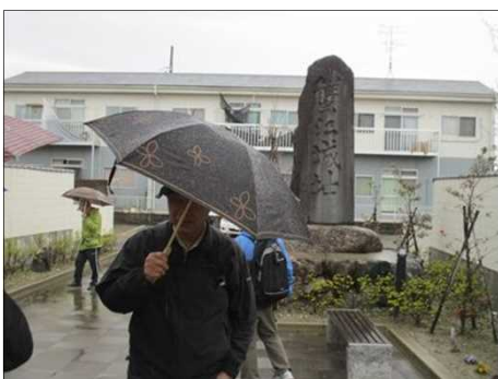
6432 こじんまりした公園