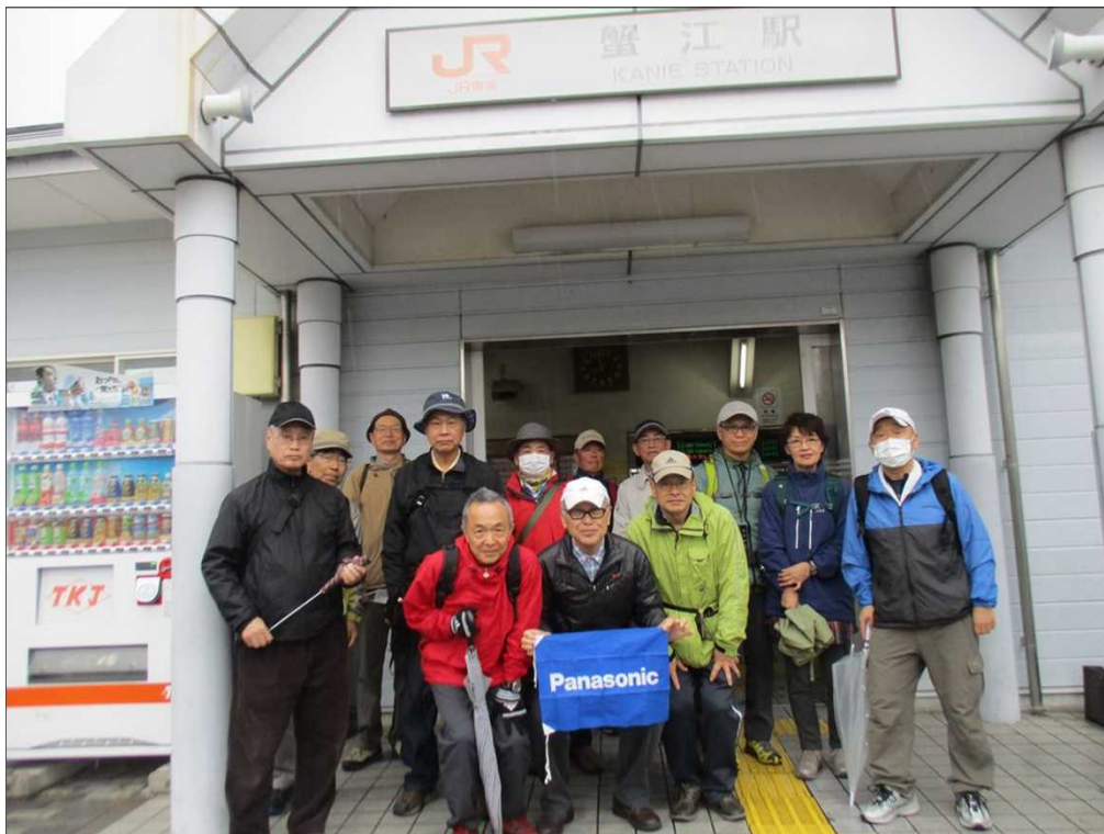
6428 JR蟹江駅を14名で元気にスタート