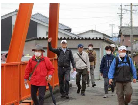
6462 御蔭橋(はね橋)を通過