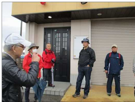
6439 PGUのサービスを説明