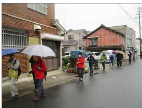
6429 小雨降る中を歩き出す