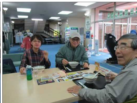
6455 いつもお似合いの平野夫妻