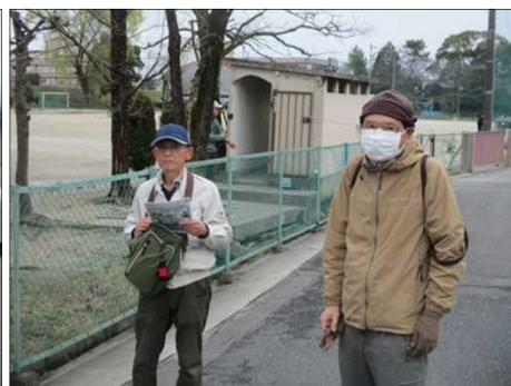
6460 しっかりルート確認