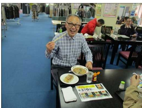
6452 超お値打ちな昼食