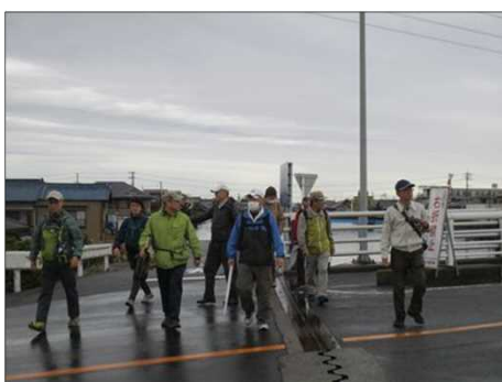
6436 皆で渡れば怖くない？