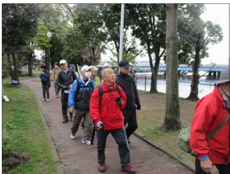
6445 佐屋川 創郷公園を歩く