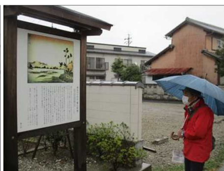
6431 蟹江城址の案内板