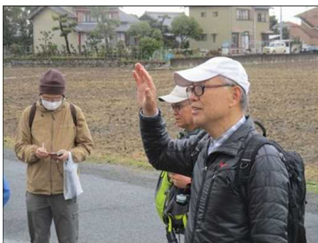
6443 手振り、身振りでご説明