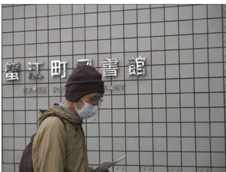
6447 蟹江図書館で暫し休憩