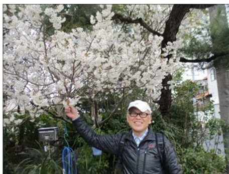
6444 満開のオオカンサクラ？