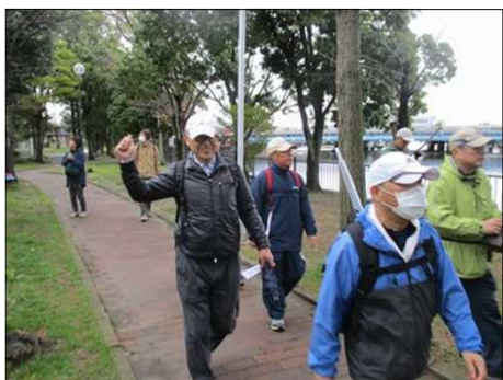
6446 公園内を楽しく歩く