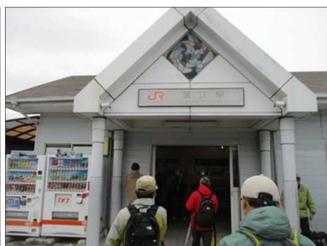
6464 ゴールに蟹江駅に無事到着