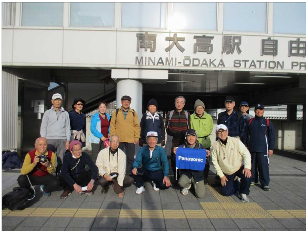
6425 全員無事 南大高駅に到着。お疲れ様でした。