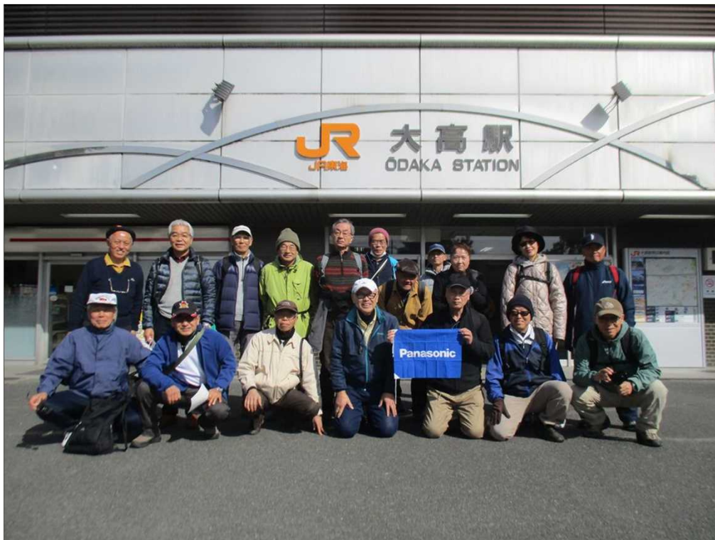
6387 JR 大高駅を19名で天候に恵まれ、元気にスタート！