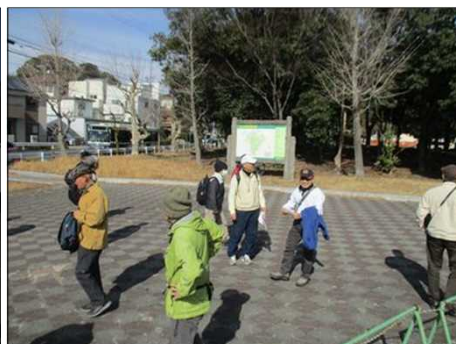
6389 大高緑地公園に到着