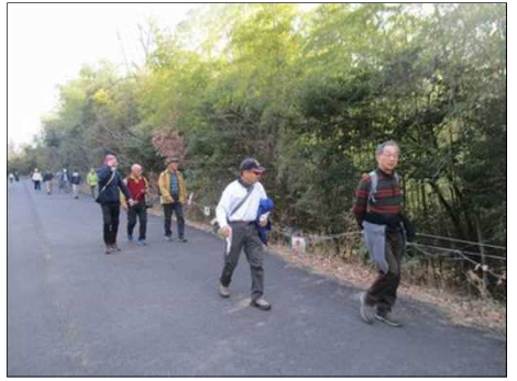
6417 竹林立入禁止の看板あり