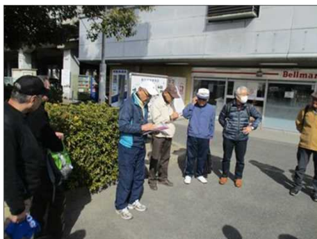
6385 駅前で本日の見所を説明