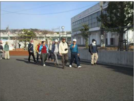
6421 ゴール近くで足取り軽やか