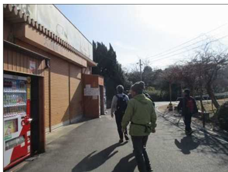
6400 ボート乗り場にて