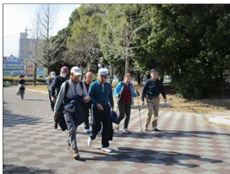
6392 公園内を歩き出す！