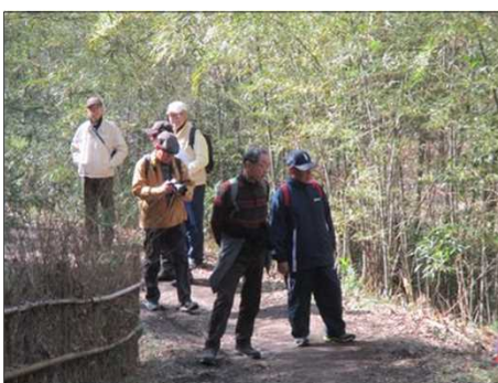
6394 竹の垣根に風情あり