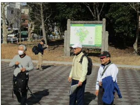
6390 暑くなりそうなので1枚脱ぐ