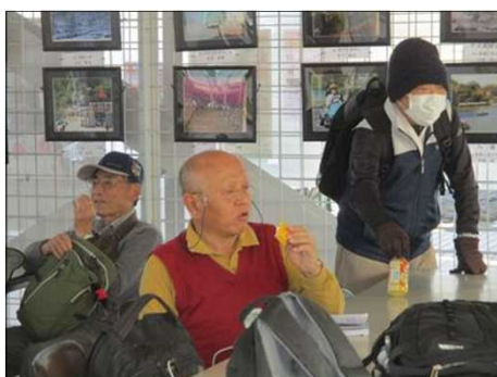
6414 アイスクリームを頬張る