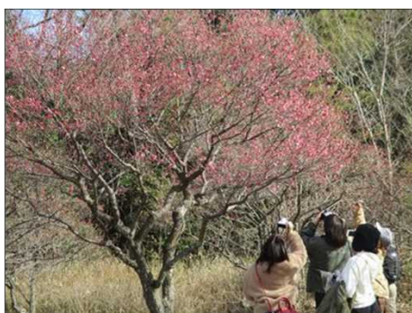
6408 梅の見物客が来園