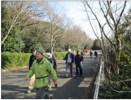
6416 雑談しながら歩く