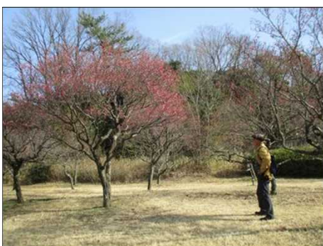
6406 梅のつぼみがピンクに