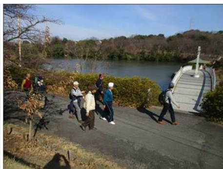
6402 綺麗な橋が架かっていた