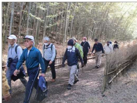
6396 竹林歩きを楽しむ