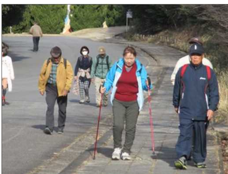
6410 道幅が広く、思い思いに