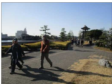
6368 いよいよ熱田神宮へ