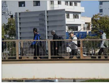
6373 いよいよゴール近し