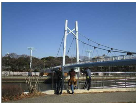
6354 白い大きな吊り橋を観る