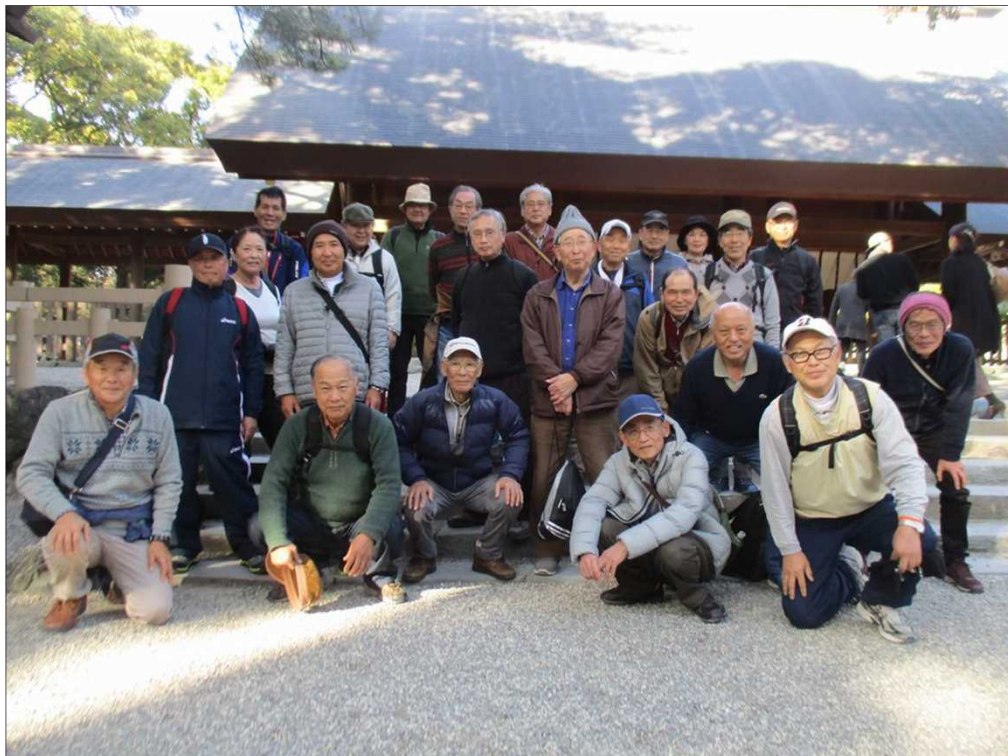
6378 無事、全員 熱田神宮 本宮前に到着