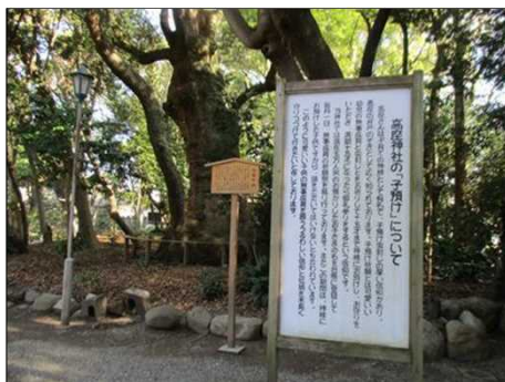
6346 高座神社の「子預け虫封じ」