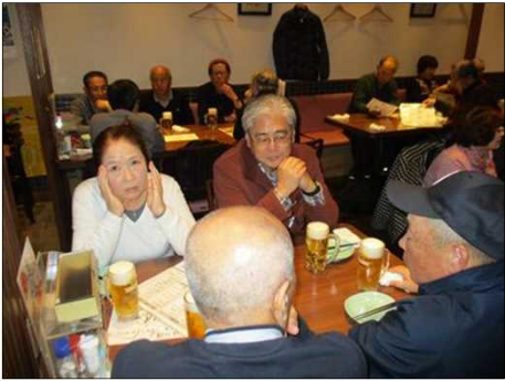
6382 新年会始まり始まり