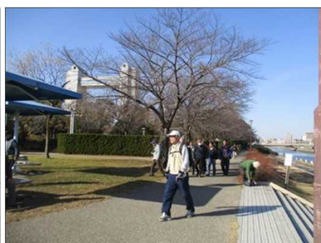
6350 堀川沿いの散策路を進む