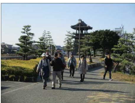
6369 トイレ休憩も済みました