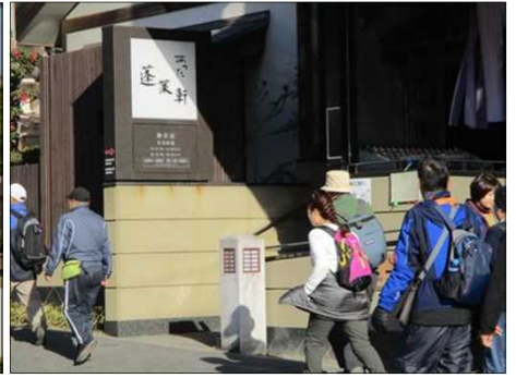
6374 「あつた蓬萊軒」前通過