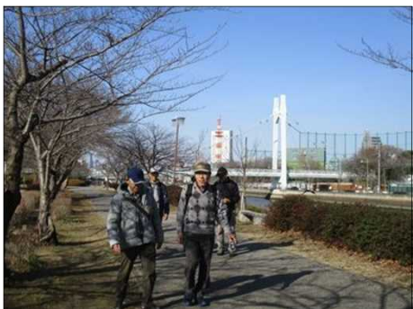
6359 皆さんが声掛けながら行く