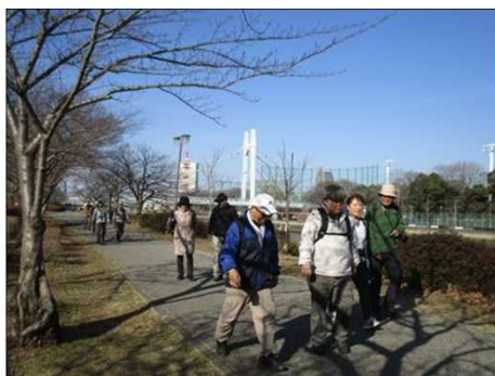
6358 談笑しながら歩く