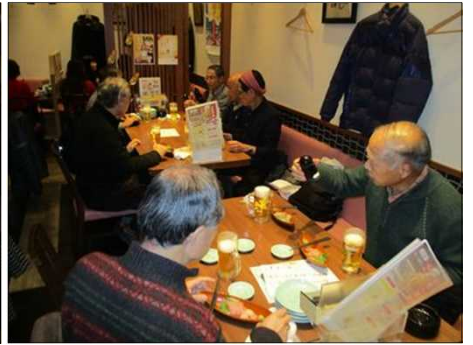
6384 何を注文しようかな？