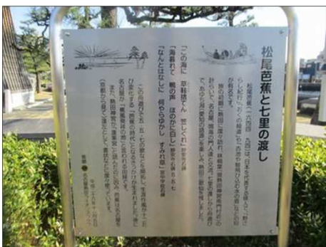
6366 松尾芭蕉と七里の渡し