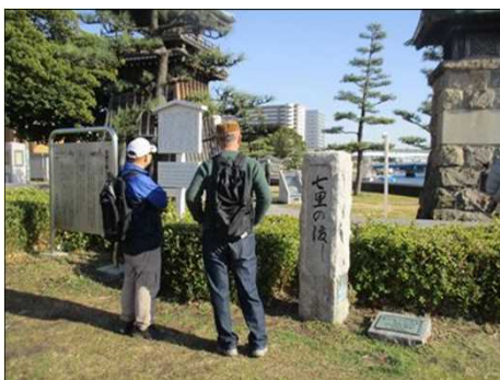
6367 思い思いに過ごして楽しむ