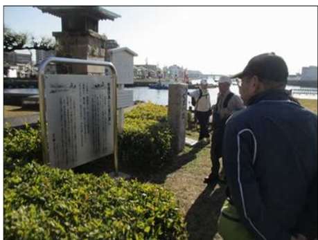
6363 宮の渡しの由来を知る