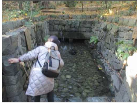
6379 墓石に尺で3回水かけする