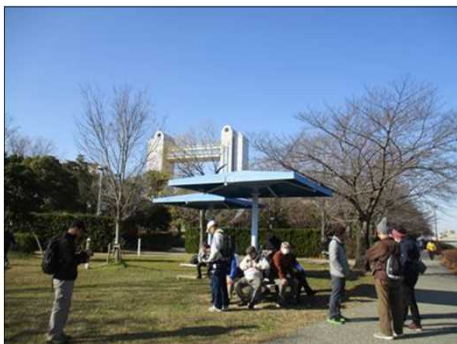
6352 暫しベンチで小休止