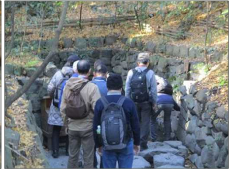
6380 楊貴妃の墓石を覗き込む