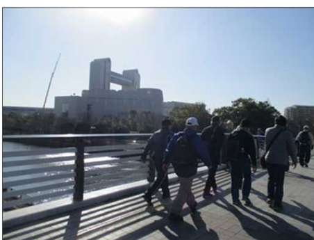
6348 透き通った空気の中、歩く