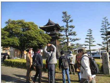
6362 暫し、古に想いを馳せる