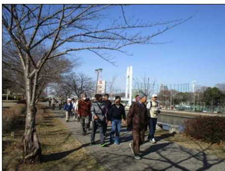
6357 中位グループが楽しむ