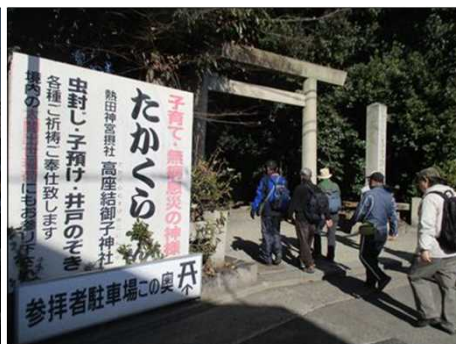
6341 高座結御子神社に到着