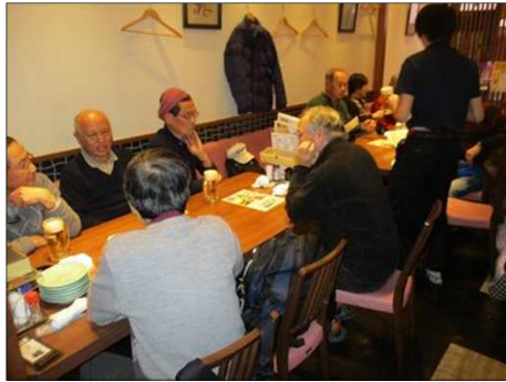
6383 やっと一息つける！