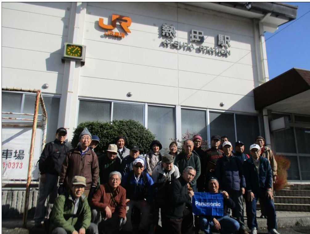
6337 JR熱田駅を冬晴れの中23名でスタート