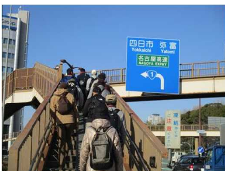
6371 国道1号線に架かる大きな陸橋