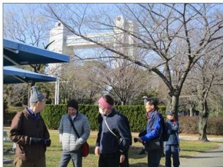
6351 トイレ休憩で歓談