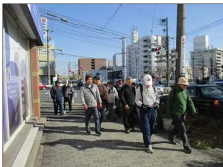
6338 大所帯が元気よく出発