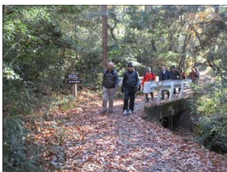
6219 アプローチの山道を往く