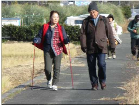
6227 仲良く、楽しく歩く♡