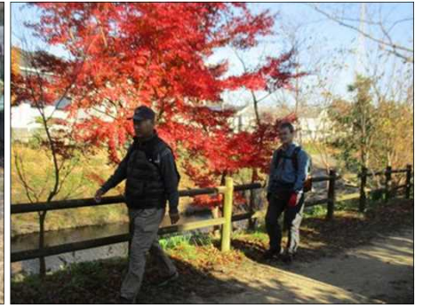
6229 朝倉川沿いのもみじ