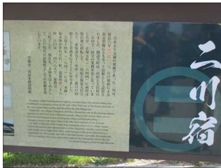
6192 二川宿の説明看板