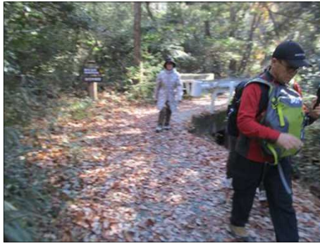
6221 マイペースがいい