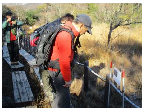
6211 ロープで立ち入り禁止に