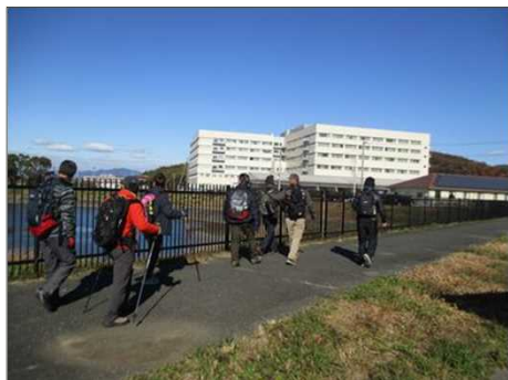
6203 巨大な豊橋医療センターを見て