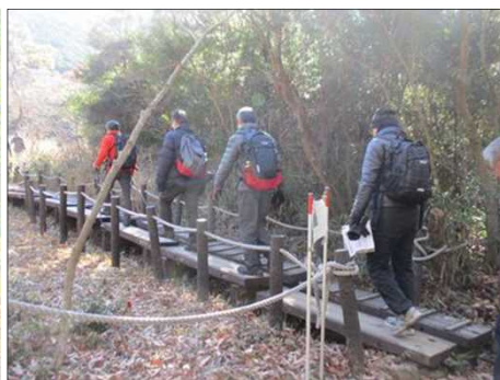
6208 いよいよ葦毛湿原だ！