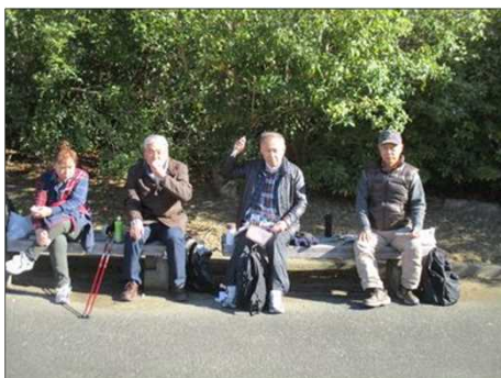
6200 談笑しながらのお昼