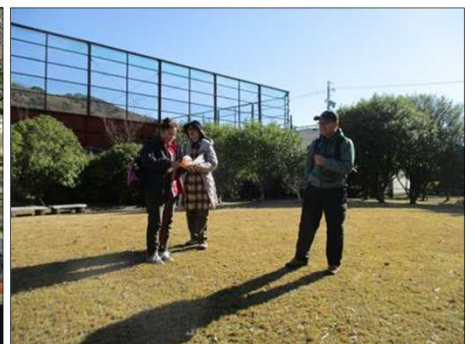
6202 腹ごしらえは終わった