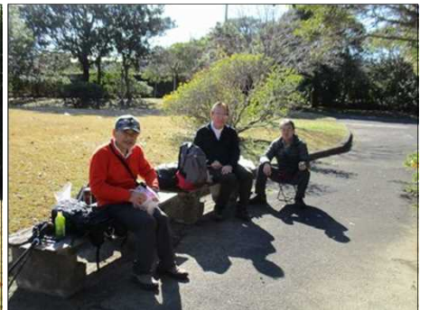
6199 暖かい日差しを受けて