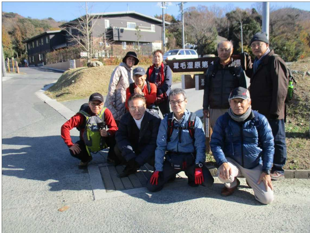
6225 晴天に恵まれ、冬の葦毛湿原を楽しみました。