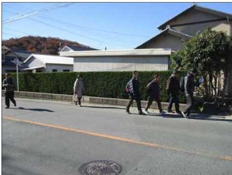
6195 綺麗な垣根を横目に