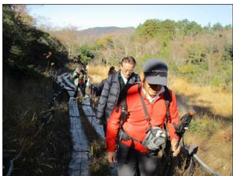
6212 しっかり足元を見て