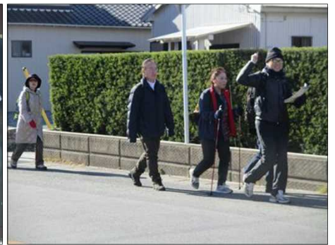
6194 元気よく歩き出す