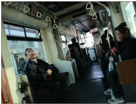
6234 久しぶりの路面電車を楽しむ