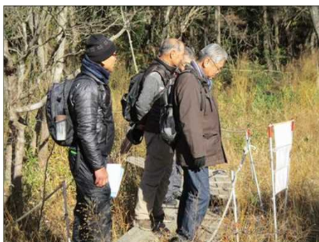
6214 立ち止まって湿原を見渡す