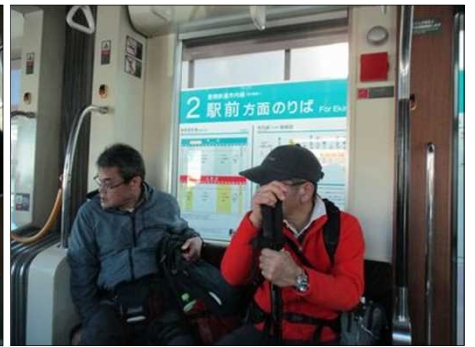
6235 路面電車談義に花が咲く