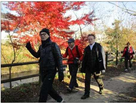
6231 いよいよゴールだ！