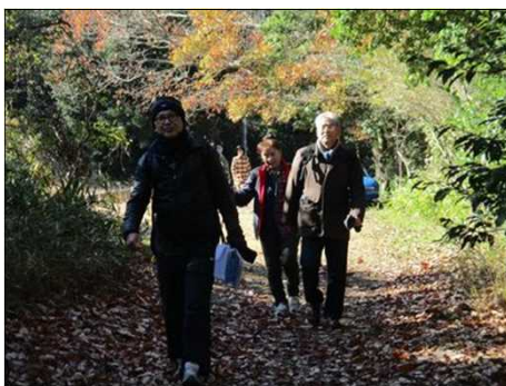
6207 枯葉を踏みしめて