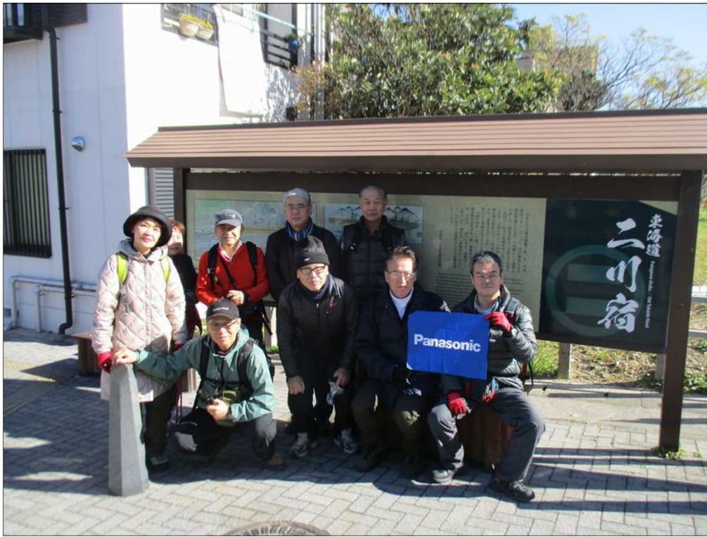
6188 澄み切った冬空の下、元気に二川駅を出発