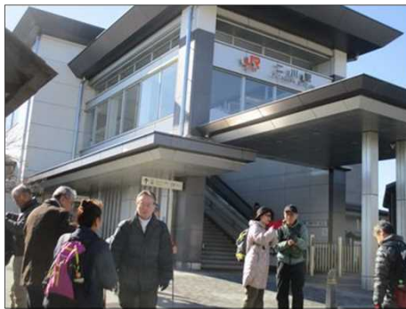
6190 新しくなったJR二川駅