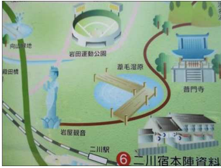
6223 近くの観光名所の紹介