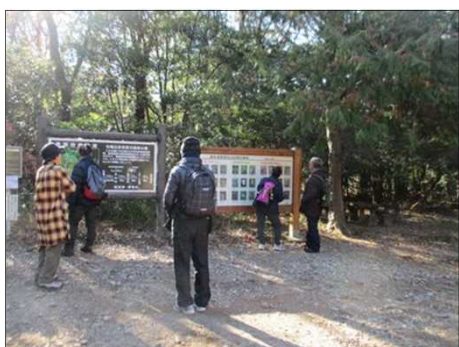
6216 湿原に生息する四季の鳥等