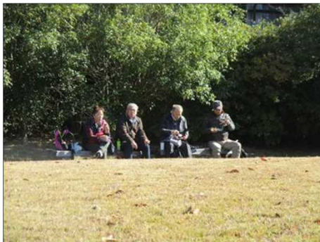
6198 待ちに待った昼が来た！