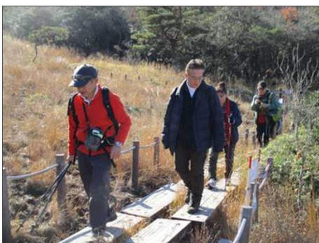
6213 木漏れ日の中を歩く