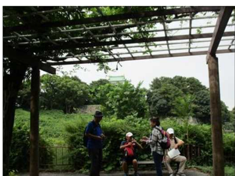
5556 藤棚回廊の下で休憩