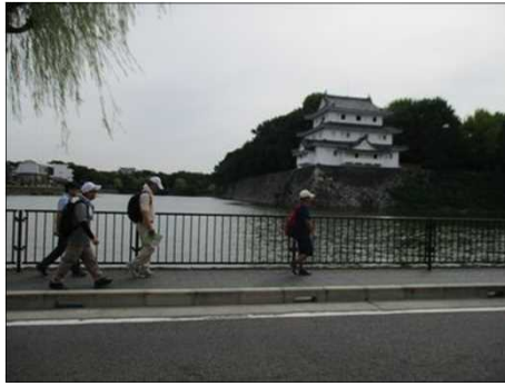
5560 お堀を見ながら歩く