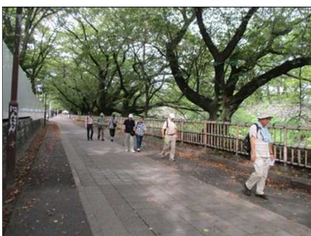
5550 桜の巨木を横目に見て