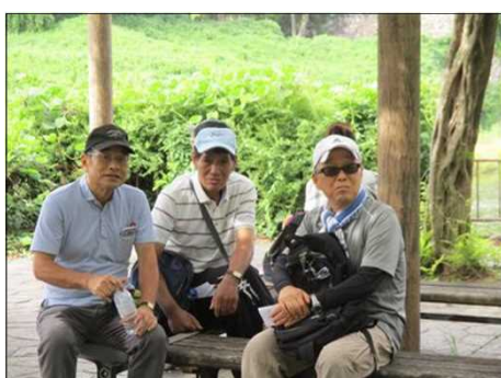
5558 ひと時の休憩で談笑する