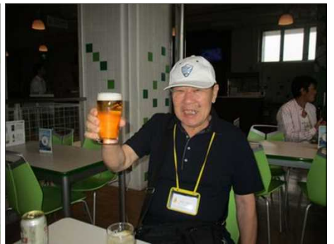
5572 4杯目の山盛ビール