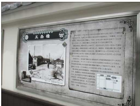
5544 五条橋の謂れを知る！