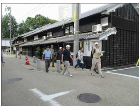
5541 昔の旅人に想いを寄せて