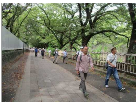
5551 桜の季節にきたい！