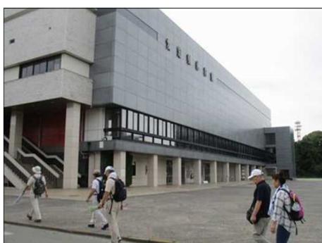
5555 愛知県体育館前を進む