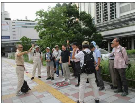
5532 いつもの出発前説明