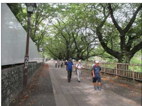
5549 名古屋城内を散策