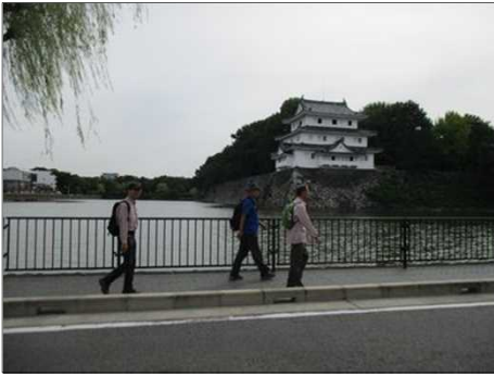
5559 名古屋城を見て進む