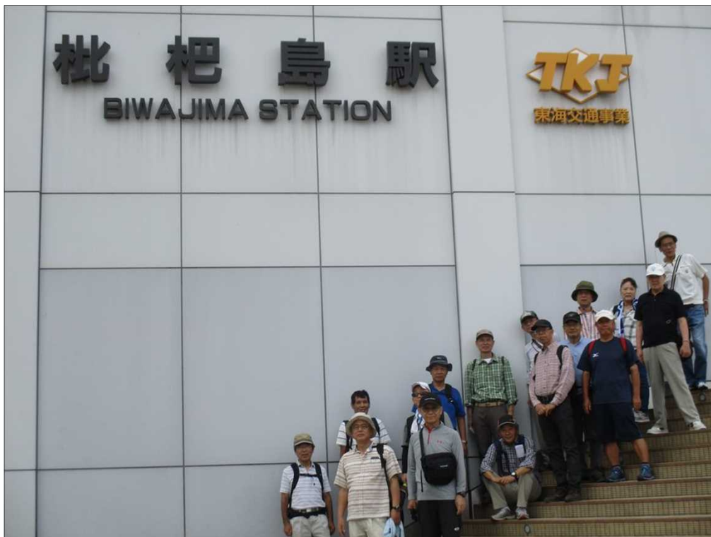
5566 無事、元気にゴールの枇杷島駅に到着!