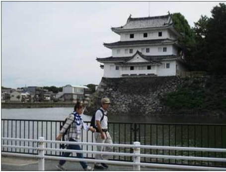
5562 談笑しながら歩く