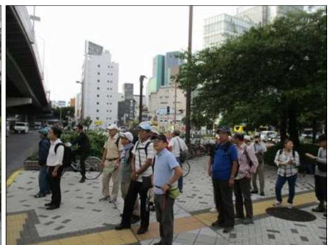
5536 交通ルールを守って