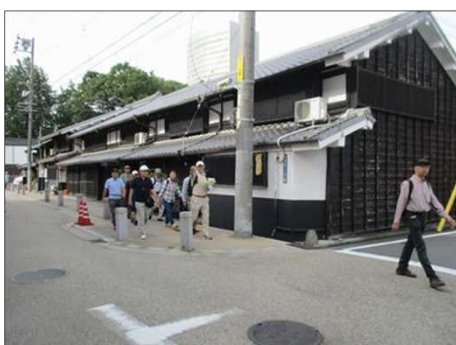
5540 風情が残る町並み