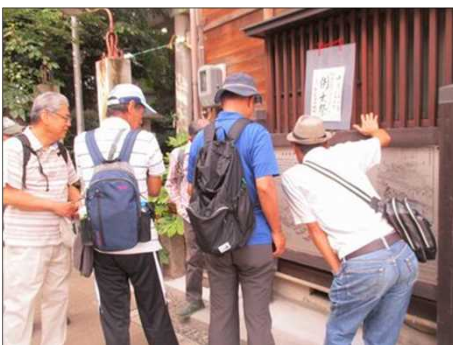
5538 四間道の今昔の説明