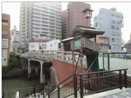
5545 橋から突きだした祠