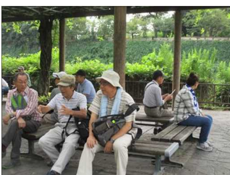
5557 金シャチを見て一休み