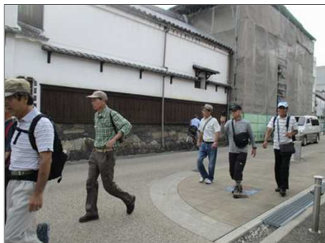
5543 昔にタイムスリップ