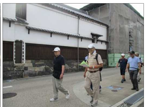
5542 倉庫をリフォームしてたレストラン