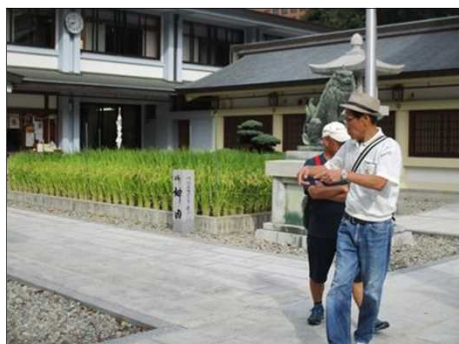
5546 護国神社で稲穂が垂れる