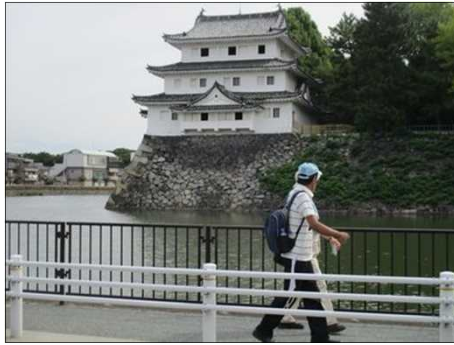
5563 どんどん景色が変わる