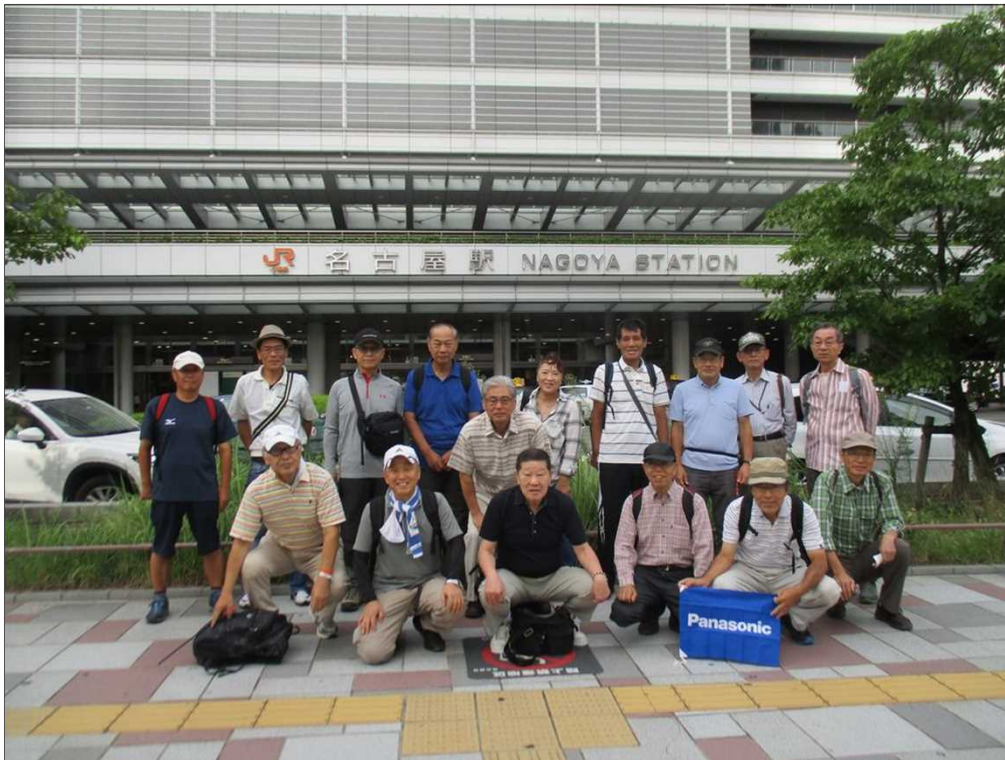
5529 JR名古屋駅を17名で元気にスタート