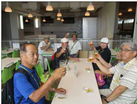
5571 今日ビールが飲める!