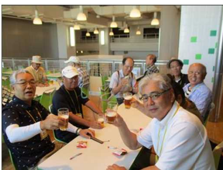
5495 ビールグラスを高々と！