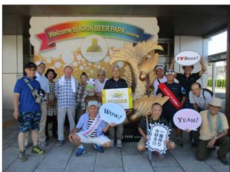
5494 思い思いに記念撮影