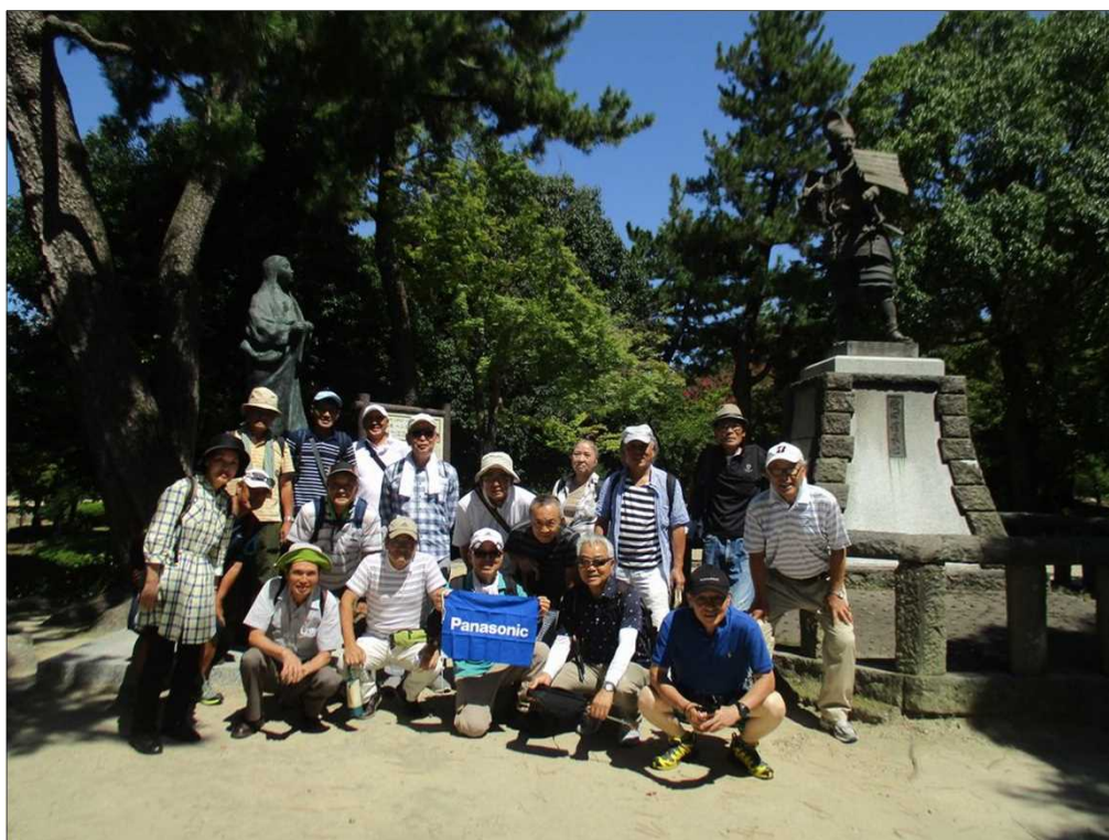
5472 清州公園(「信長公・濃姫」像)に無事、全員到着！