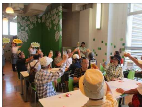
5497 皆で元気よく乾杯！