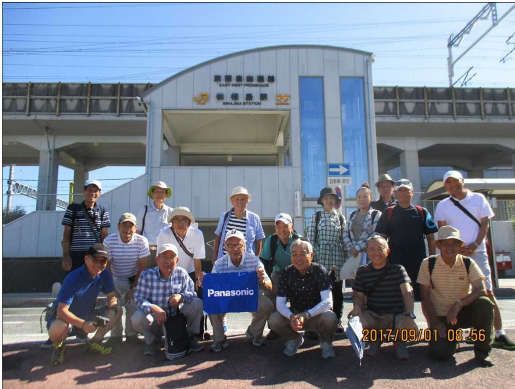
5431 晴天の下、JR枇杷島駅を18名で元気にスタート