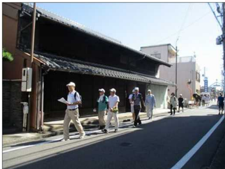
5439 古の町並で街道を支える