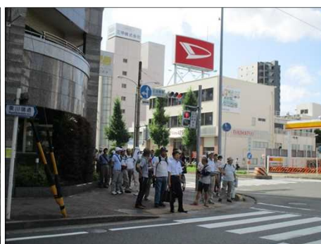
5353 交通ルールを守って！