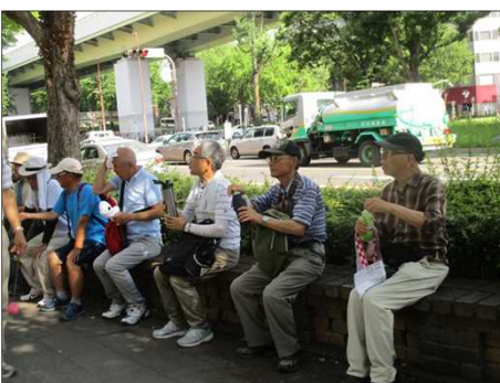
5355 大通公園前で休憩