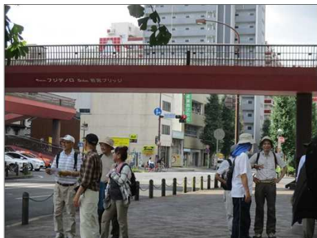
5361 信号待ちで暫し雑談