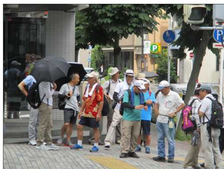
5365 日差しが徐々に厳しく