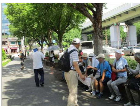
5356 ベンチに腰掛けして