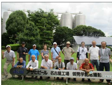
5376 アサヒビールにて