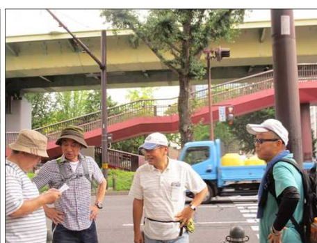
5359 コース確認要チェック！