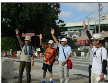
5350 アサヒビール工場見学参加組