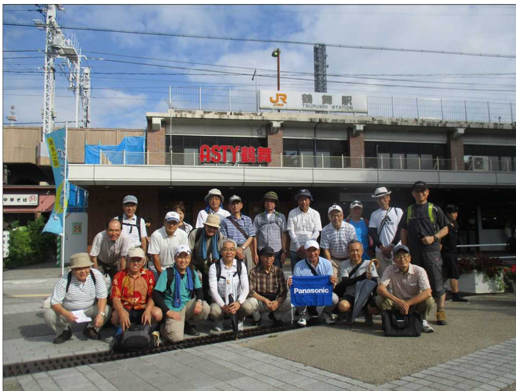
5352 鶴舞駅を22名でスタート