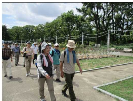
5369 鶴舞公園のバラ園前