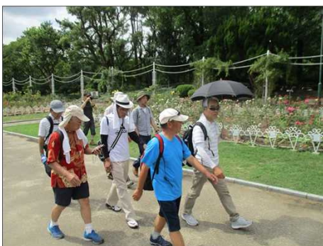
5374 いざアサヒビールへ