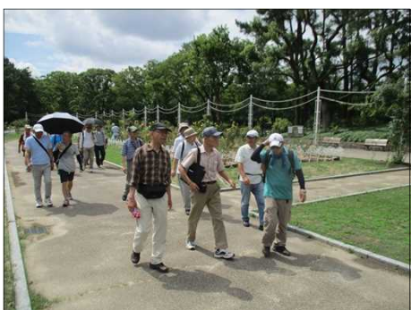
5370 皆さんまだまだ元気！