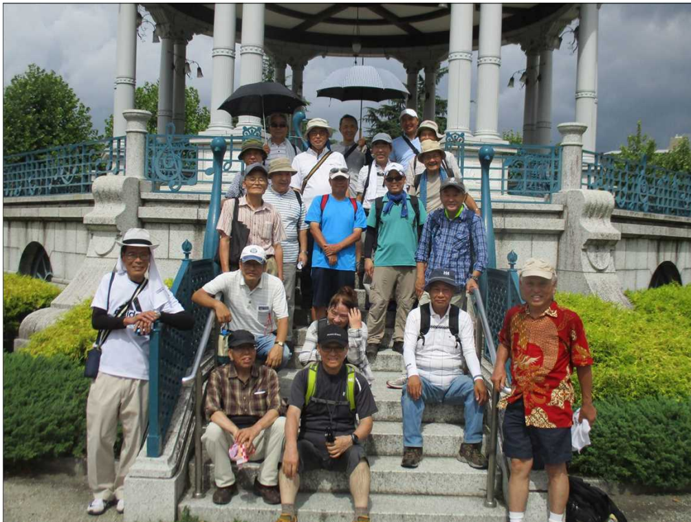
5367 鶴舞公園に無事、全員ゴール！！