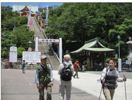
5228 成田山の長い階段