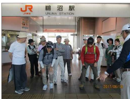
5164 出発時の記念撮影前風景