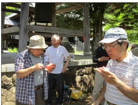
5211 夏はやっぱりスイカ！