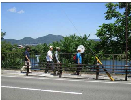
5172 木曾川沿いを歩く