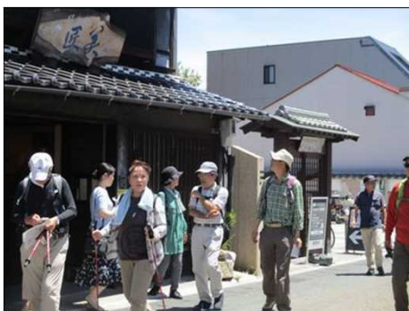
5233 犬山城下町にて散策