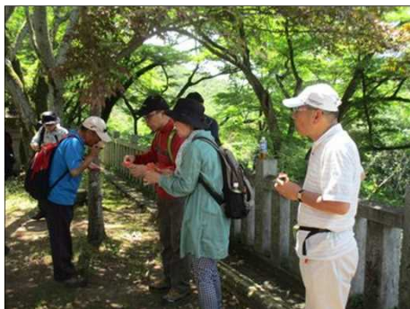
5209 木陰でスイカを頬張る