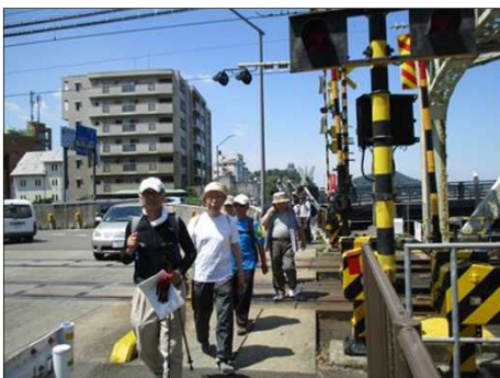
5170 名鉄の踏切を渡る