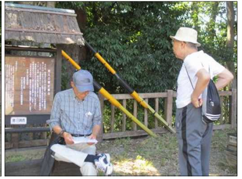
5241 犬山城の入口にて