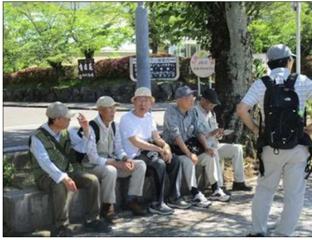
5248 木曾川の堤で休憩