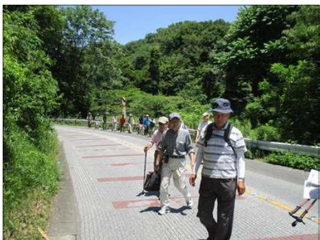
5216 一列になって歩く