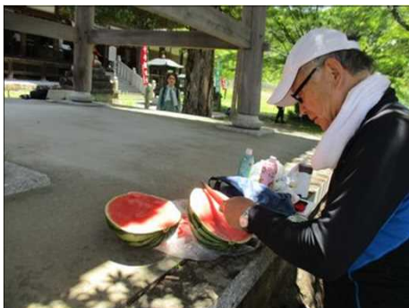
5206 冷たい大玉スイカを割る