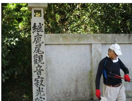
5186 継鹿尾観音寂光院入口