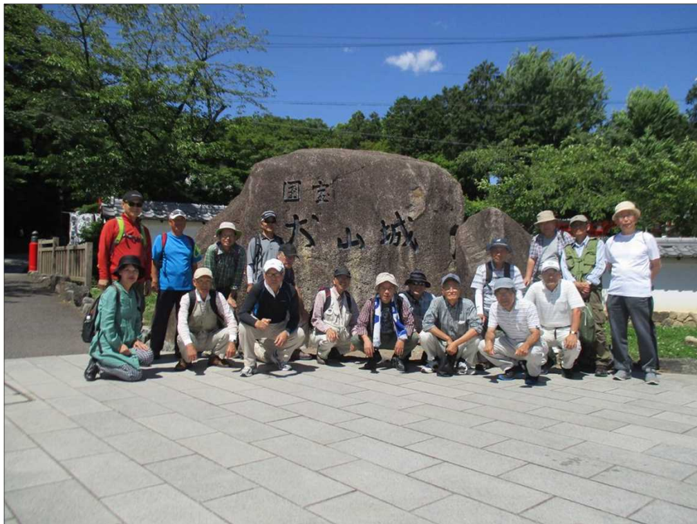
5239 犬山城に無事 全員 元気に到着