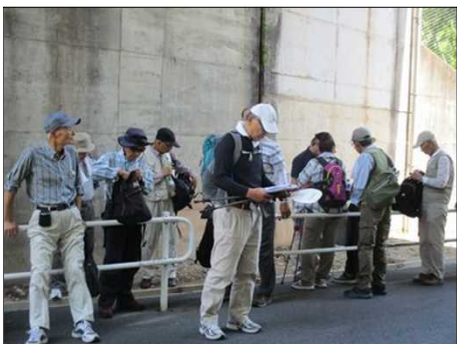
5217 橋の下で木陰休憩