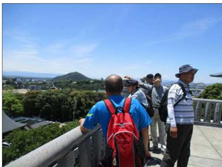
5221 成田山の舞台から眼下を見る