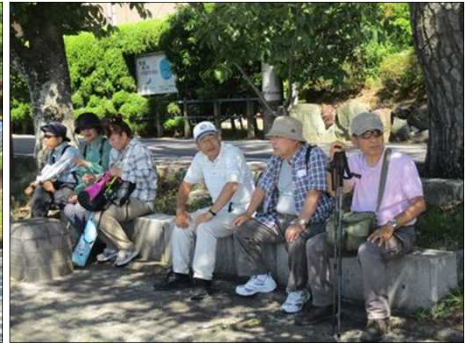
5249 もうすぐゴールで安堵感