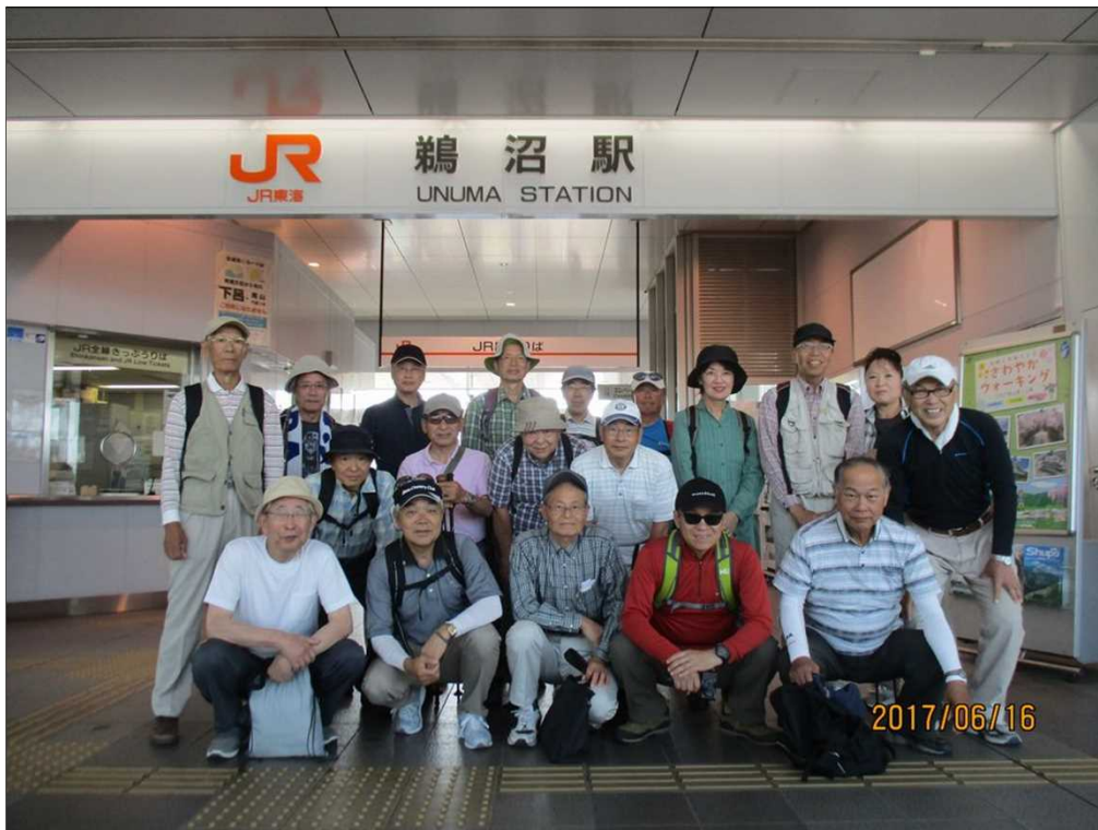
5166 JR 高山本線 鵜沼駅を20名(参加者21名)で元気にスタート