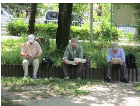
5080 さあて、これからは？