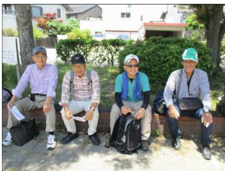
5086 木陰でしっかり休憩