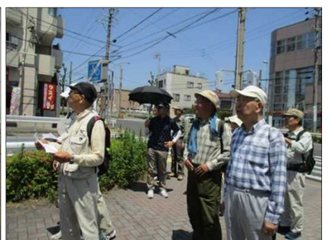
5067 暑さで日笠の人も