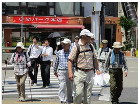
5069 廻りを見て歩を進める