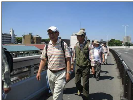
5058 晴天の下、元気に歩き出す