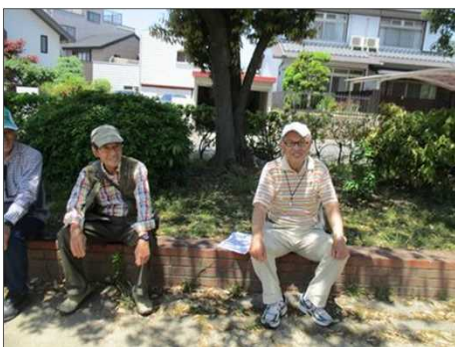
5085 いざ、相生山に向けて休憩