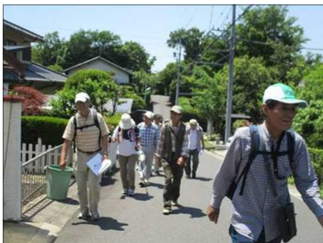
5094 いよいよ登りにかかる