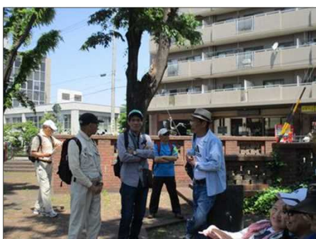
5065 立ち話もまた楽し