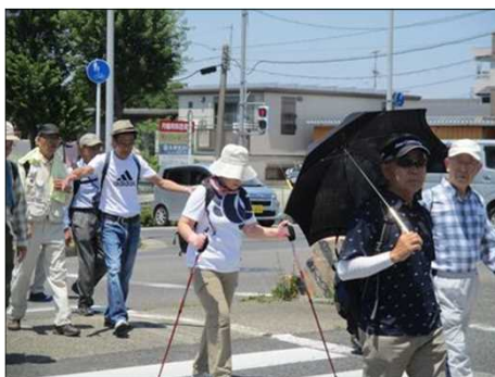
5083 暑い日差しを避けて