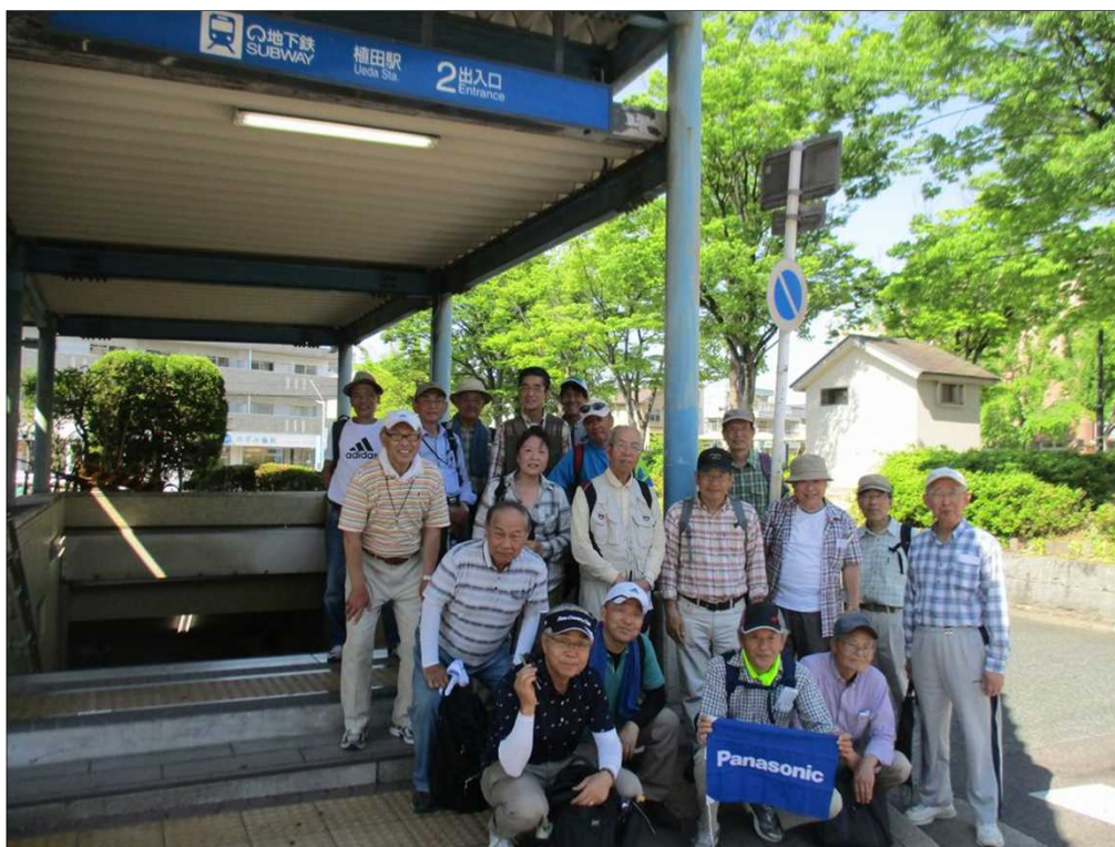
5133 全員無事、地下鉄 鶴舞線 植田駅に到着！