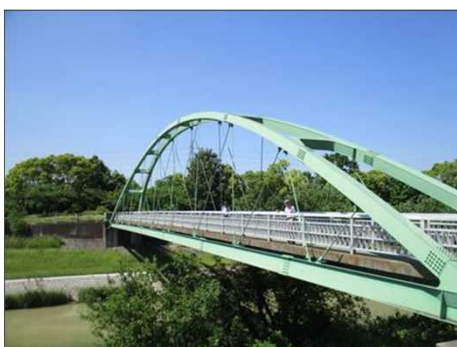
5130 天白川に架かる歩道橋