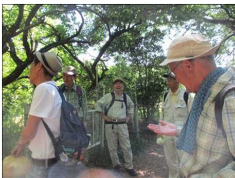
5120 昼食して少し元気に！