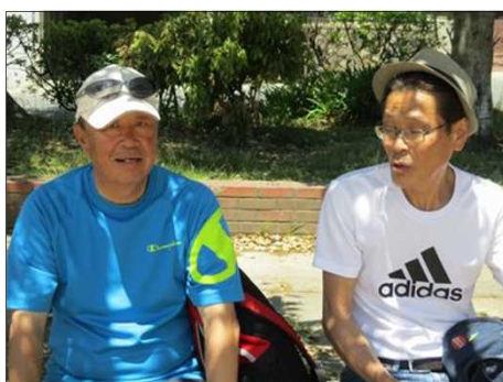
5087 暫し、会話を楽しむ