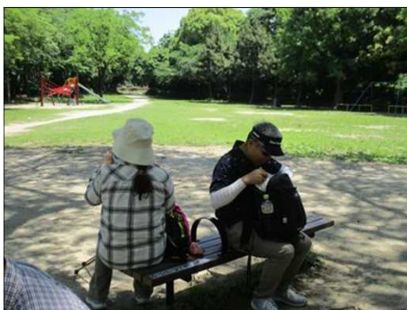
5075 ベンチで仲良く休憩