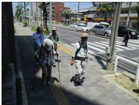
5072 グリーンロードを歩く