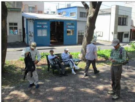
5063 ベンチが少なく立って休む