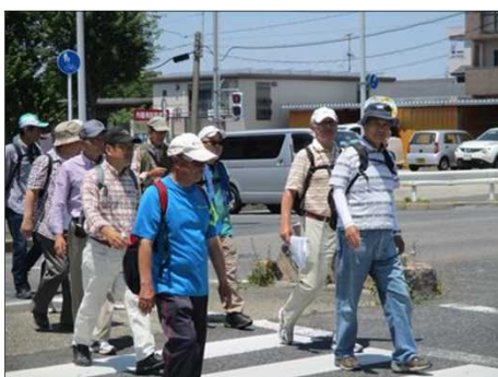
5082 また元気よく歩き出す