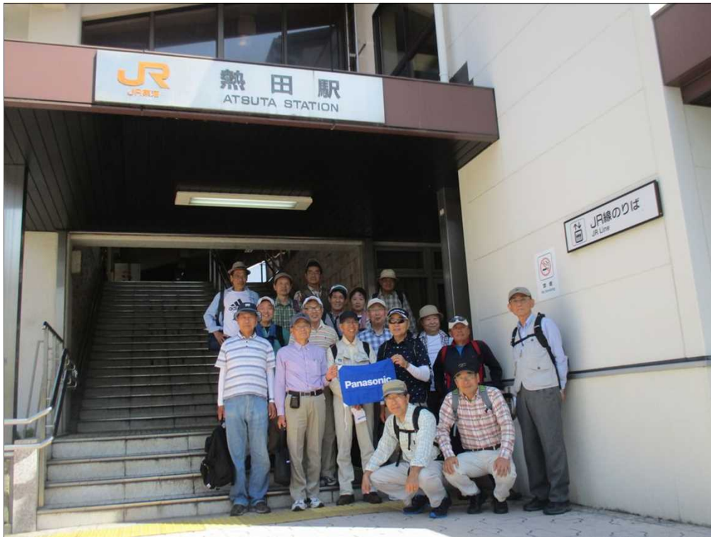
5057 JR東海道本線 熱田駅を19名で元気にスタート