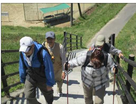
4989 ストックを突いて上る