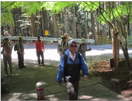
5004 いよいよ最後の上りへ