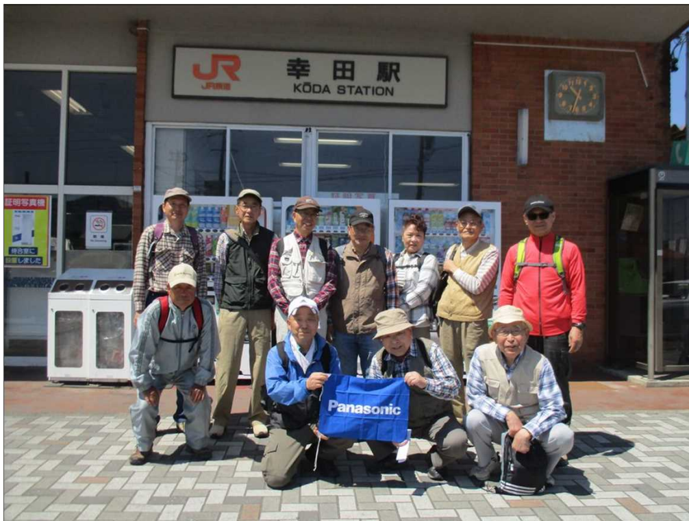
4978 JR東海道本線 幸田駅を12名で元気にスタート