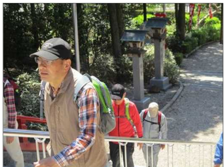
5011 「貴嶺宮」の階段を上る