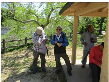
5021 葉ザクラのシダレが風で