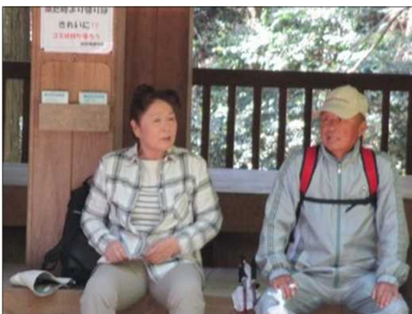
5008 二人のツーショット♥