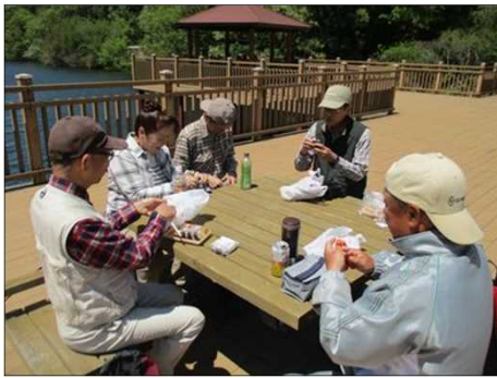
4996 青空の下、手弁当を頂く