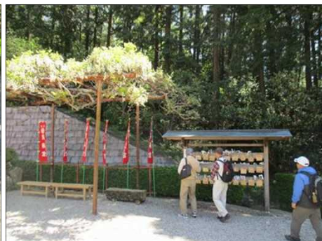
5015 綺麗に砂利が敷かれた