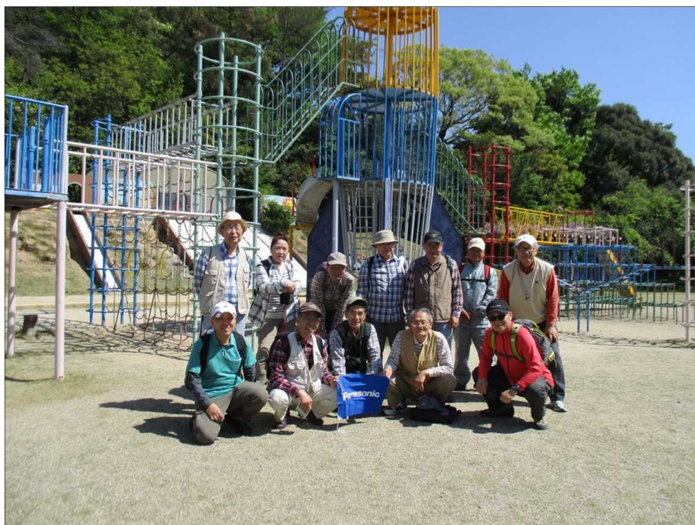
5028 「幸田文化公園」のジャンглの前にて