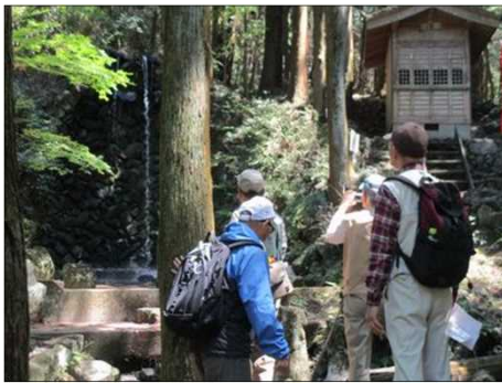
5006 一筋の滝が不動ヶ滝