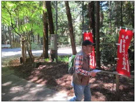
5003 不動ヶ滝に向かう