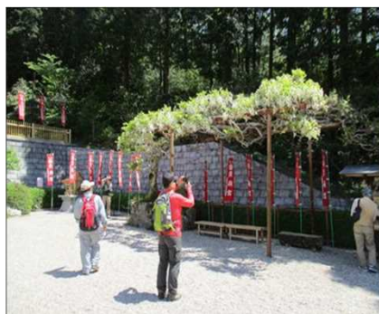
5016 藤の花が季節を醸し出す