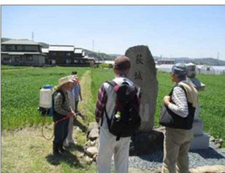
4984 萩城の謂れを地元の人に聴く