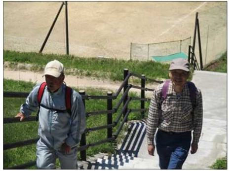
4995 最後尾が登ってくる