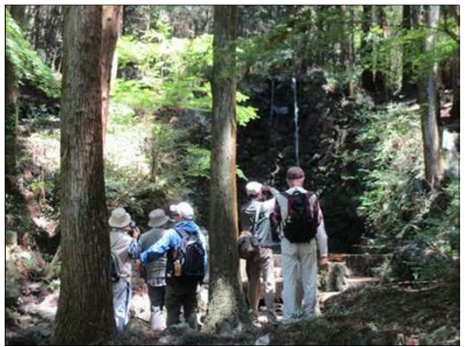
5007 皆さん少しがっかり！