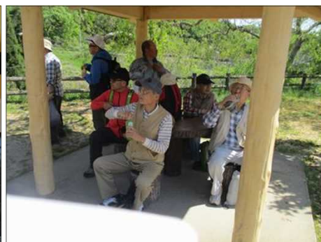
5019 「幸田文化公園」にて休憩