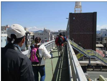
4845 一列になってウォーク