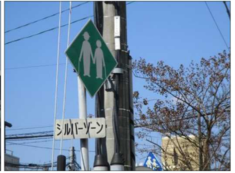
4880 赤・ピンク・白色の梅が綺麗 4890 大きな歩道橋を往く 4893 我々のシルバーゾーン？