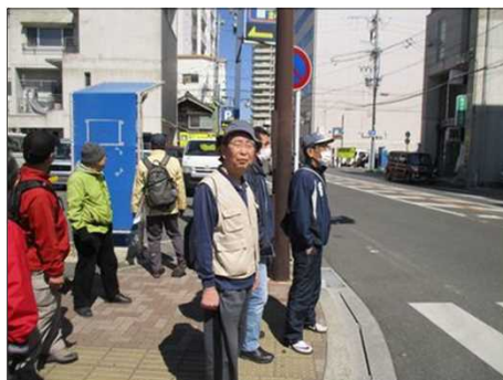
4842 交通ルールを守って