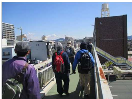
4844 元気よく歩道橋を渡る