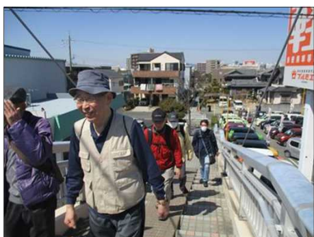
4868 陸橋を元気に渡る！