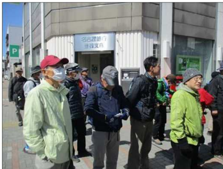
4838 街中で信号待ち多い