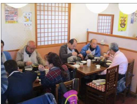
4870 19人とも「豊橋カレーうどん」