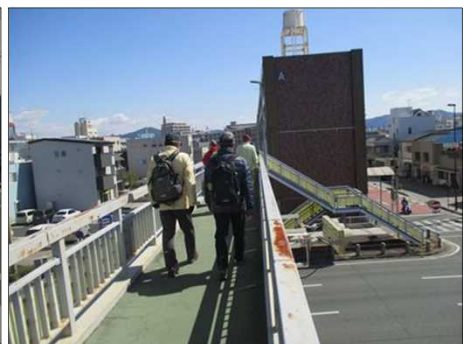
4843 快晴で遠くまで見える