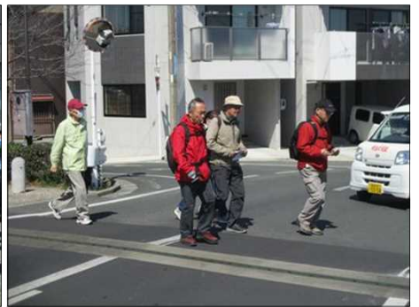
4857 楽しく・明るく進む