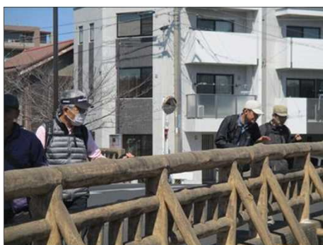
4861 川には何かいるのかな？