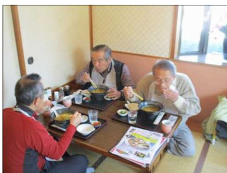
4872 エプロンがお似合い