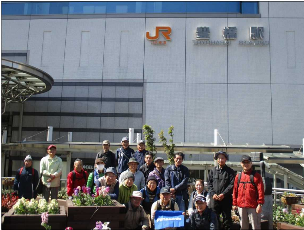
4834 JR 豊橋駅を21名で元気にスタート