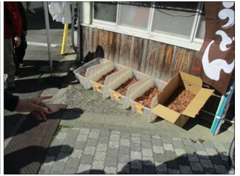
4896 安久美神戸神明社の赤鬼 4900 映画のロケ地の豊橋公会堂 4904 うどん店店頭の出汁用かつお