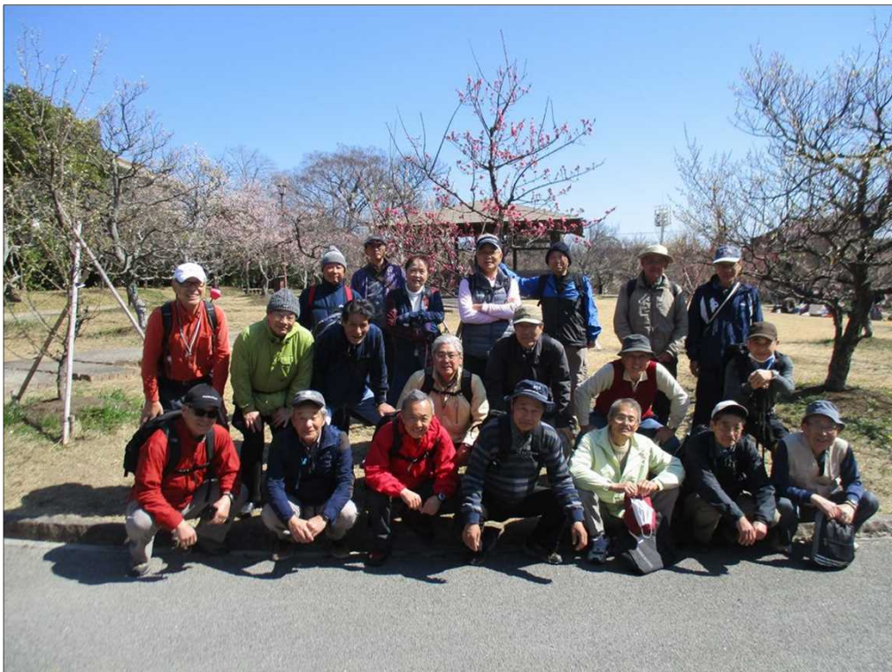
3884 向山緑地梅林園にて、皆さん笑顔がいい！