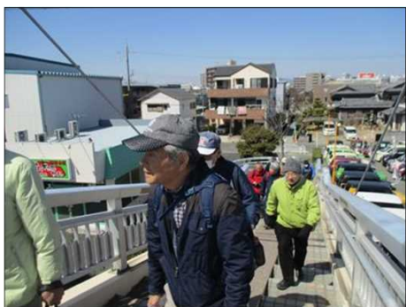
4862 和気藹々とウォーク