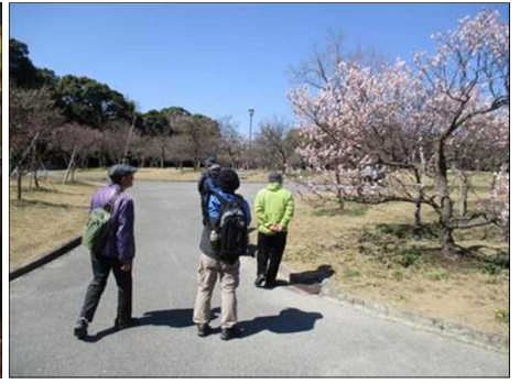
4873 名物「豊橋カレーうどん」を食す 4875 エプロンつけてカレーうどん 4878 青空の元、400本の梅林