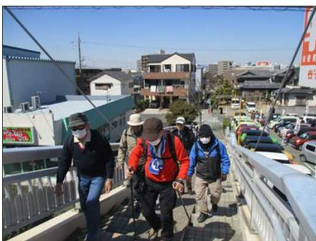
4865 皆さん花粉症対策マスク