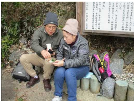
4190 並んでお昼を頂く♡