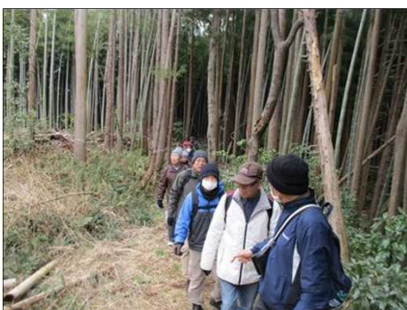
4178 竹のきしむ音を聴きながら