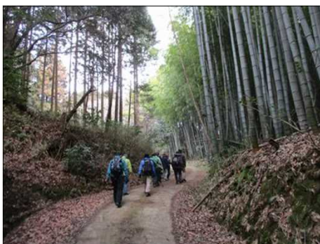
4206 鬱蒼と茂った竹林を歩く