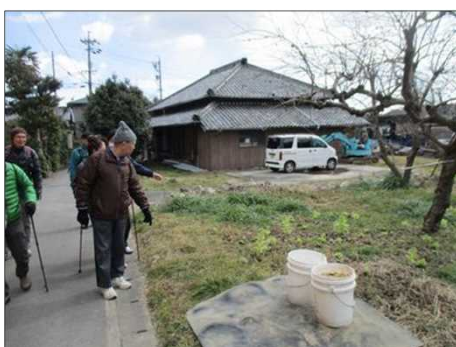
4182 大きくなった蔭の臺