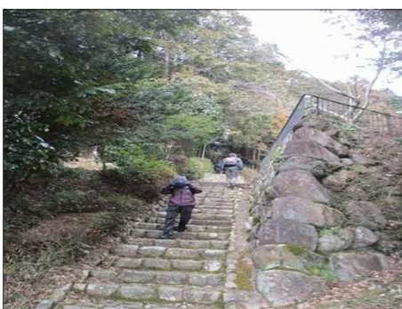
4185 江神社の急石段を上る！