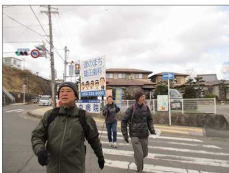
4231 もうすぐゴールで足取りも軽く