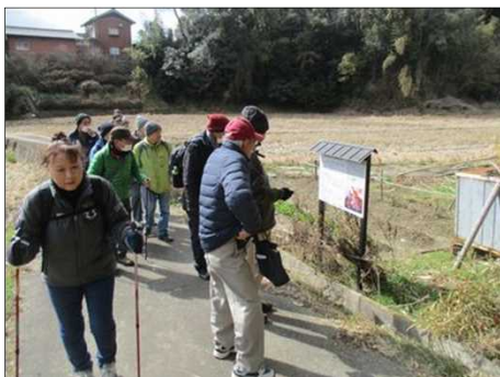
4202 金王道の看板発見