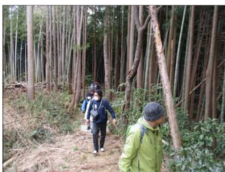
4177 竹林の中をウォーク