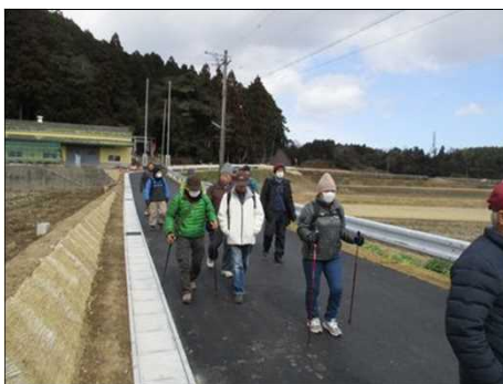
4192 腹ごしらえ完了、後半へ