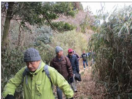
4215 身の丈以上の笹の中を歩く