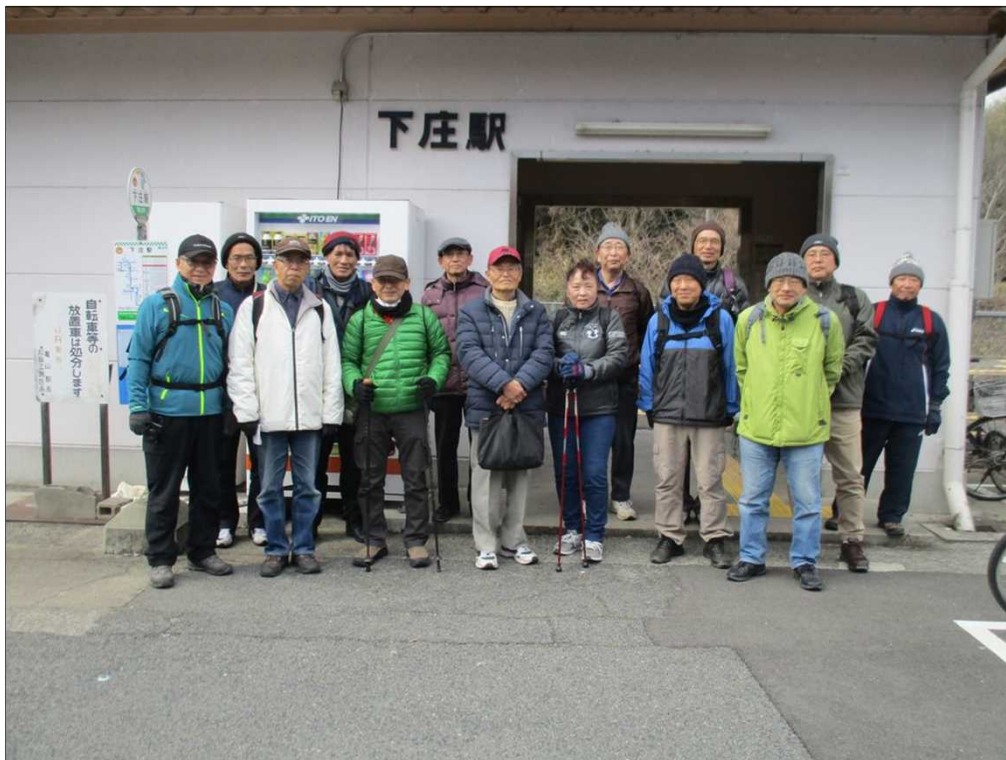
4173 JR 紀勢線 下庄駅を15名で元気にスタート