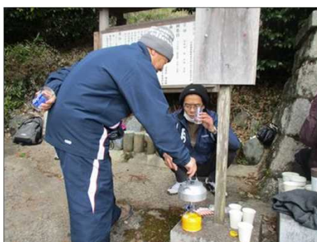
4188 バーナーでお湯を沸かす