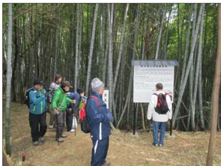
4220 大きな看板でルートを確認