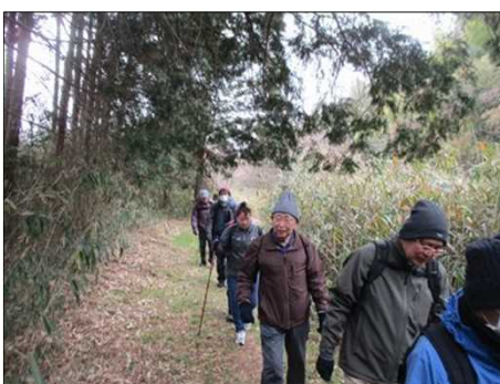
4176 一列に並んで進む