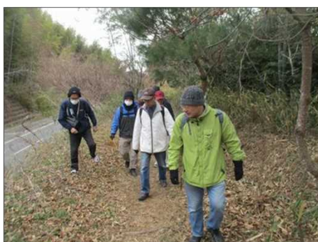
4174 いよいよ山道に入る