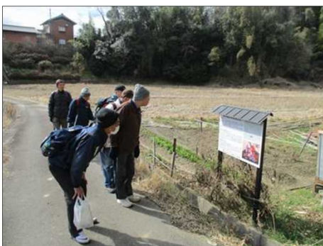
4204 金王道の謂れを知る！