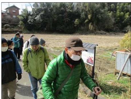
4203 いよいよ金王道に入る！