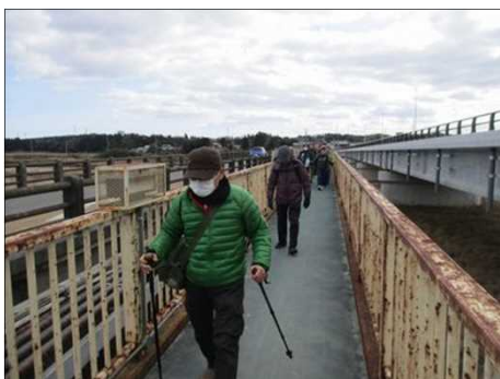
4223 横には新橋が工事中