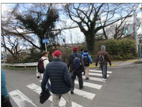
4229 ルールを守って横断歩道を歩く