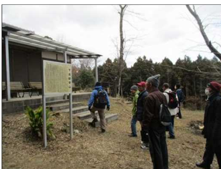
4180 数十の観音様があった