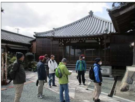
4199 思い思いに休息を取る