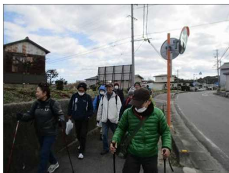
4222 いよいよ亀山市街地へ