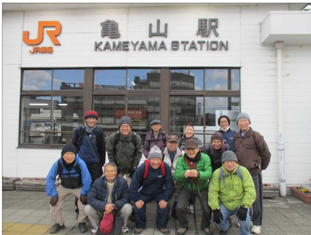
4234 JR 亀山駅に無事全員到着！