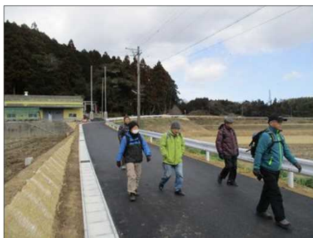
4193 新品の舗装道路に行く