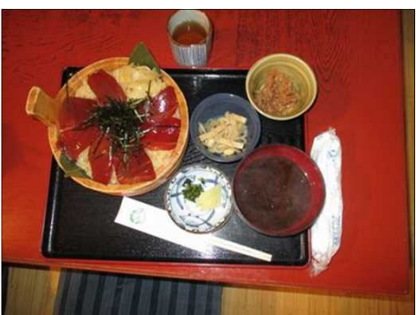
4131 「すし久」の「てこね寿司」