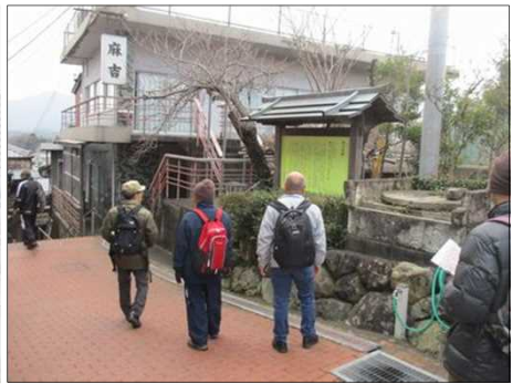
4119 麻吉旅館の謂れを知る