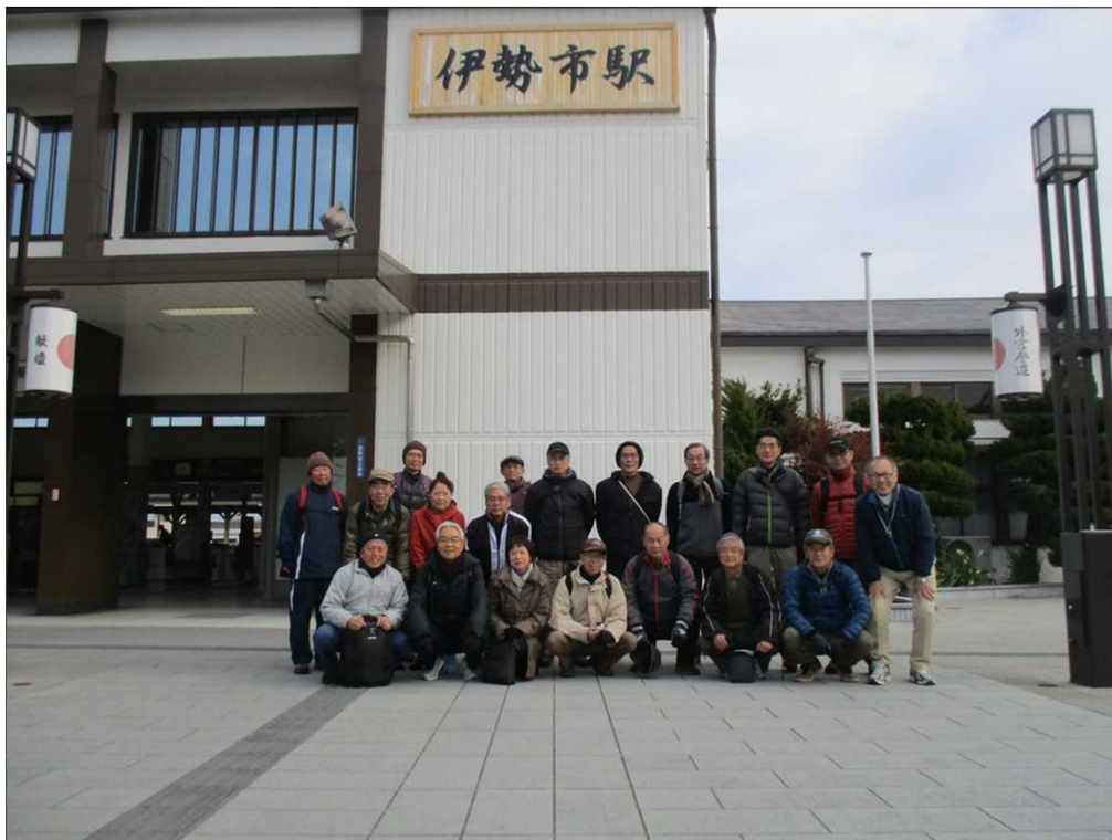
4098 JR 参宮線 伊勢市駅を19名で元気にスタート