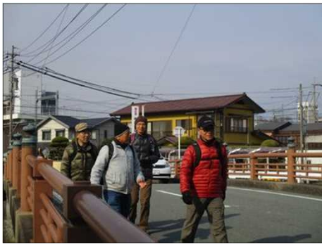
4117 最後尾Gさん 談笑しながら