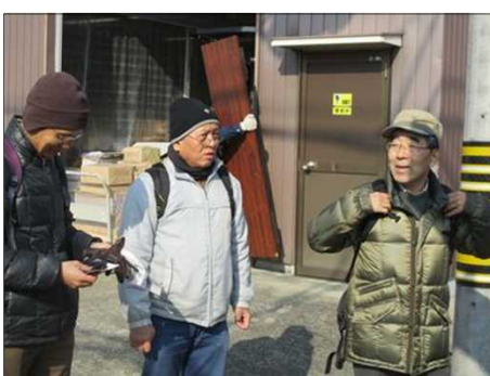
4111 着ぶくれ感あり！(失礼)