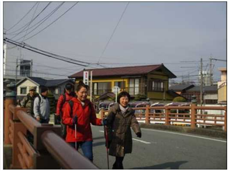
4116 優雅に渡る女性陣