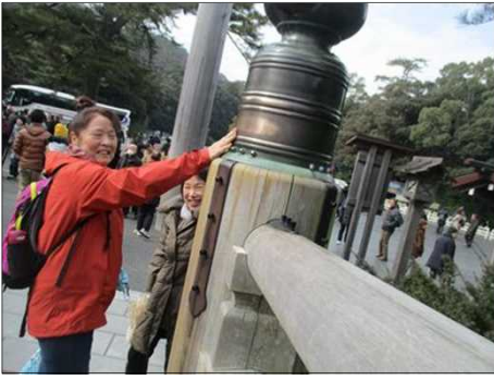
4135 欄干内にお守りが安置