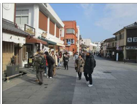
4101 土産物、飲食店が軒を並べる