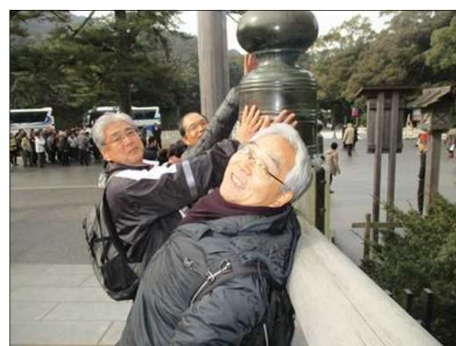
4134 内宮入口の欄干に触る！