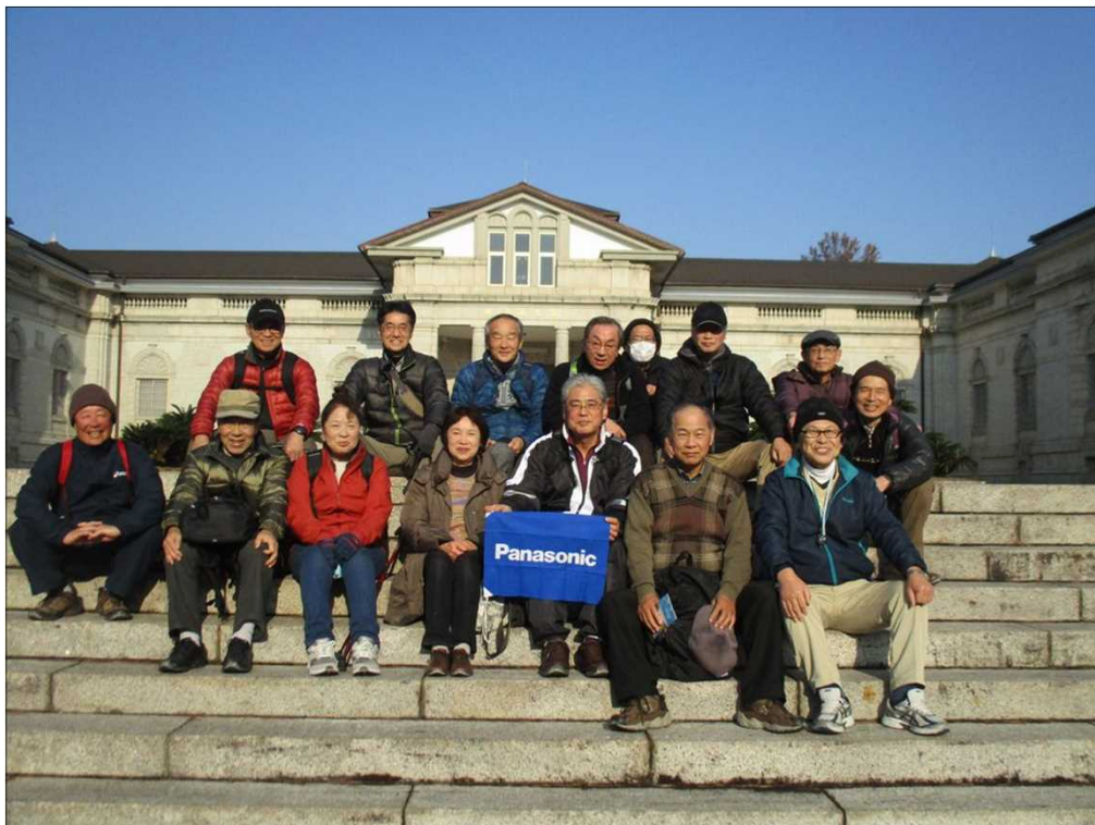
4156 白垂の神宮徴古館(新宮の由来並びにの本文化の変遷を徴する)前にて