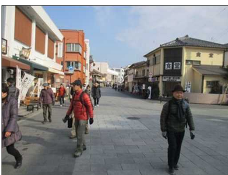
4100 綺麗に整備された参道