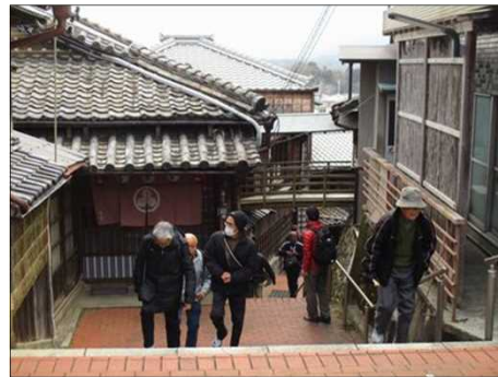
4121 創業200年の木造旅館