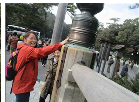
4135 欄干内にお守りが安置