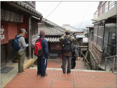
4120 昔の賑やかな声が聞こえそう