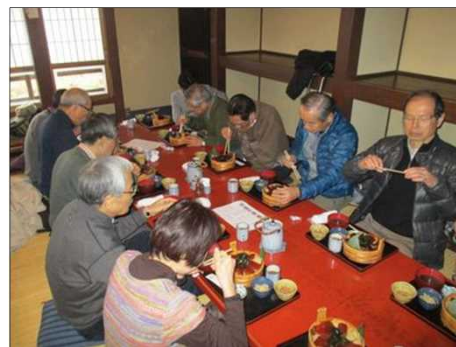
4129 歩こう会に昼が来た！