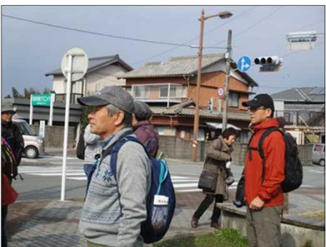
4126 交通ルールを守って