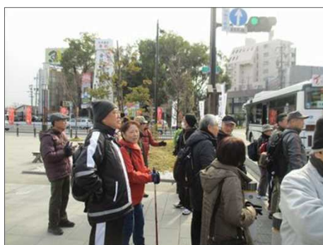
4099 信号待ちで立ち止まる