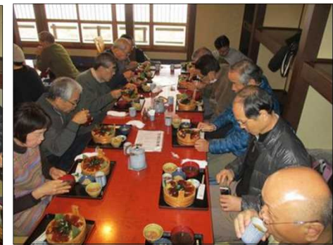
4130 皆 お寿司を頬張る