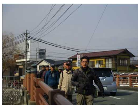
4113 先頭Gさんが引っ張る