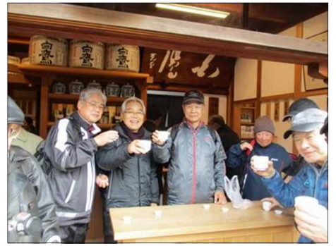
4142 美味しくお酒を浴びる