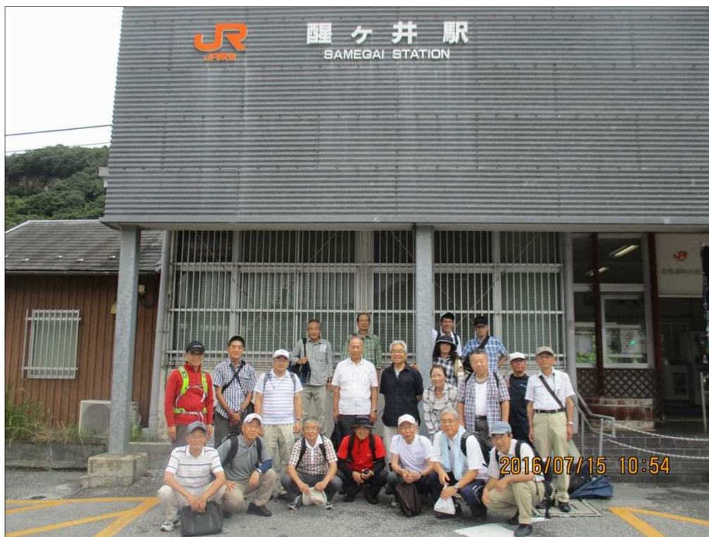
2241 すっかり止んで涼しい中、無時、全員ゴール！