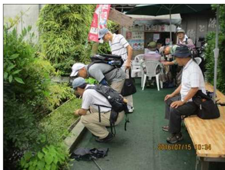
2234 淡水魚「ハリヨ」を探す