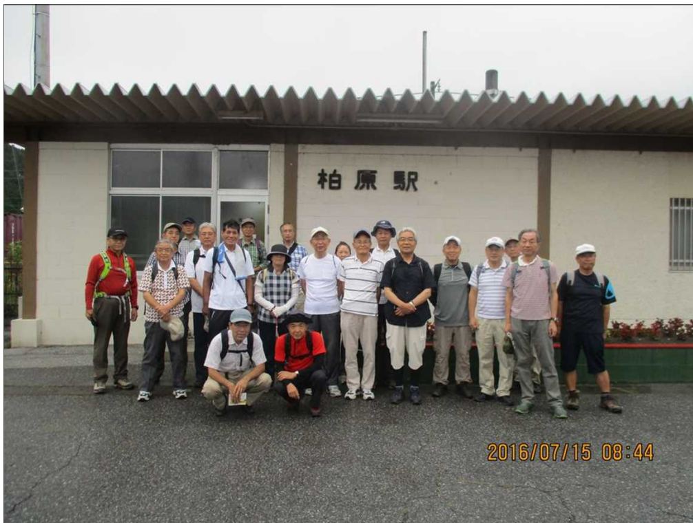
2171 小雨の中、滋賀県 柏原駅を23名で元気にスタート