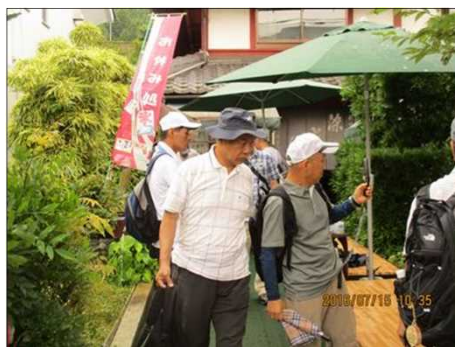
2236 一休みして元気復活