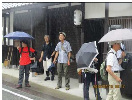
2199 雨止んで欲しいなあ！