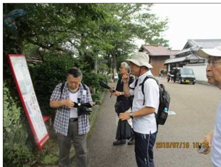
2232 小雨がすっかり止んだ！