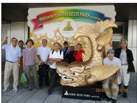
2243 お待ちかね麒麟ビールへ