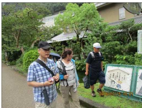
2215 友達で散歩楽しむ