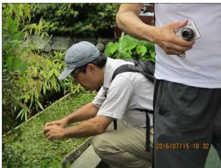
2229 白い可憐な梅花藻をパチリ