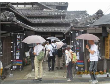
2183 柏原宿歴史館にて