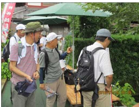
2235 清水の流を愛でる