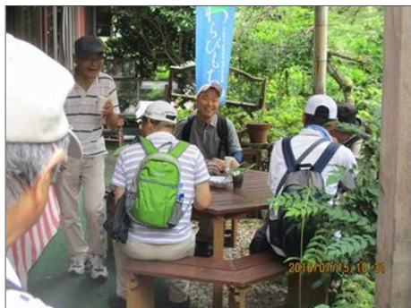
2227 特製の蕨もちを頂く！！