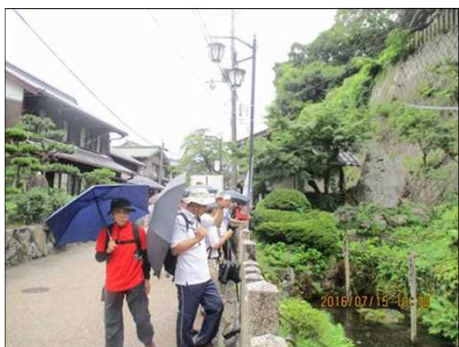
2210 居醒の清水に到着！