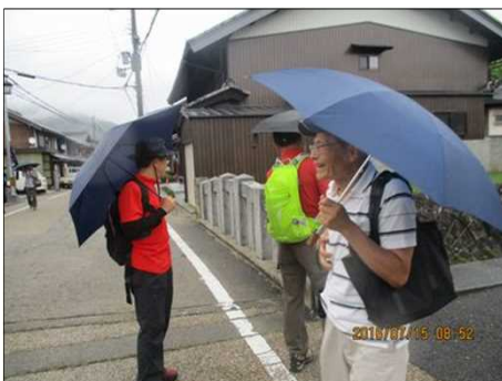
2175 傘をさしてのウォーク