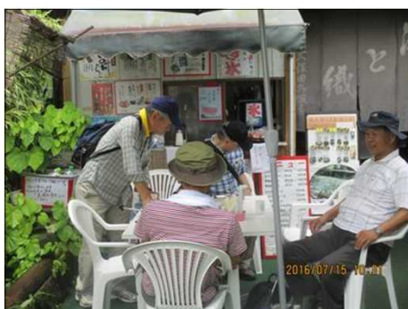
2225 お店で休憩 疲れた！