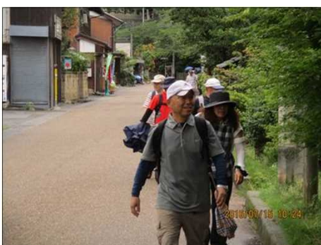
2220 小雨が止んで清々しい！