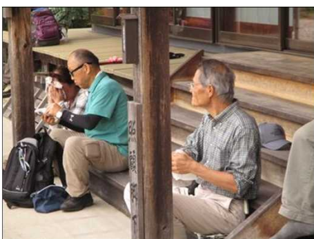
901 お寺の軒下で昼食