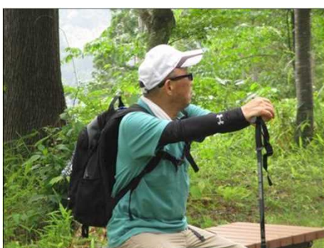
909 ベンチに座って休憩