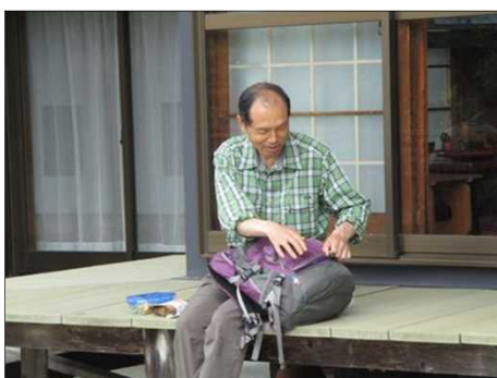
903 渡邊さんも手弁当