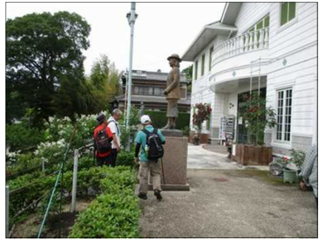
913 大正ロマン館を外側から見る