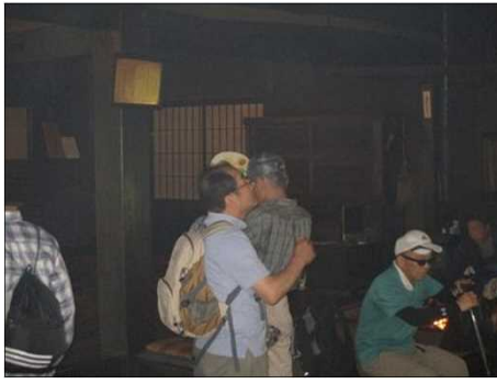
912 屋根裏の黒光りする骨格