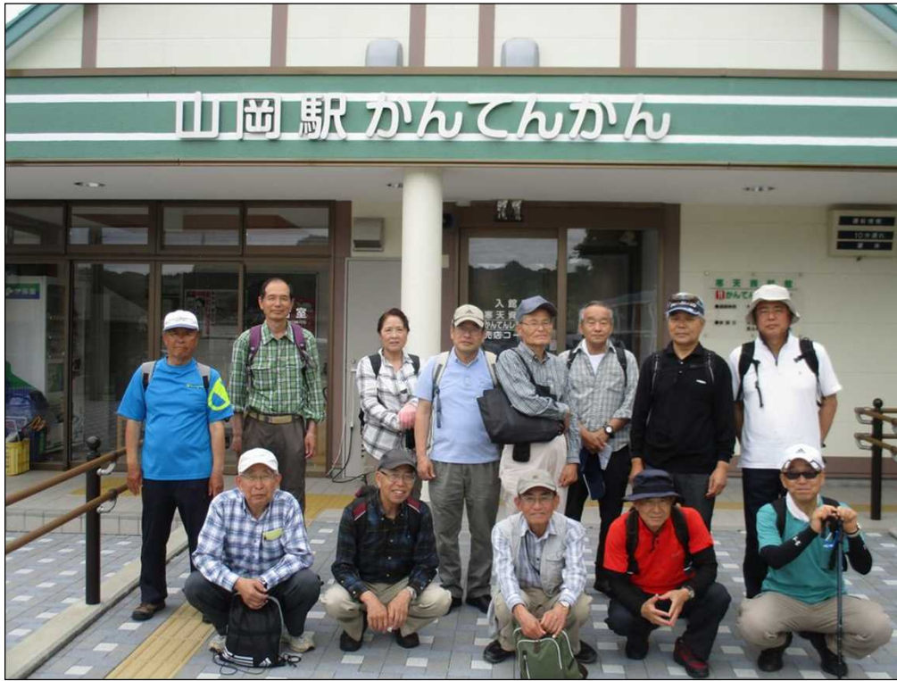
875 曇り空の下、明智鉄道 山岡駅を14名でスタート