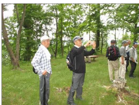
907 古に想いを馳せる