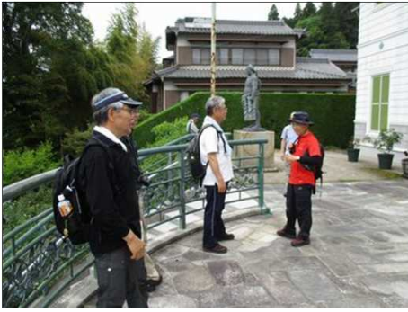
914 白亜の館に見入る