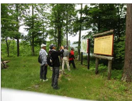
908 明智城の謂れを知る