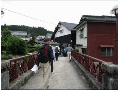
922 大正時代の路地裏へ