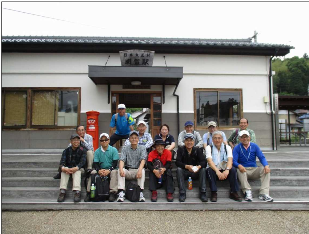
926 無事元気に明智駅に到着。お疲れ様でした。