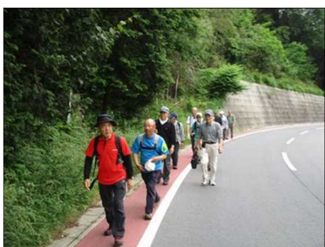
904 いよいよ後半戦へ