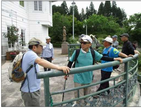
915 手すりに寄り掛かり休息