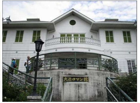
916 大正ロマン館正門