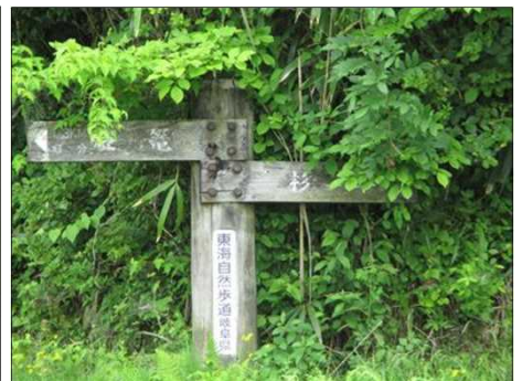
883 いよいよ東海自然歩道へ