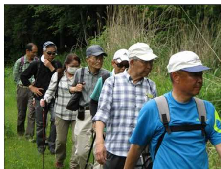
888 一列になって歩く