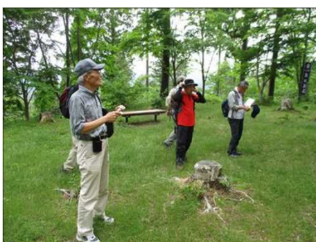
906 明智城本丸に到着