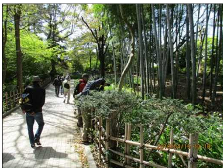
556 素晴らしい筍にパチリ