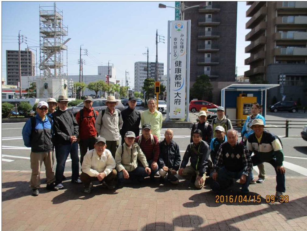
542 さわやかな天候の下、JR大府駅を19名でスタート