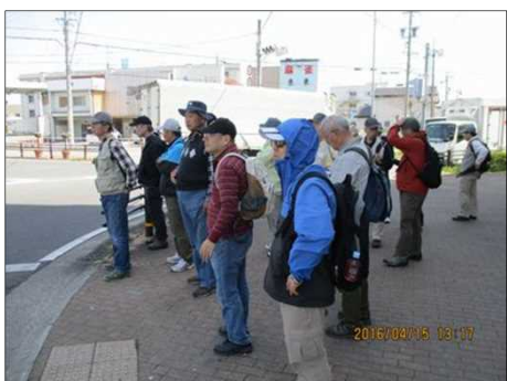
608 少し風が出て来た