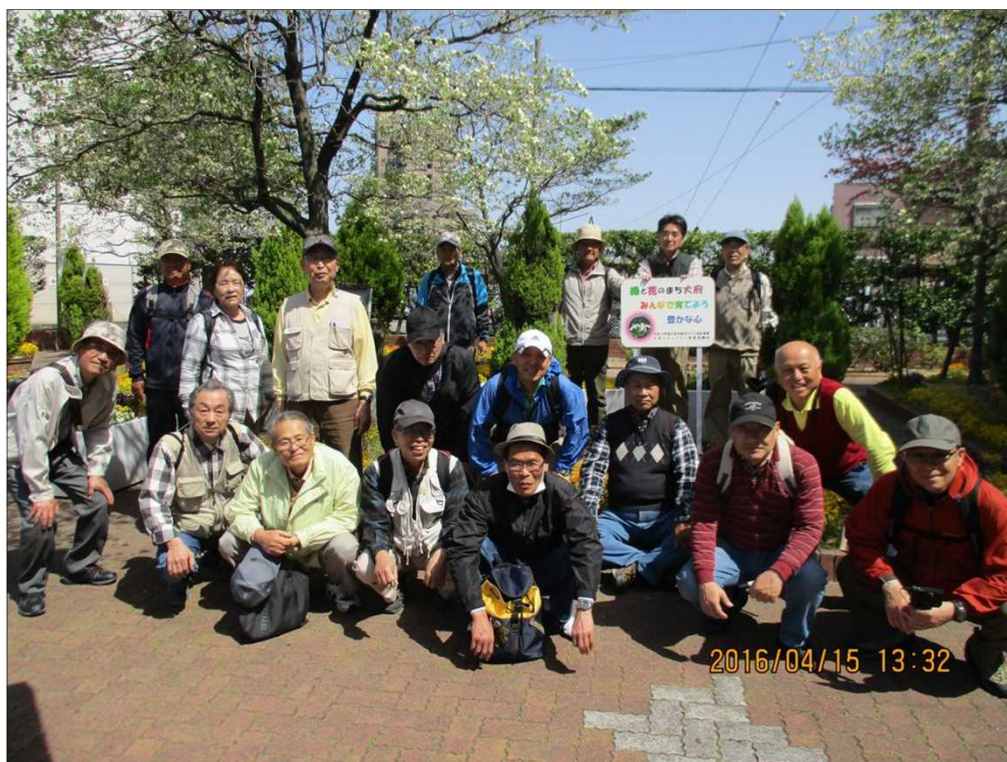
610 無事元気にゴールしました！ お疲れ様でした。