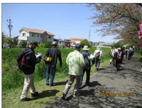
576 歩こう会のお通りだ