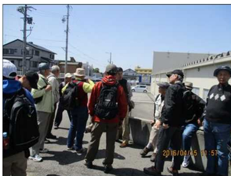
583 腹ごしらえ完了後