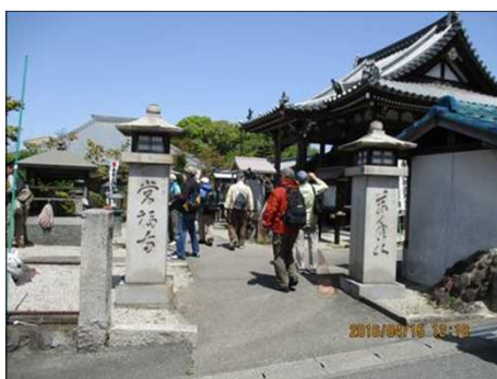
593 常福寺 正門