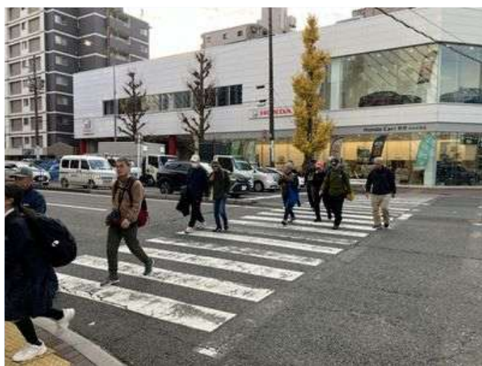
22 ゴールの名古屋駅に急ぐ(忘年会)