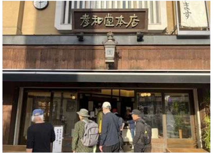
93 老舗 孝和堂 本店にて