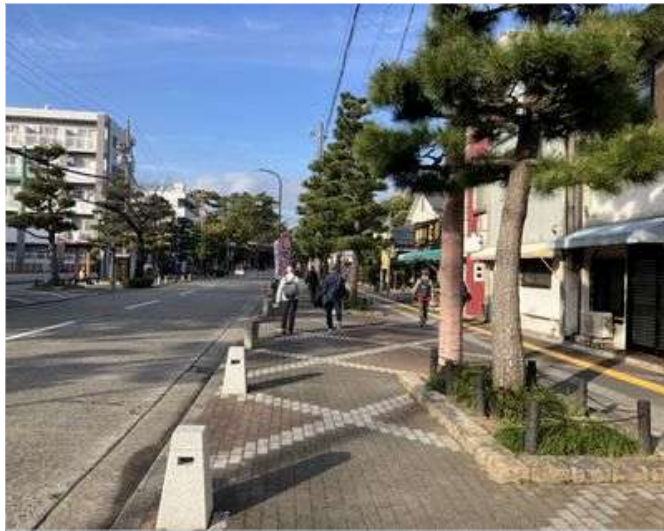
94 行き届いた参道(松林)