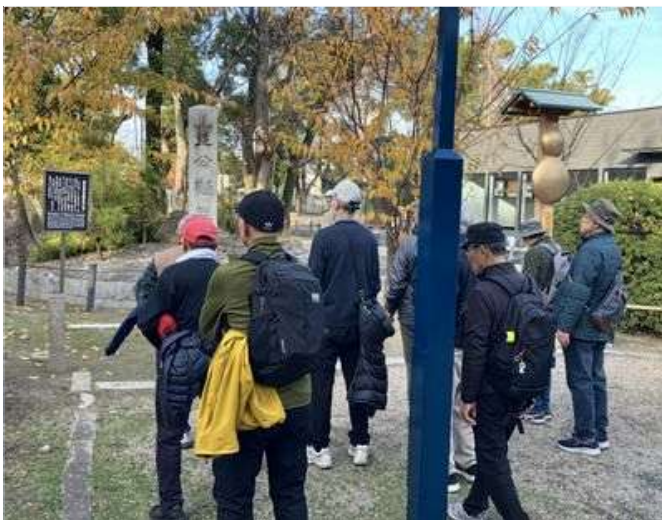
07 秀吉 生誕地の石柱前で