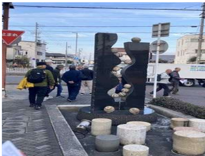
12 秀吉の公園のモニュメント