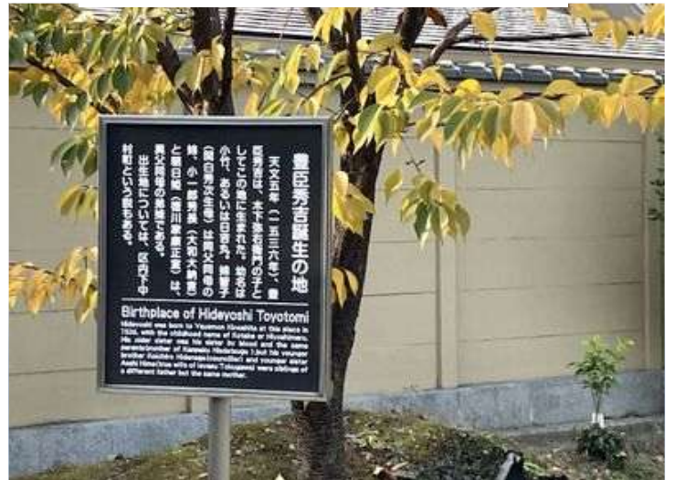
08 秀吉 生誕地の説明文