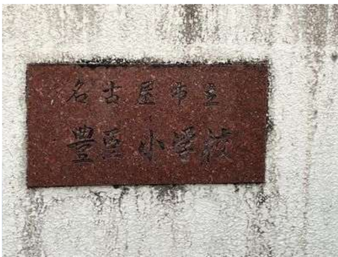
16 名古屋市立 豊臣小学校の看板