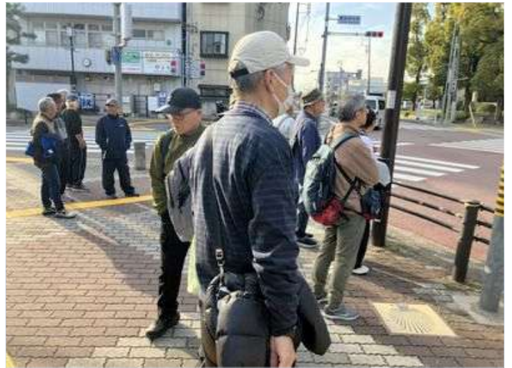
97 信号待ちで待っている