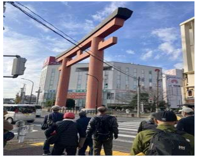
89 豊国神社の赤い大鳥居