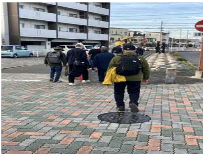
11 小川のモニュメントを往く