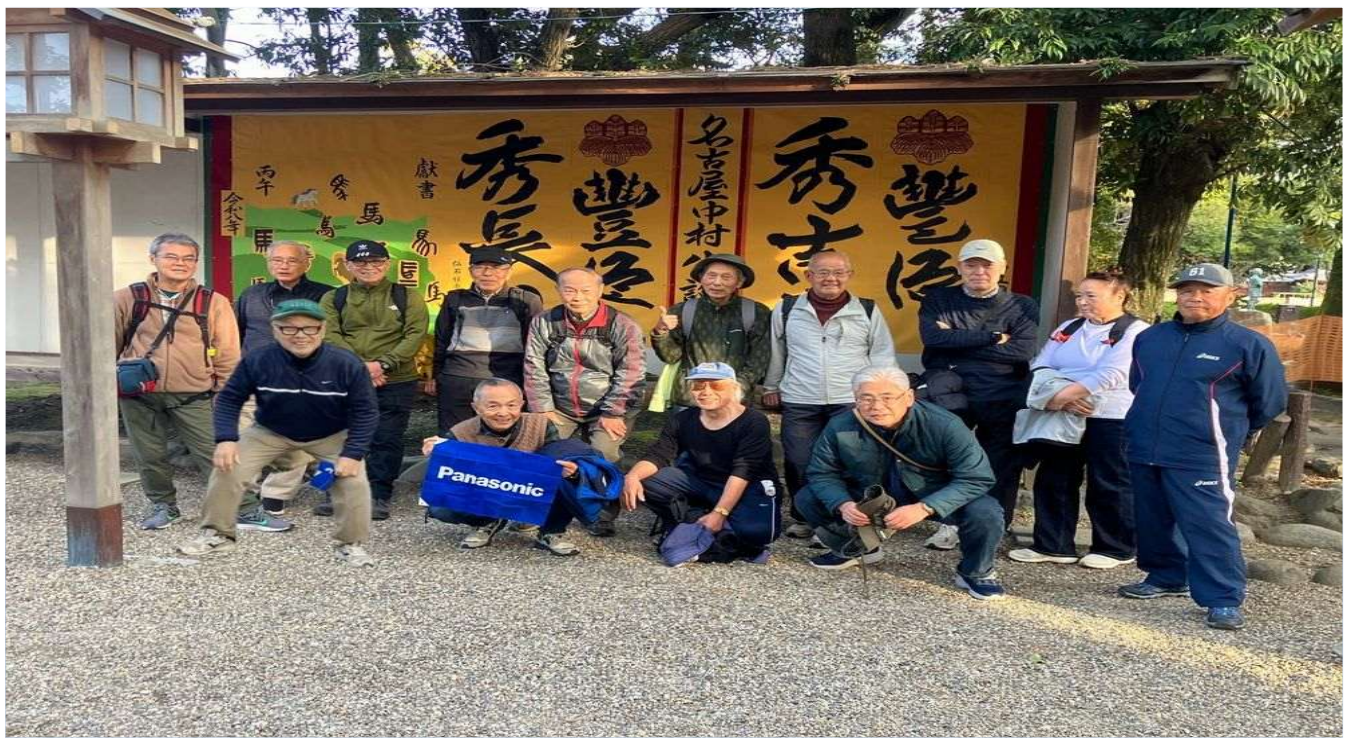
23 中村公園にある豊国神社の境内にて