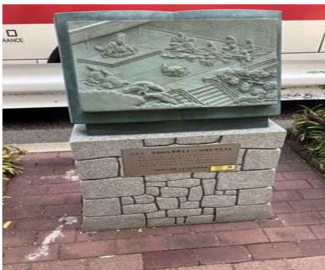
87 あちこちに秀吉の偉業の絵巻が