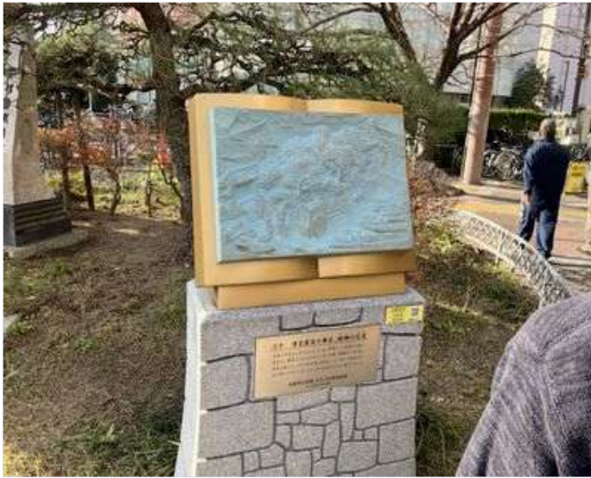
92 真新しい秀吉の歴史絵巻が