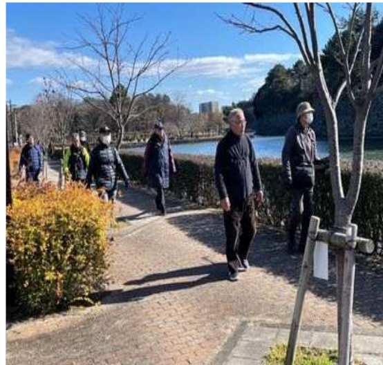
16 名古屋城をぐるっと！