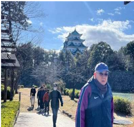
25 名古屋城の鯨が綺麗