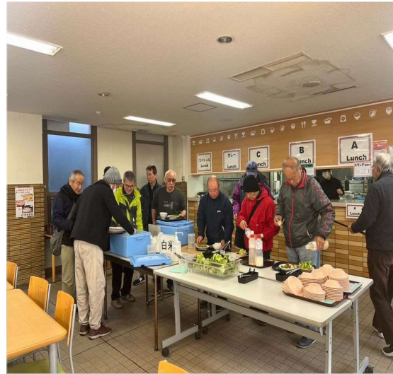
55 名古屋市 本庁の職員食堂で昼食