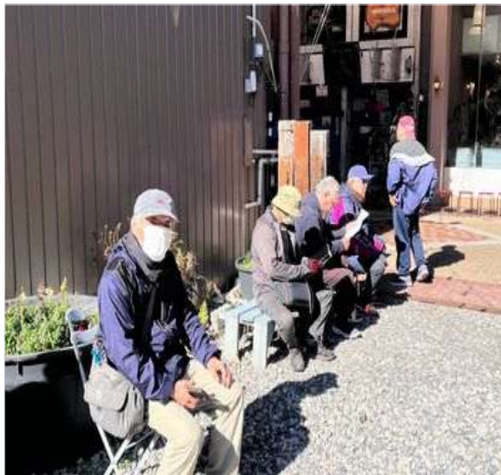
1 風の来ない場所で休憩