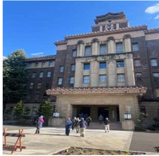
44 名古屋市役所 本庁