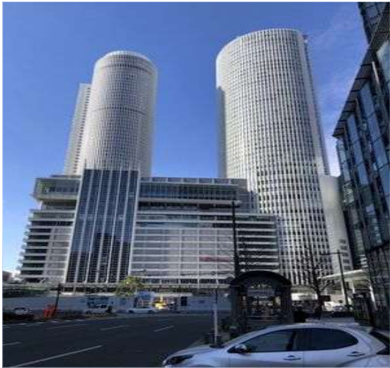
8 名駅前の高層ビル群