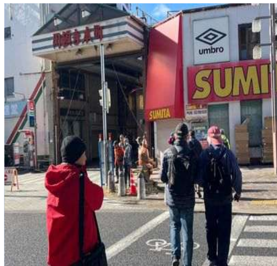
72 円頓寺商店街に入る