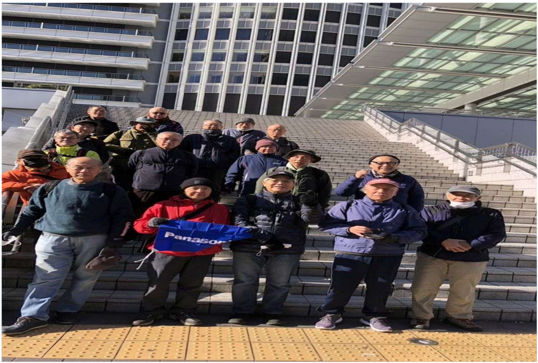
9 名古屋駅を20名で元気にスタート