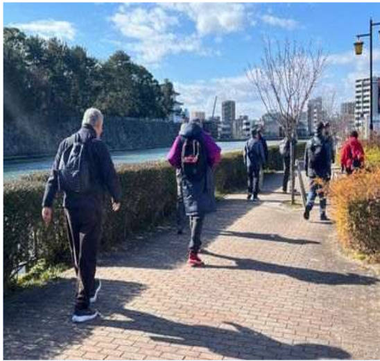
97 名古屋城の御壕を巡る