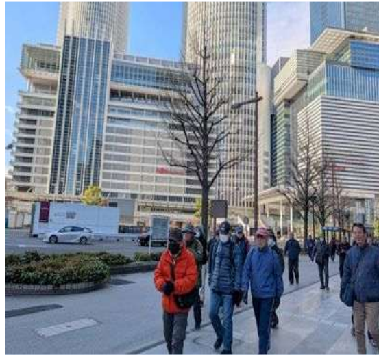
41 寒い中、元気にスタート