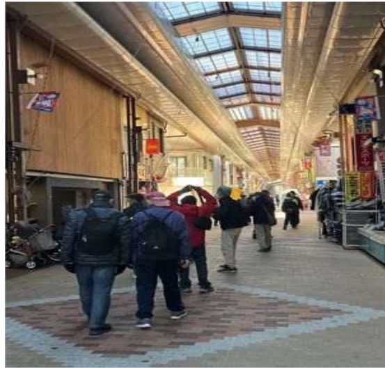
55 円頓寺商店街のアーケード