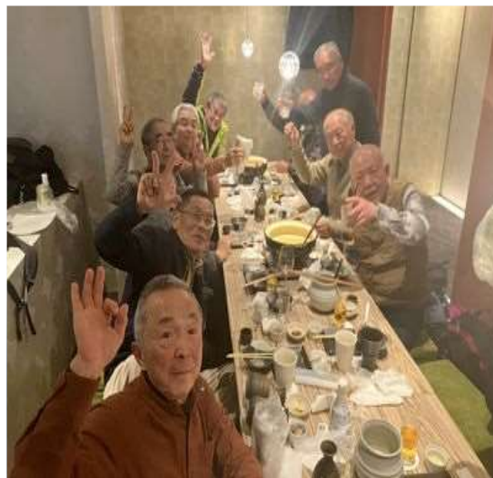
35 盛り上がっています