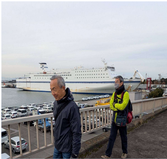
45 いしかりフェリーを横目にみて