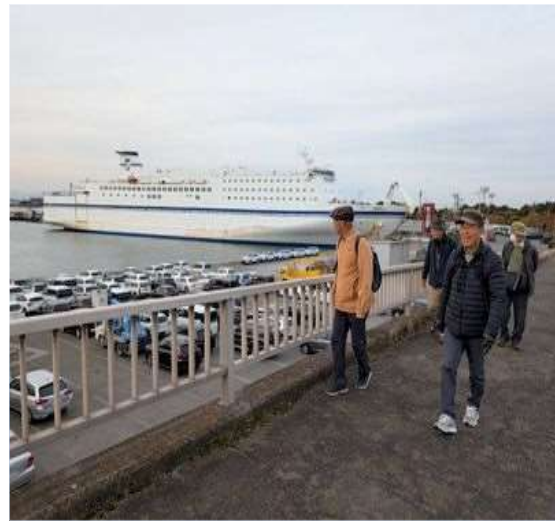
46 ビルのようなフェリー