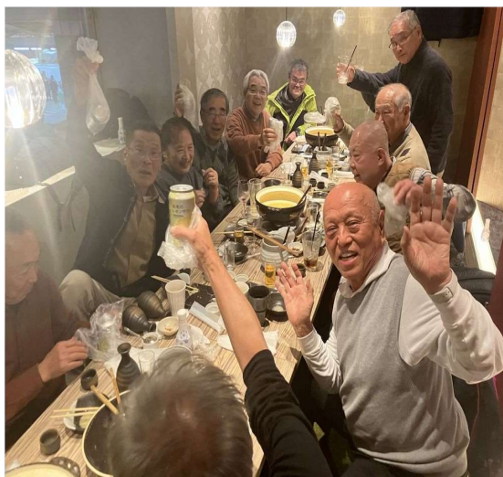
37 忘年会で盛り上がる