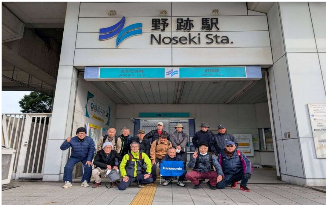
41 あおなみ線 野跡駅を15名で元気にスタート