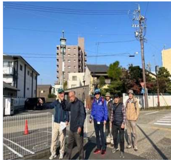
35 蓬萊軒の鰻の香がする