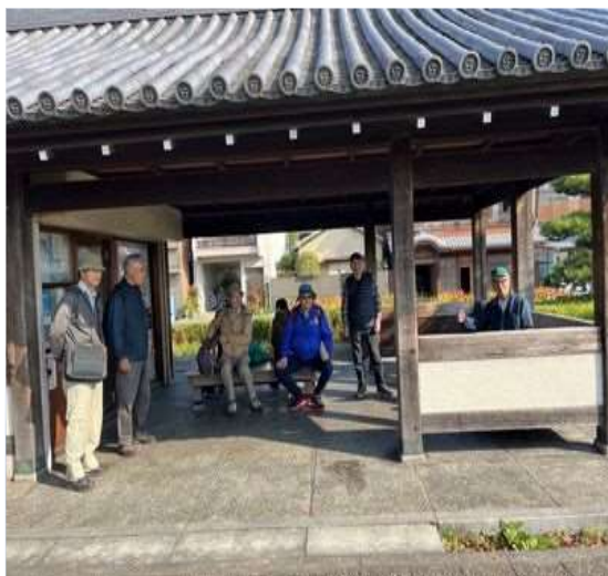
39 宮の渡しで休憩する