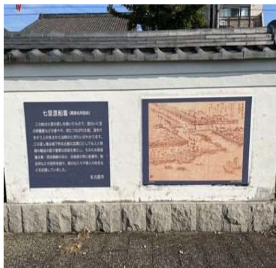
40 宮の渡しの説明看板