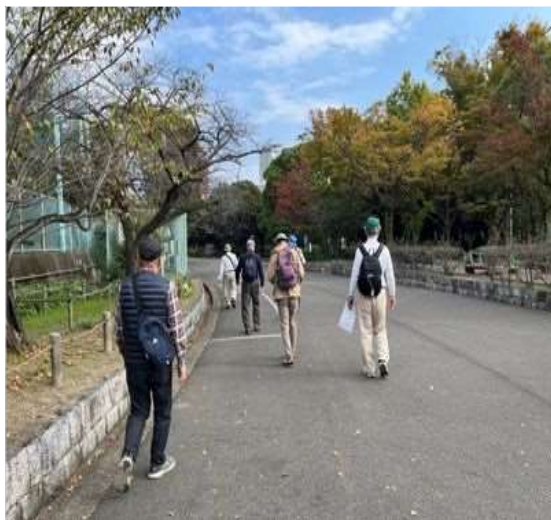
55 熱田神宮公園(断夫山古墳)