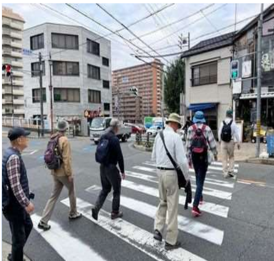
57 いよいよ終盤、金山駅へ