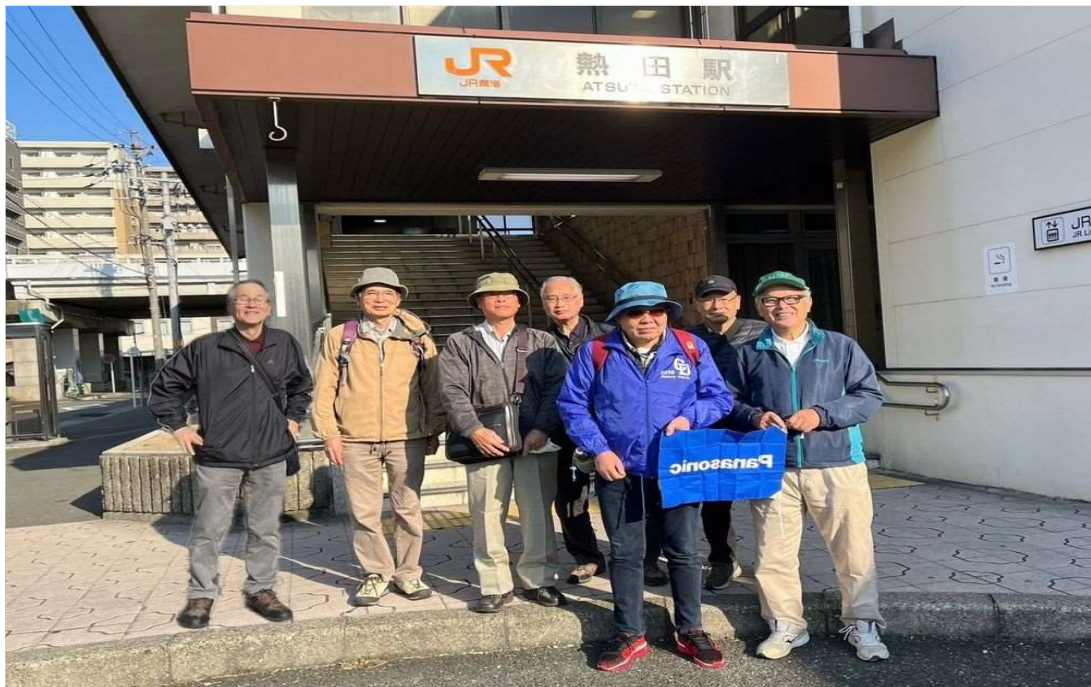
30 東海堂本線 熱田駅を7名で元気にスタート