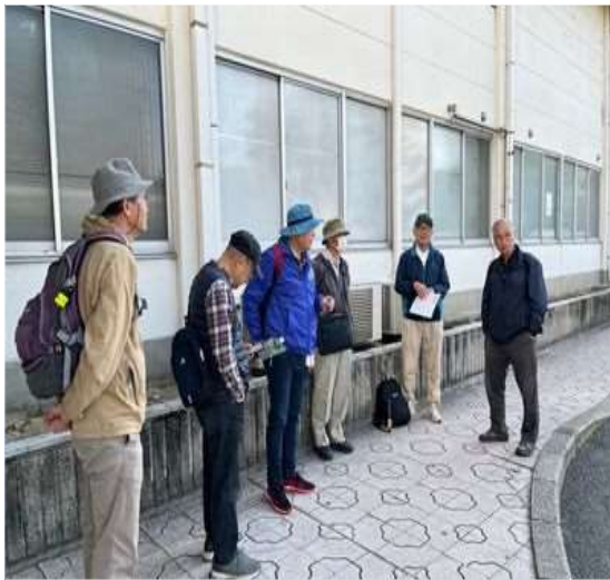
31 いつもの連絡事項を説明