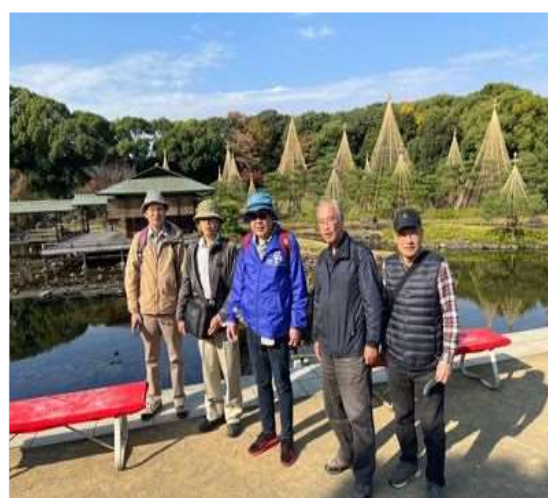
46 松の雪つりの前で