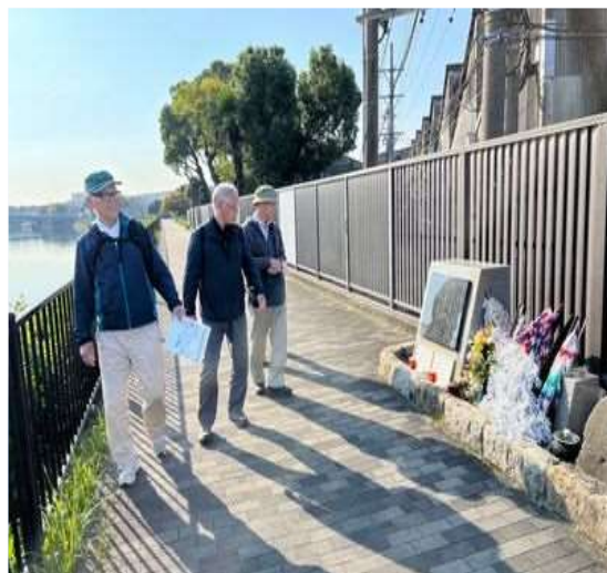
43 名古屋空襲での弾丸跡