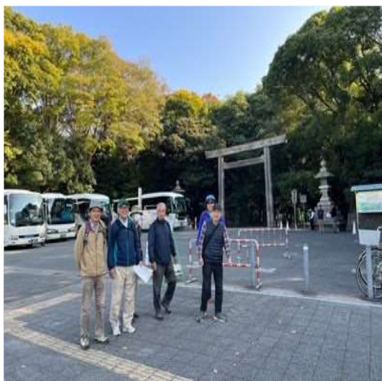
34 熱田神宮 西門にて