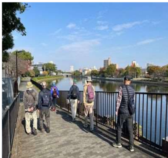
41 堀川沿いの整備された遊歩道