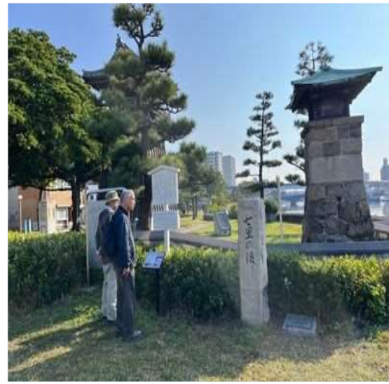
38 熱田の宮の渡し付近