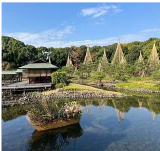
47 池に生け花と雪つり