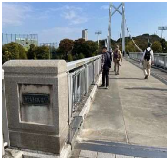
53 堀川に架かる洲崎のつり橋