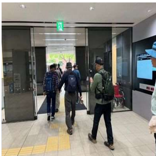
94 屋食の為、刈谷市役所に入る