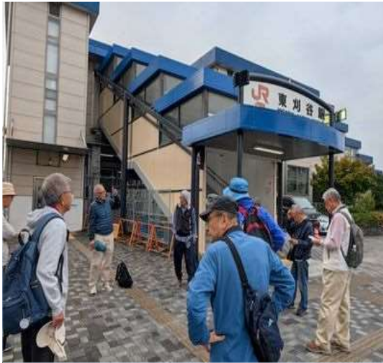
73 いつもの連絡事項を説明