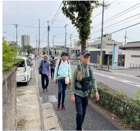
90 3軒目のパン屋に向かう