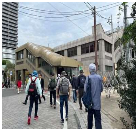
01 刈谷駅に到着、お疲れ様。