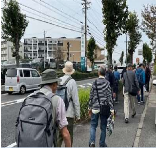
89 町並が綺麗な刈谷