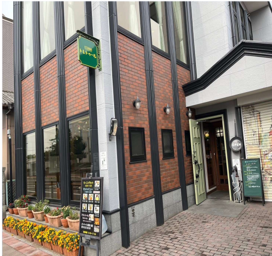
91 こじんまりしたパン屋