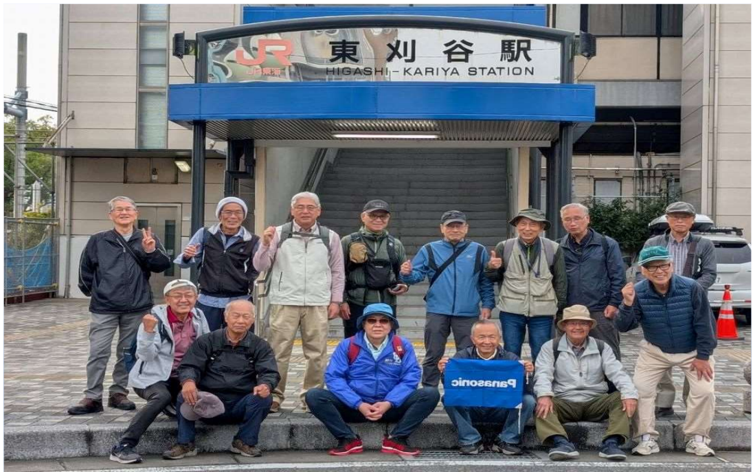
71 東海堂本線 東刈谷駅を15名で元気にスタート