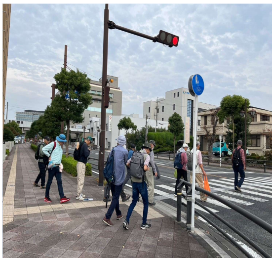
96 雑談しながら新号を渡る