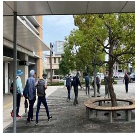
96 食事を済ませて市役所をでる