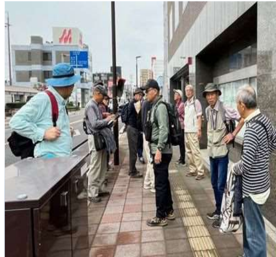
93 パン屋の外で待っています。