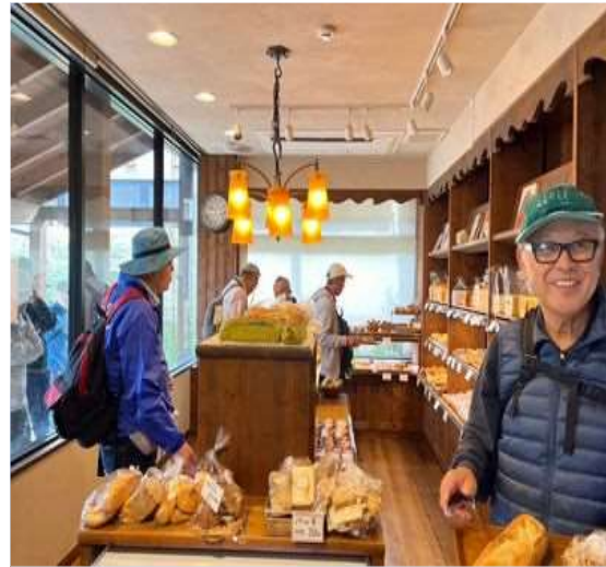
81 バケットパンと耳を購入