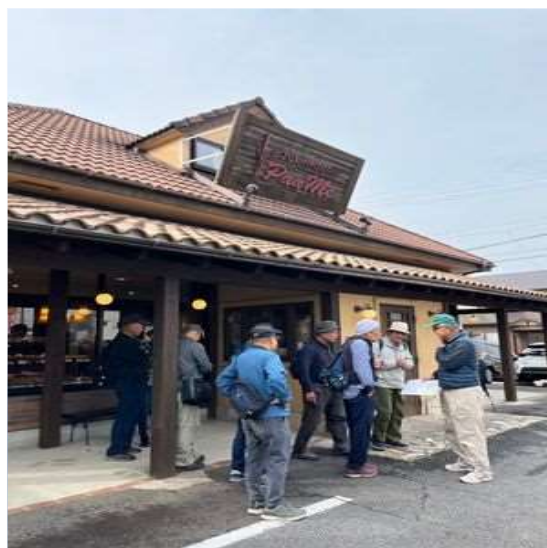
82 パンに関心が少ない皆さん