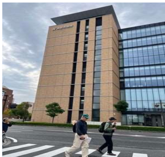
98 立派な刈谷市役所