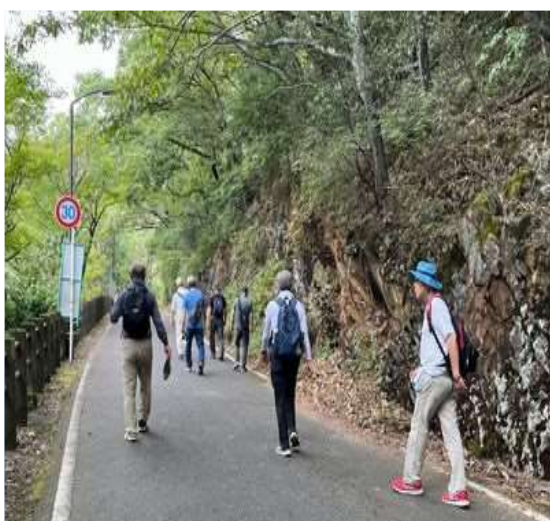
74 自動車道を下る、石ガキが急