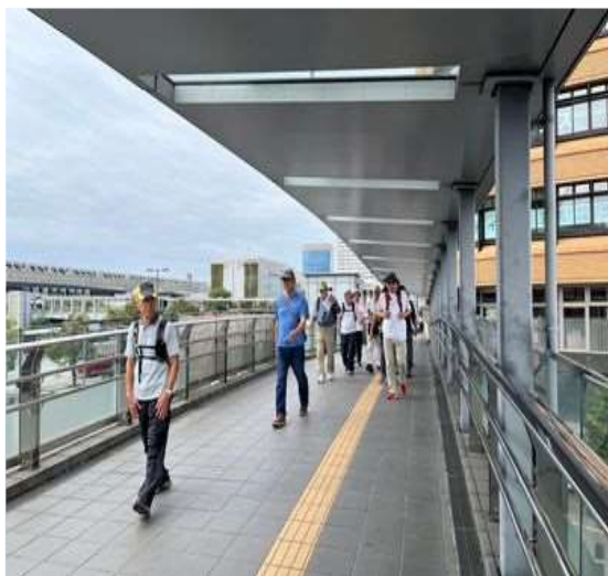
65 広い広い岐阜駅前通路