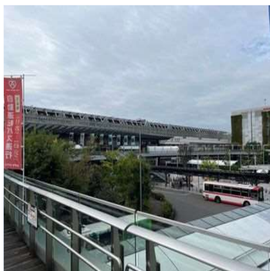
63 岐阜駅前のとても大きな連絡通路