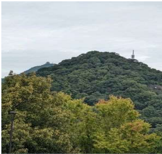
55 遠くに岐阜城が望めます