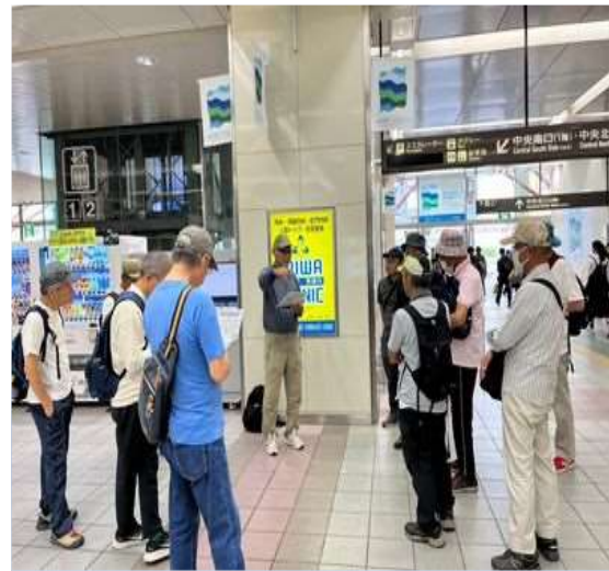
58 出発前のミーティング