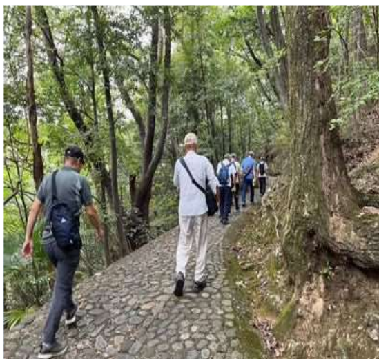
71 誰がこんな道を作ったのかな？