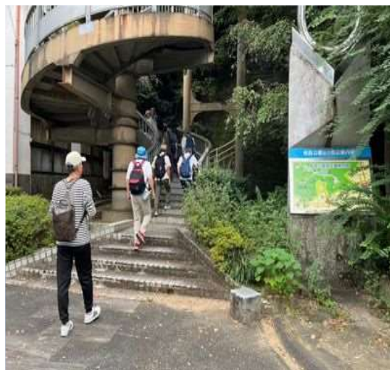
68 ラセン階段で3階迄