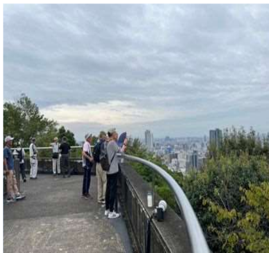
73 水道山展望台に到着