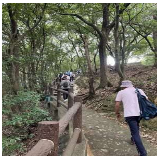
69 いよいよ石畳みを上る！