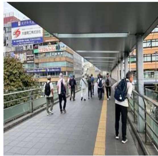
64 2階の連絡通路にて