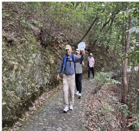
72 一番【きつい】所を行く