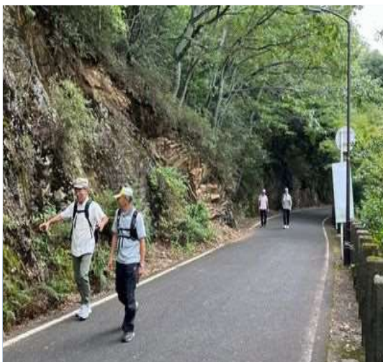
78 市街地まで下る、急峻な山腹