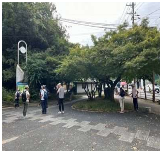
67 トイレ休憩を済ませる