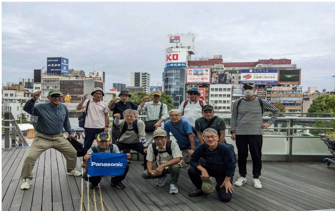
53 東海堂本線 岐阜駅から13名で元気にスタート、金ピカの信長像が見えます