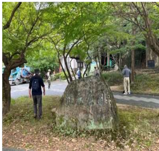
66 柏森公園に到着、いよいよ上りに