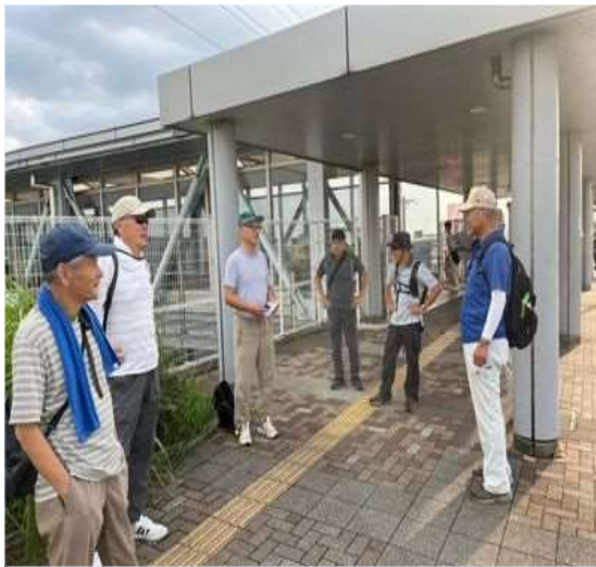
57 出発前のミーティング