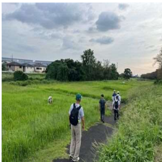
59 草が背の高さ迄伸びて