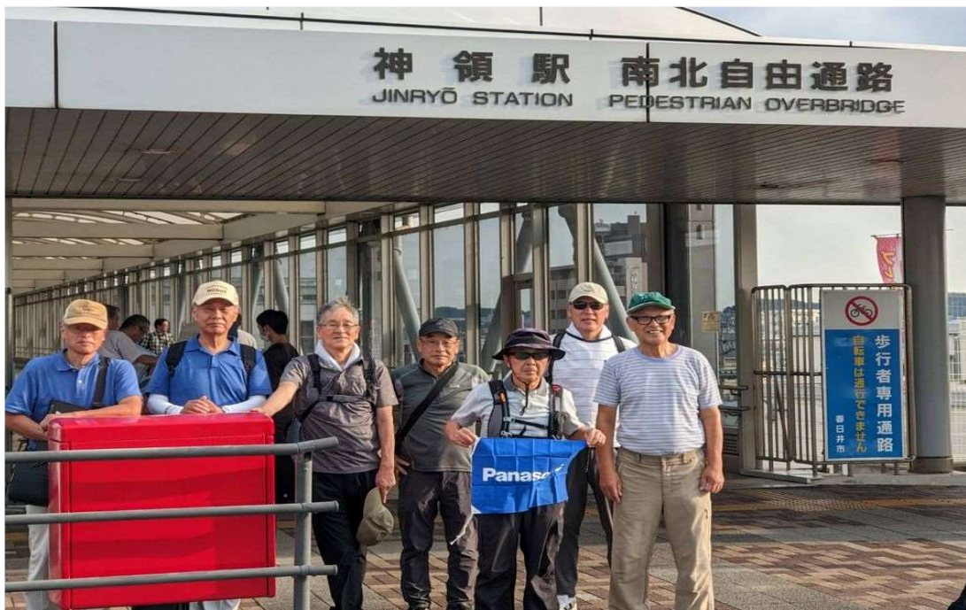
56 中央線 神領駅から8名で元気にスタート