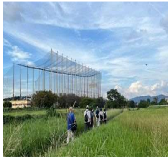
58 内津川の河川敷を一行で