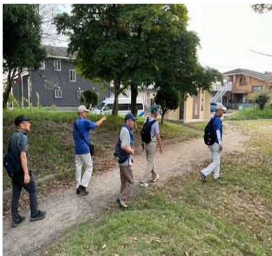
72 やっと藤ノ木公園に到着