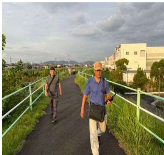
63 ウォーキングコースに最適