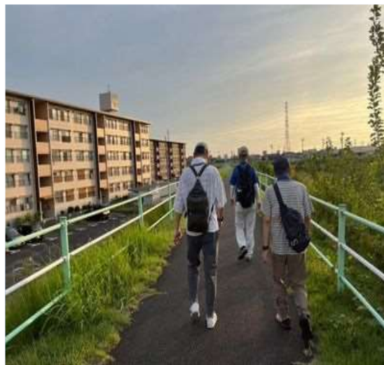
62 董台団地の側を通る