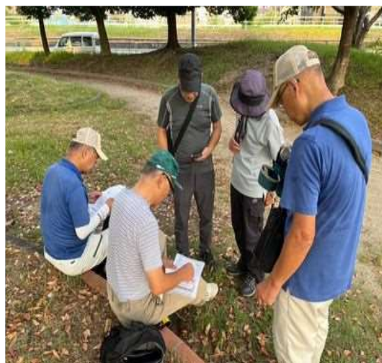
73 最初で最後の休憩