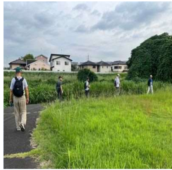
60 比較的涼しかった