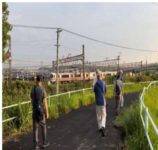
64 近くを中央線が走っている