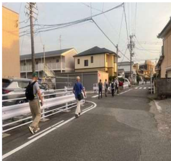
74 成田さんのご自宅を探す