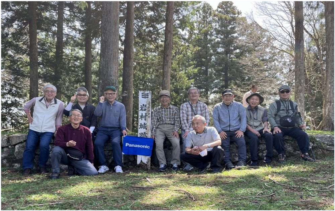
82 有志 10人が岩村城址に登城