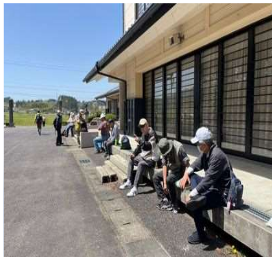
72 ふるさと富田会館にて休憩