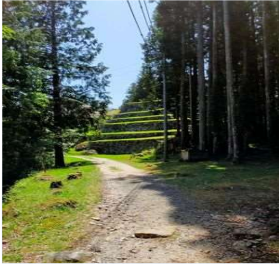
47 岩村城の本丸の石垣