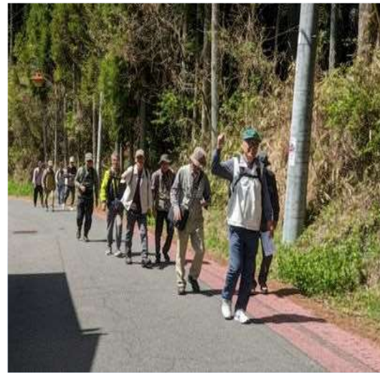
88 元気に急坂を上る