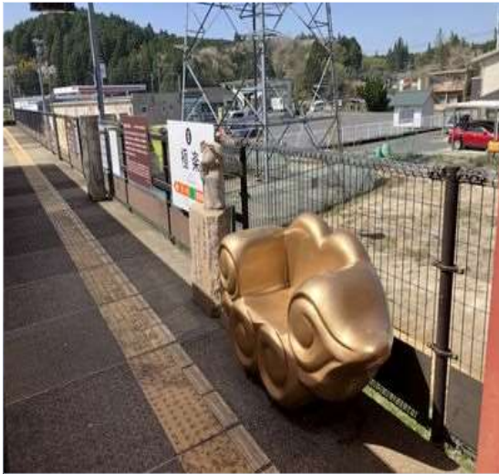
79 明知鉄道『極楽駅』きんと雲？