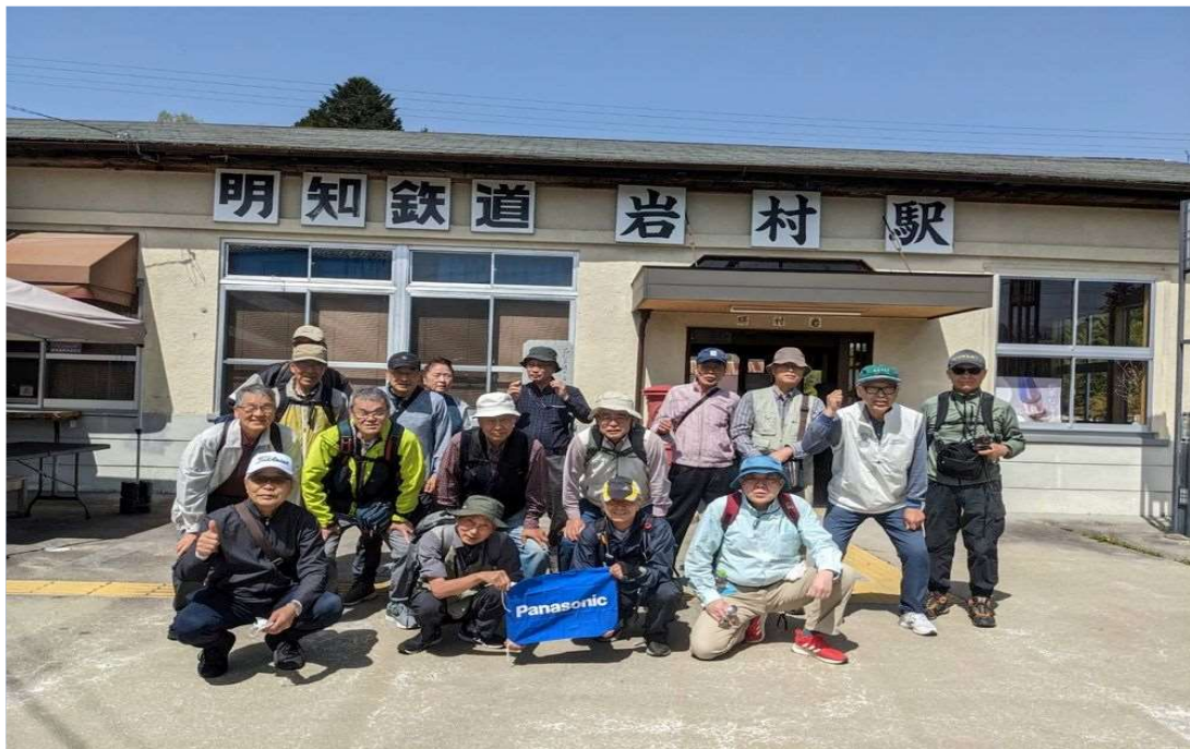
84 明知鉄道 岩村駅から18名で元気にスタート