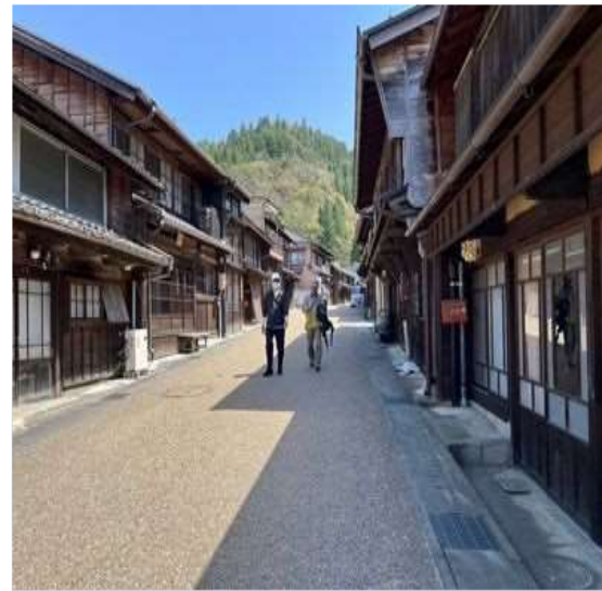
86 城下町 岩村の街並み