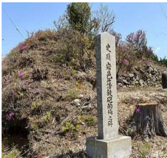
27 岩村藩鉄砲的場跡