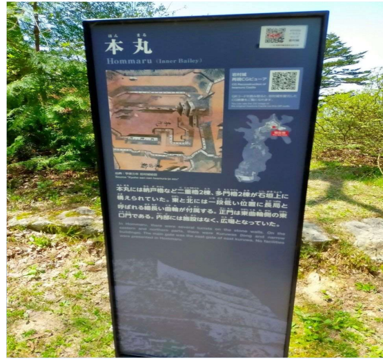
45 岩村城 本丸の看板