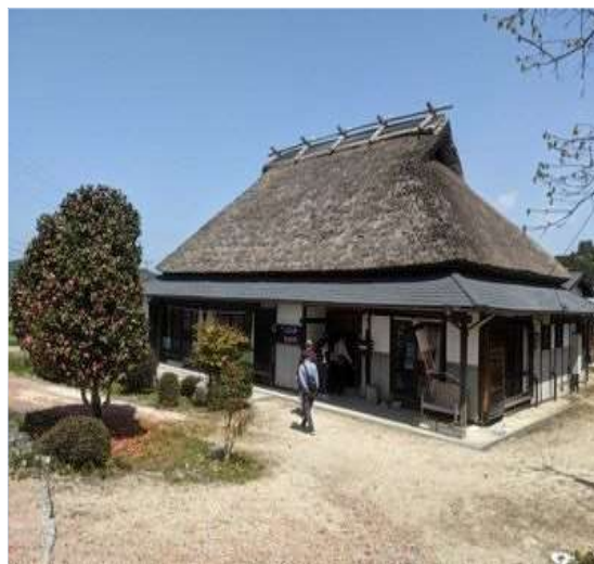
89 茅の宿『とみた』にて