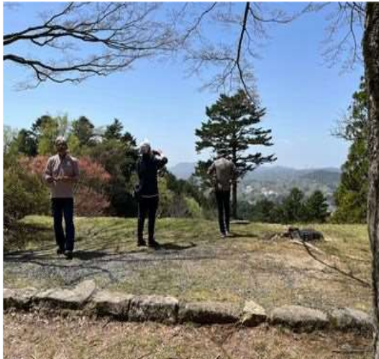
49 本丸から下界を見る