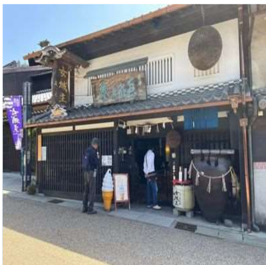
23 岩村醸造 『女城主』ブランド