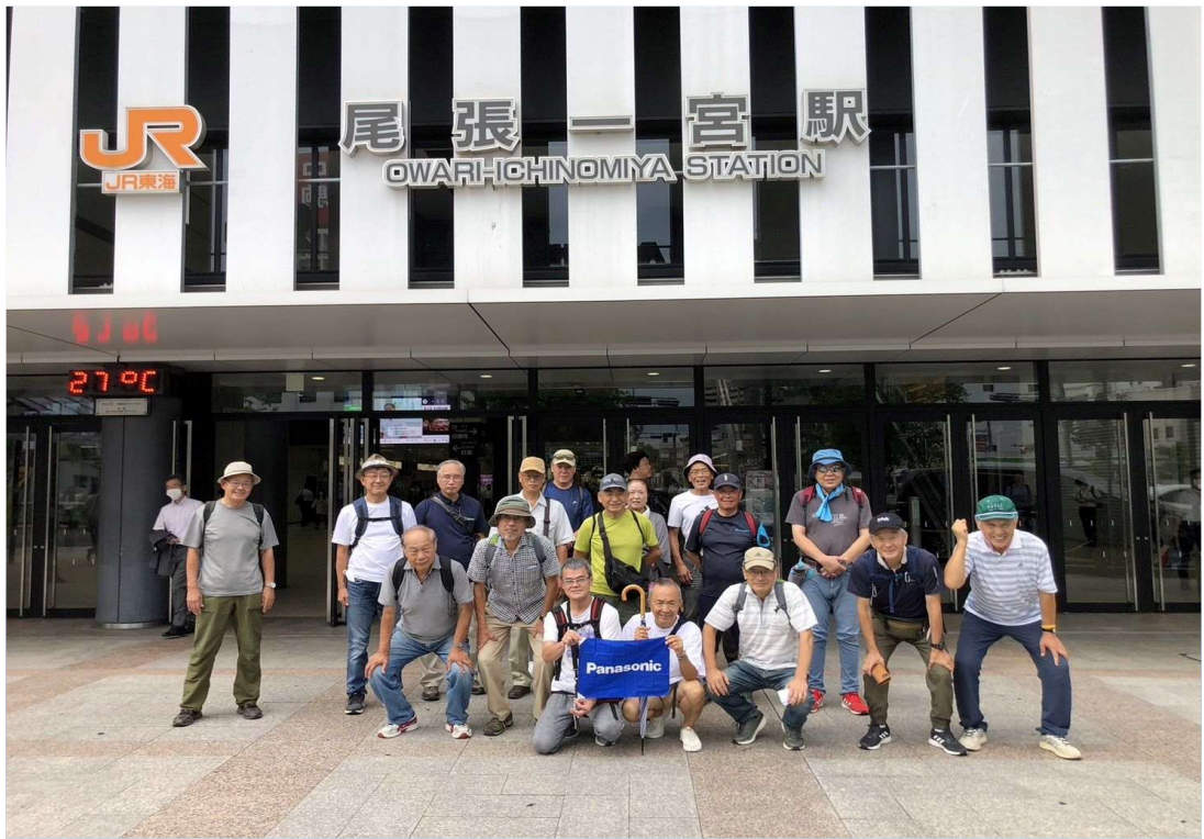
01 JR 尾張一宮駅を18名で元気にスタート