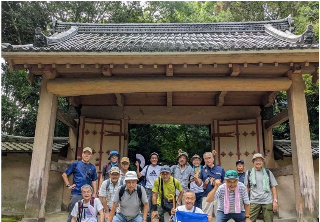
00 妙興寺 由緒ある山門まえにて