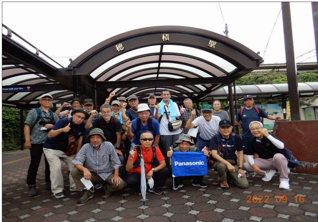
59 JR穂積駅、20名で元気にスタート