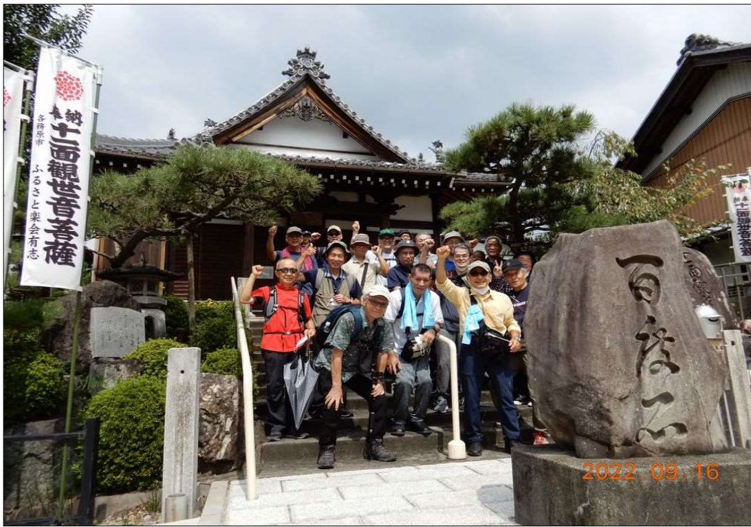
72 別府観音の本堂の前で