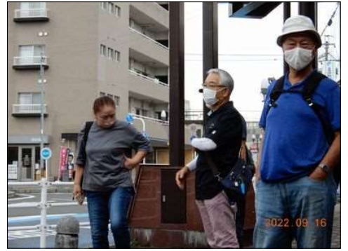
56 少しお腹のたるみが？