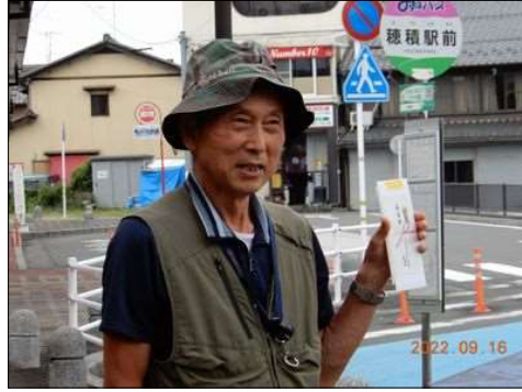
54 川北さんのお言葉