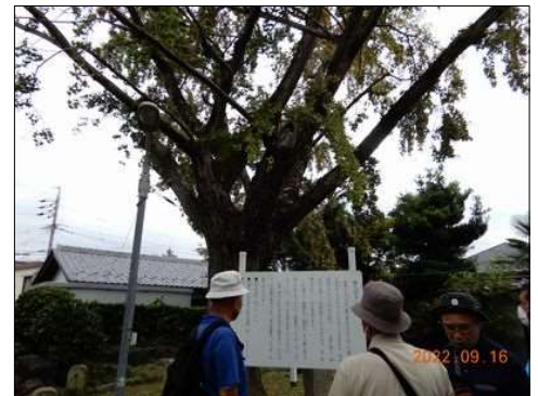
62 藤九郎銀杏の説明