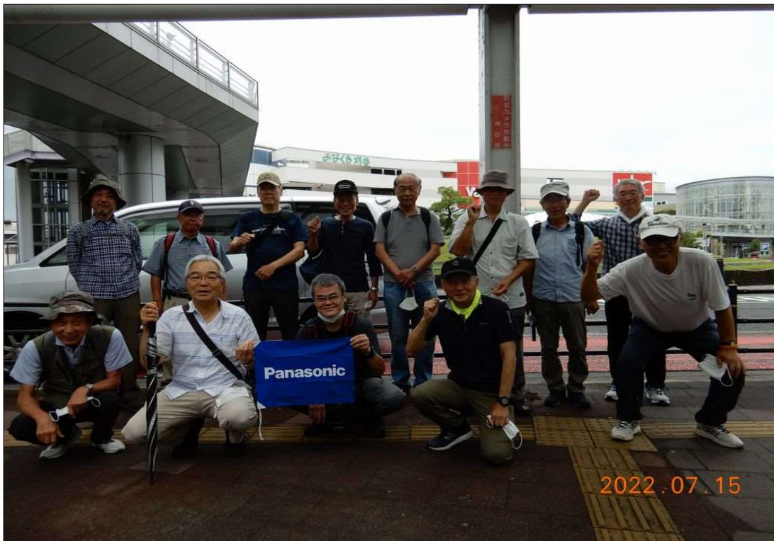
33 JR刈谷駅、13名で元気にスタート