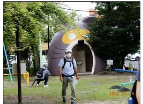
37 トイレ巡りでトイレ探しは不要