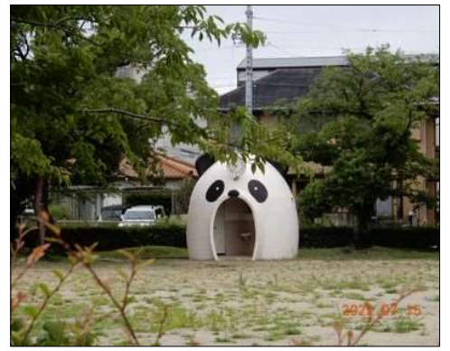
45 最終はパンダさん