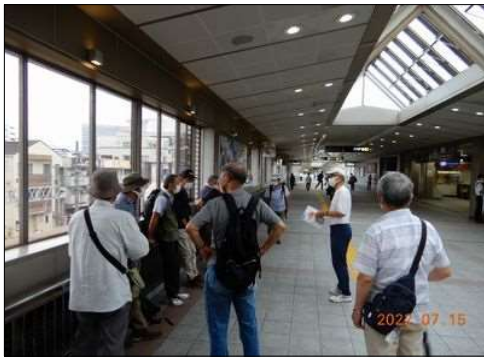
30 本日の行程の説明