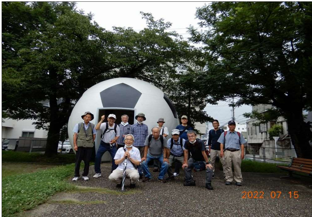
40 サッカーボールトイレ前で全体写真