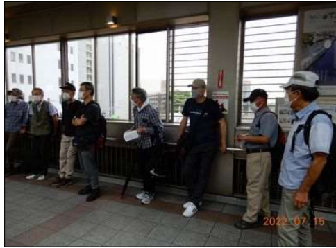
31 刈谷駅の南北連絡通路で