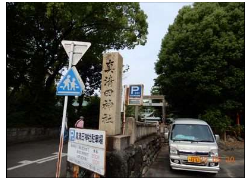
69 真清田神社に到着