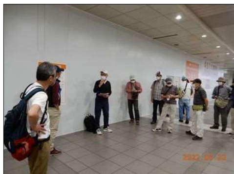
54 本日のコースの説明