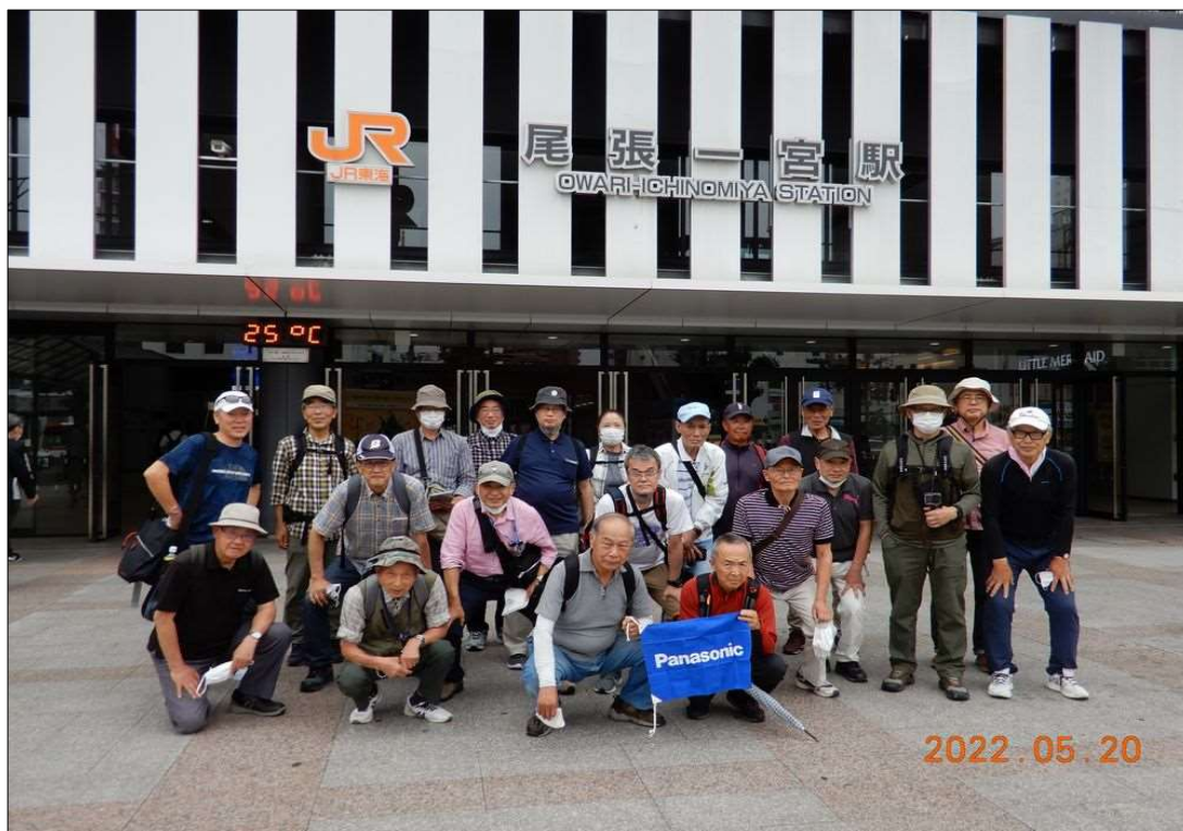
56 JR尾張一宮駅、22名で元気にスタート