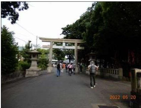
70 見事な鳥居をぐる