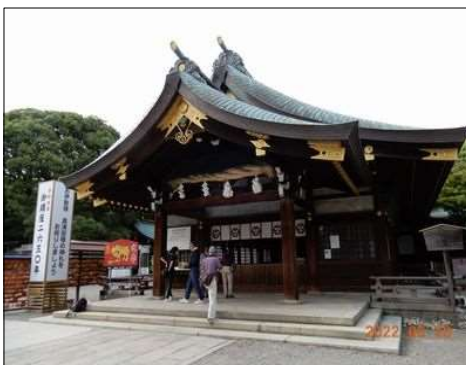
73 大きな、大きな本堂