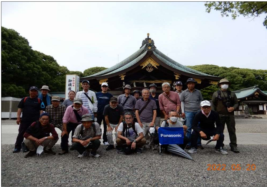
76 真清田神社 本堂の前で全員撮影