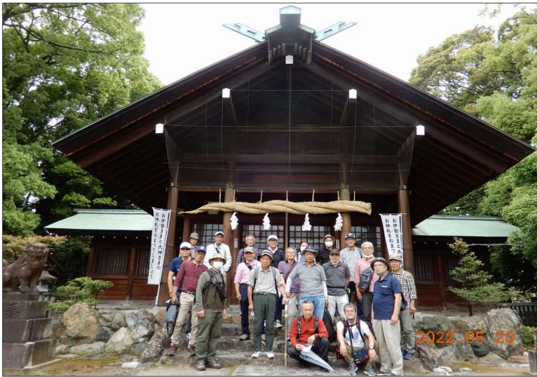
61 酒見神社の本堂の前で