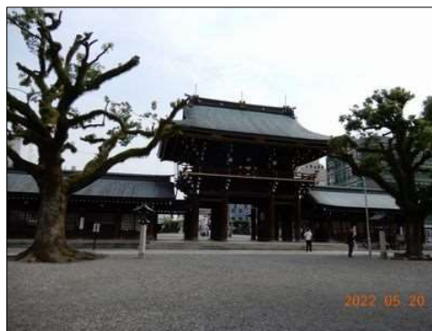
74 清掃が行き届いた境内