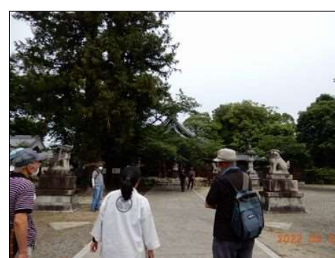
66 宮司に教えて頂く