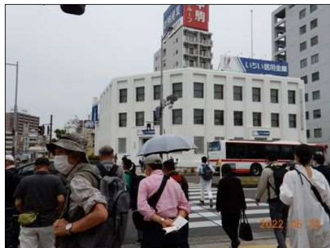
57 尾張一宮駅前で信号待ち