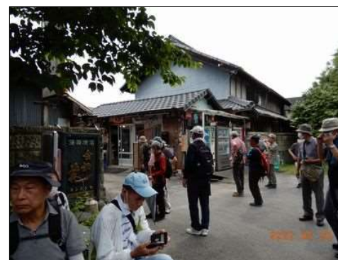
63 金銀花酒造に立寄る