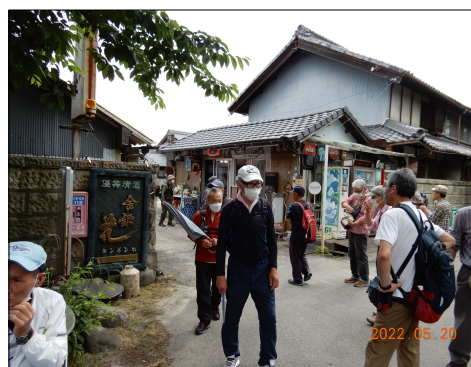
64 永ちゃんグッズ満載