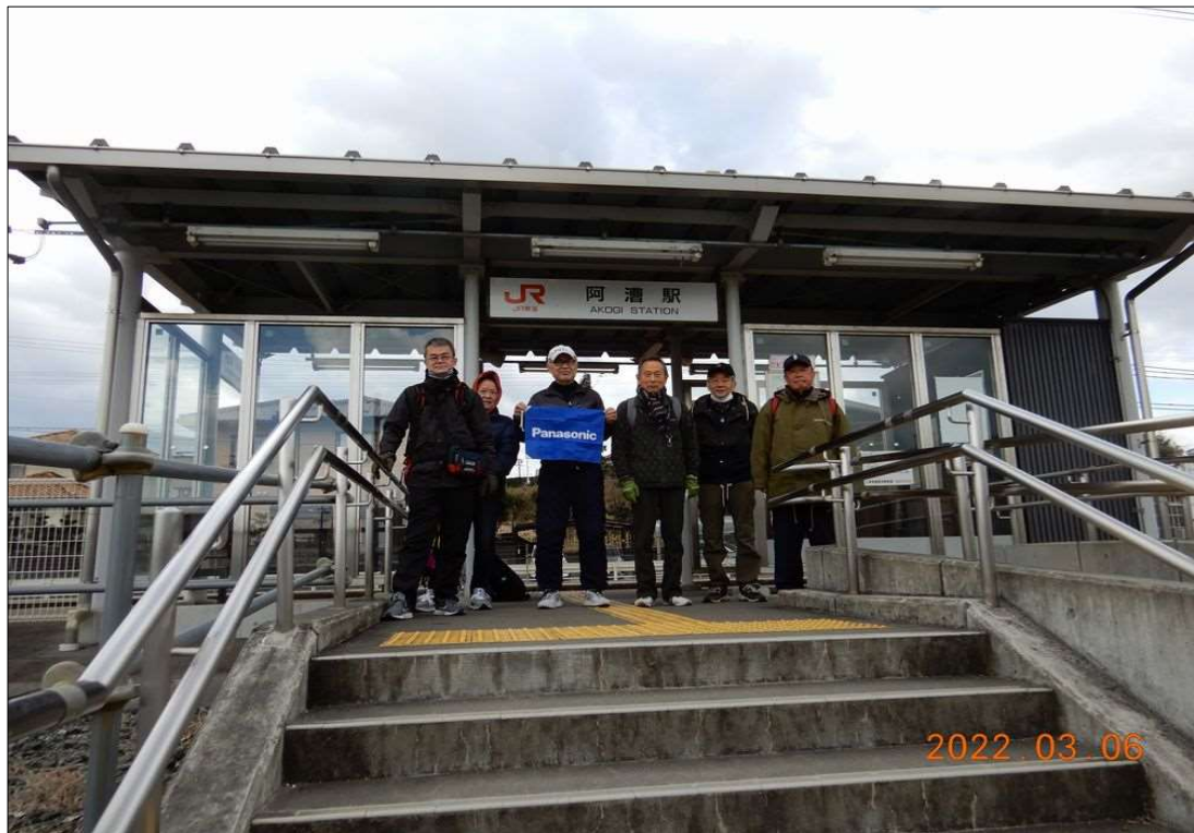
46 JR阿漕駅、6名で元気にスタート