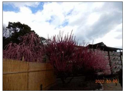
49 垣根越しに枝垂れ梅見える