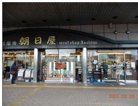
57 立ち寄った『朝日屋』