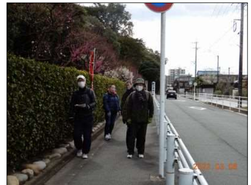
55 結城神社から出る