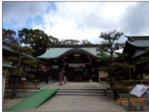
48 結城神社 本堂