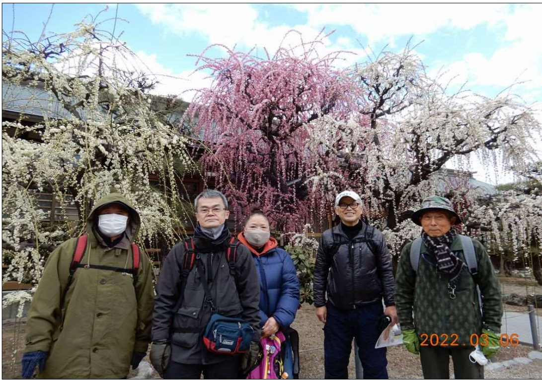
52 結城神社にて全員撮影