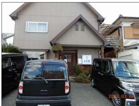
56 昼食のラーメン屋