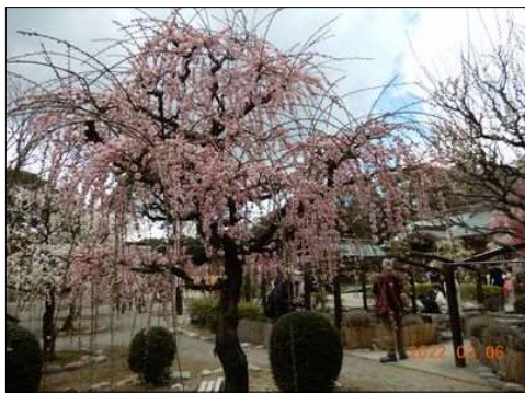
47 結城神社の枝垂れ梅