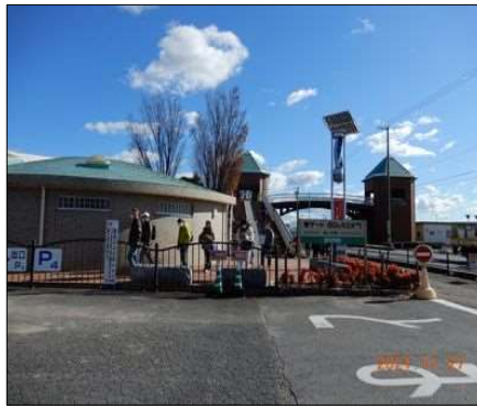
7 デンパーク入口に到着