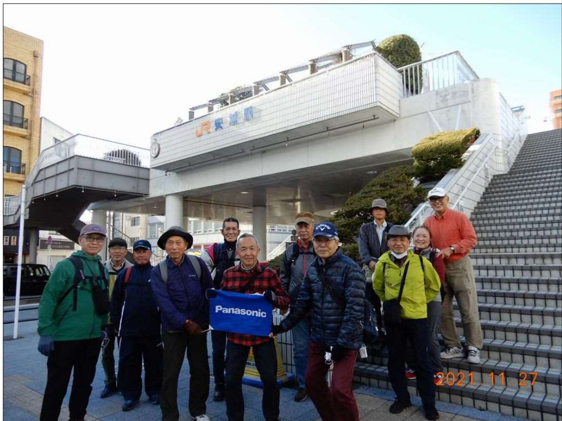
13 無事全員元気で安城駅にゴール！お疲れ様でした