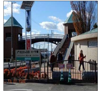
8 当社の風力発電機が稼働中