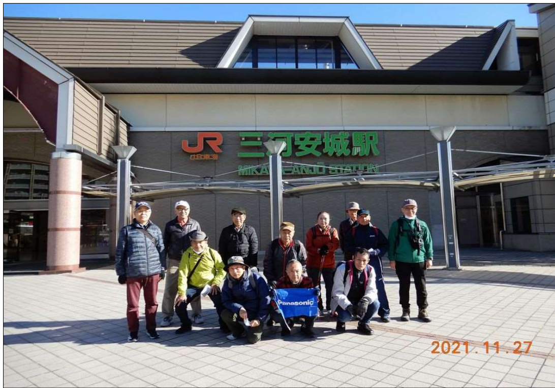
4 三河安城駅到着、13名でスタート