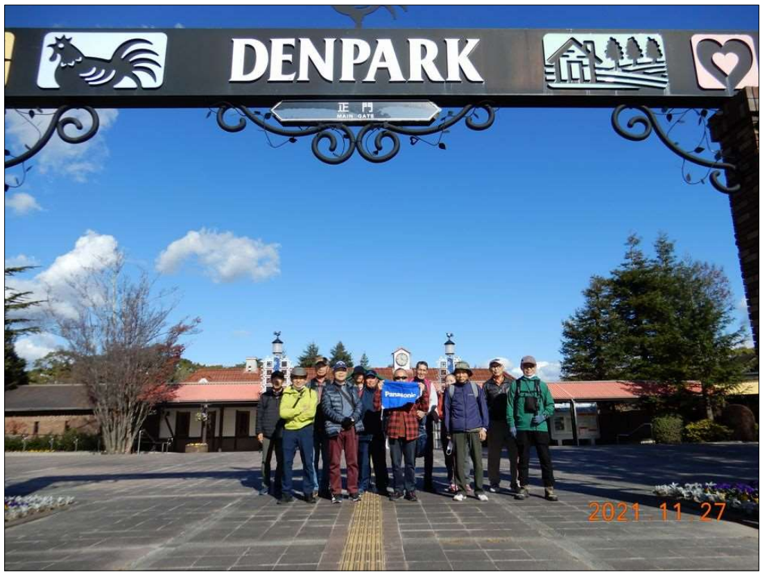
9 『デンパーク』 入口にて