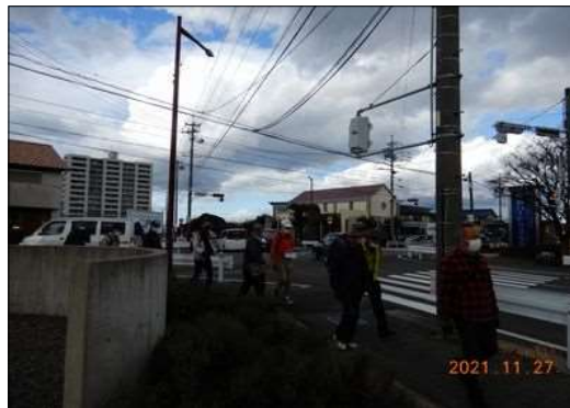
12 いざ ゴールの安城駅に