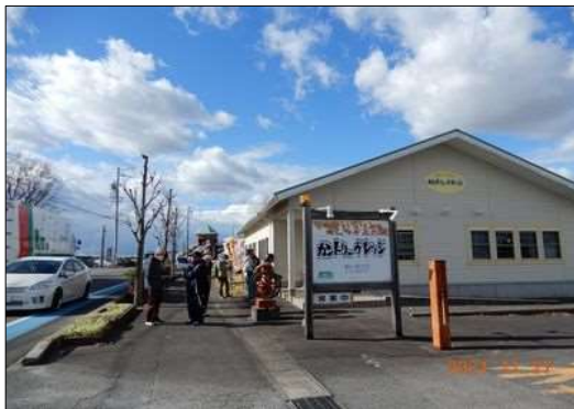
1 昼食会場『カントリー...』を出て